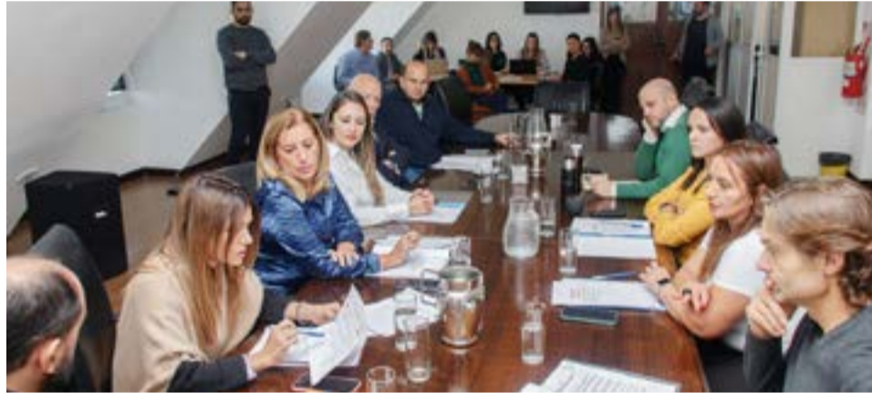
Desde la Secretaría de la Comisión, se dio lectura a la agenda de acciones que se llevarán a cabo, tanto en Río Grande como en Ushuaia y Tolhuin, previo al acto central por el Día del Veterano y de los caídos en la Guerra de Malvinas.

que la historia una vez más nos permite a nosotros ser parte y poder acompañar a estas mujeres que han dado sin ninguna duda, un testimonio fundamental para