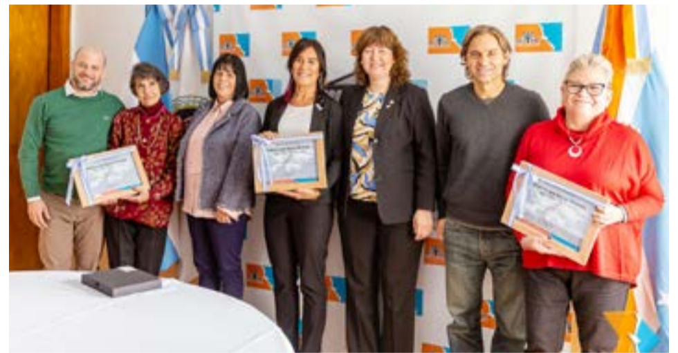
Resaltan la presencia de Veteranas de Guerra en la Provincia.

En ese sentido, el referente radical aseguró que "para nosotros es muy importante compartir este homenaje con ellas". En referencia a la poca difusión que se da habitualmente sobre la intervención de las mujeres en el conflicto, el Presidente del bloque radical recordó la decisión de la Cámara de "nombrar a uno de los colegios de nuestra Provincia como 'Ve-