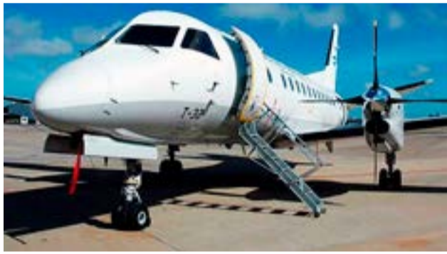
La compañía Líneas Aéreas del estado (LADE) unirá a las ciudades de Trelew y Bariloche, con una escala en Bahía Blanca a partir de abril.

El análisis de los costos automáticamente definirá la tarifa.