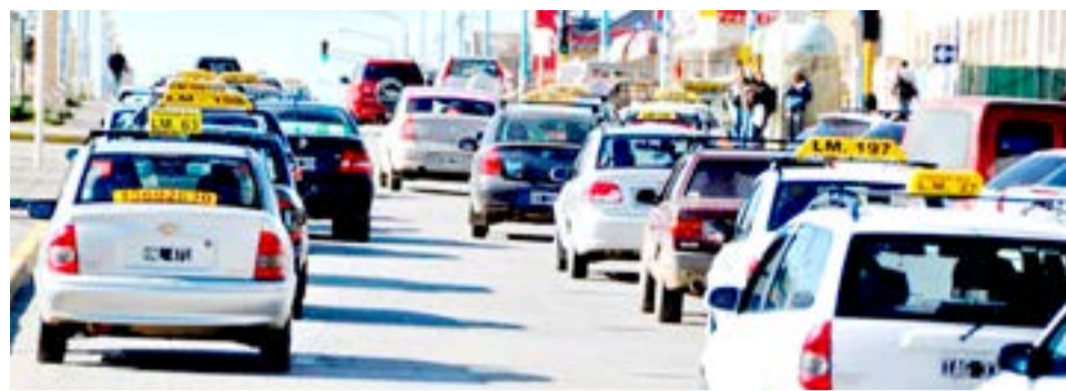
Tras seis meses, se actualizó la tarifa de taxi en Río Grande.

Justamente la Ordenanza Municipal N° 4139/2020 en su primer artículo modificó el artículo 22 de la Ordenanza Municipal N° 2067/05 que a su vez fue modificado por el artículo 1° de la Ordenanza Municipal N° 3673/17 y en que en buen romance estableció las tarifas del Servicio Público de Taxis serán determinadas cada seis meses, a previa solicitud de parte. Los pedidos de re determinación de tarifa deberán acompañar un análisis de costos que lo justifiquen, en base al índice de precios mayoristas del INDEC o en base al promedio del aumento de