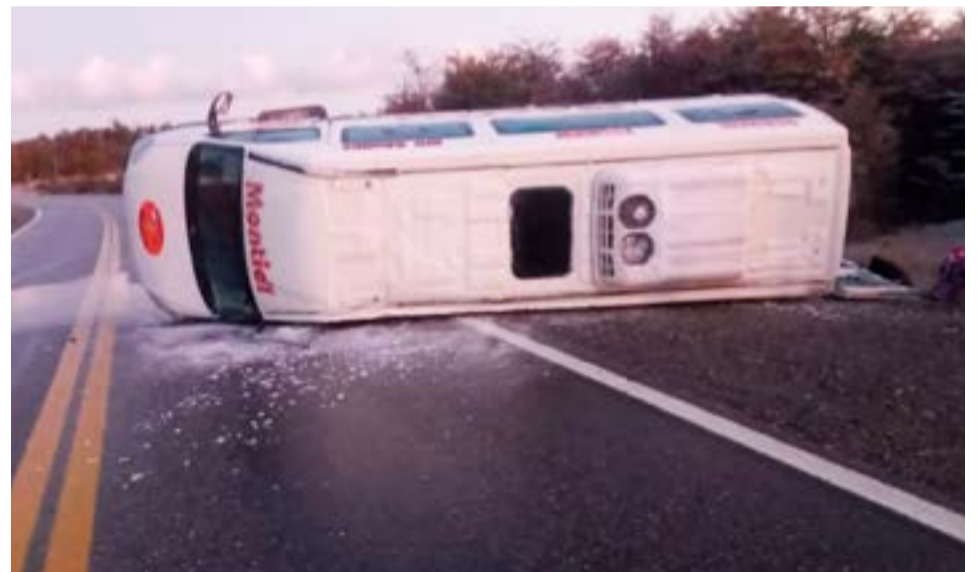
Volcó una combi y tres personas terminaron en el Centro Asistencial de Tolhuin.

Personal Policial de la Comisaría realizó las actuaciones en el lugar, junto a personal de la División Policía Científica Tolhuin, normalizándose el tránsito sobre la Ruta Nacional N° 3, horas después.