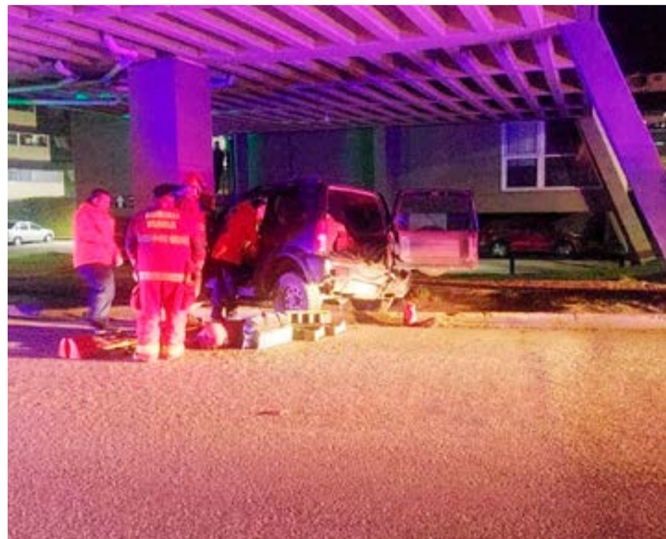
El conductor debió ser rescatado del interior de su camioneta tras chocar contra una columna en Pontón Río Negro y Gobernador Paz.

ría con el hombre, hasta tanto sea dado de alta médica.