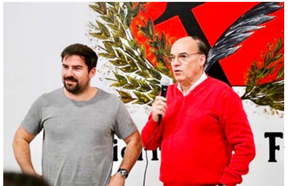
Federico Frigerio, actual diputado nacional y candidato a Vicegobernador por Juntos por el Cambio.

El fiscal mayor de Ushuaia Eduardo Urquiza manifestó que en la reforma de la Carta Orgánica de Ushuaia, los convencionales no aprobaron ninguna cláusula transitoria que inhabilite al intendente Walter Vuoto a presentarse a una nueva elección.