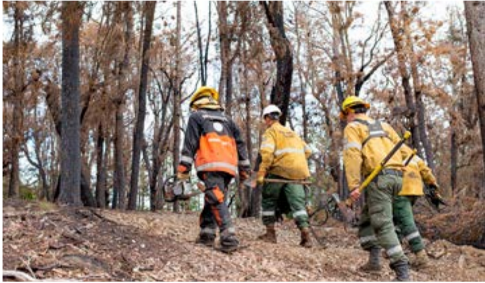
A cuatro meses de declarado el ígneo, los brigadistas siguen trabajando para extinguirlo.