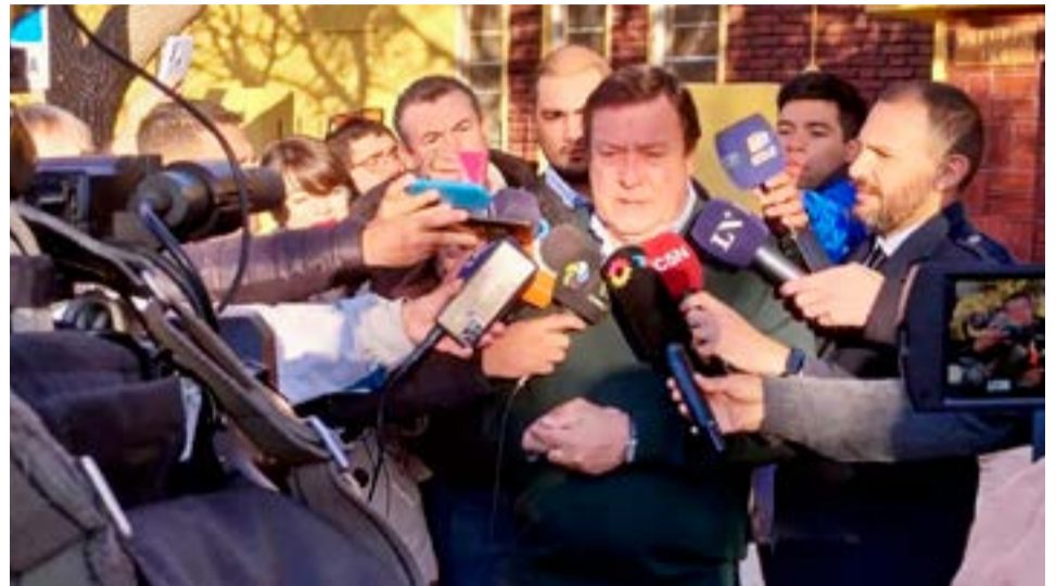
Con el 37% de las mesas escrutadas, el candidato a gobernador de Río Negro por el oficialismo local, Alberto Weretilneck, comenzaba a imponerse anoche sobre su principal rival, Aníbal Tortoriello, del frente Cambia Río Negro, expresión rionegrina de Juntos por el Cambio (JxC), aunque sin la UCR.

En total fueron nueve los candidatos a la gobernación. Además se eligieron representantes para las 46 bancas de la Legislatura, las intendencias de 22 municipios y autoridades de las 34 comisiones de fomento