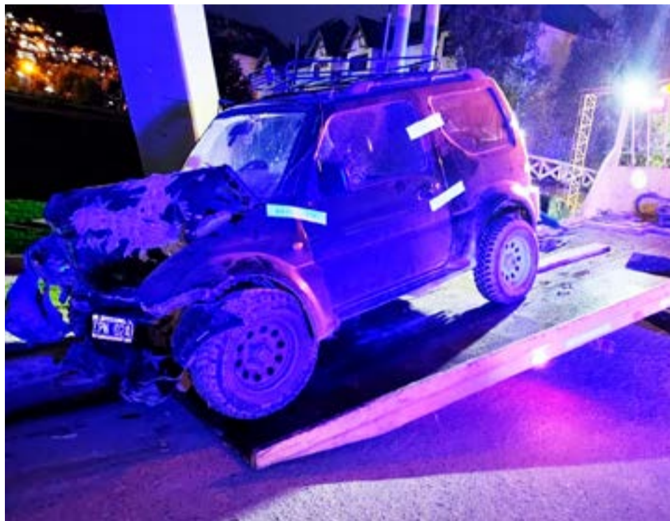
Personal de la División Policía Científica Ushuaia, tras culminar con su labor, indicó no haber encontrado indicios que haga presumir la participación de un segundo vehículo.

haga presumir la participación de un segundo vehículo.