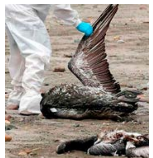
Se le realizó examen al cuidador de la estancia que está a 200 metros de la laguna y a dos personas del Servicio Agrícola y Ganadero (SAG) que si bien utilizaron sus elementos de protección personal, tuvieron contacto con el cisne muerto. (Imagen ilustrativa).