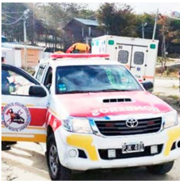
El viernes por la mañana, personal de Bomberos Voluntarios Zona Norte fue convocado a un domicilio del Barrio de Andorra, donde una mujer de de 19 años quien gestaba un embarazo de 6 meses, comenzó con contracciones.

Para continuar con el cuidado y control de la mamá y la bebe 09,15 horas. se hace presente una enfermera del periférico 9 quien termina de asistir hasta la llegada del móvil sanitario y posterior traslado.