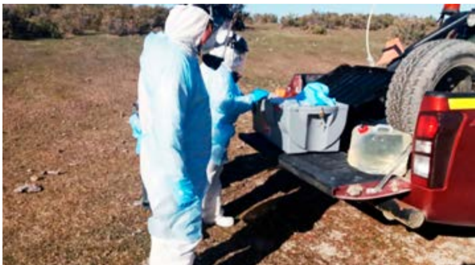
Tres personas fueron examinadas por la Seremi de Salud consideradas como “posiblemente expuestas” a un caso de Gripe Aviar que se detectó en ejemplares de cisnes de cuello de negro en la Laguna Santa María, comuna de Porvenir.