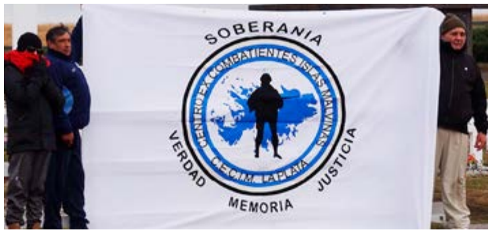
El próximo miércoles y jueves, una comitiva de la Comisión Provincial por la Memoria (CPM) y el CECIM (Centro de Ex Combatientes de Islas Malvinas La Plata), estarán presentes en Tierra del Fuego para realizar una serie de actividades públicas tendientes a reclamar el avance de la causa por las torturas en Malvinas durante el conflicto bélico.

Si bien la CPM participa de estas jornadas en su calidad de querellante institucional en la causa, la presencia de estos referen-