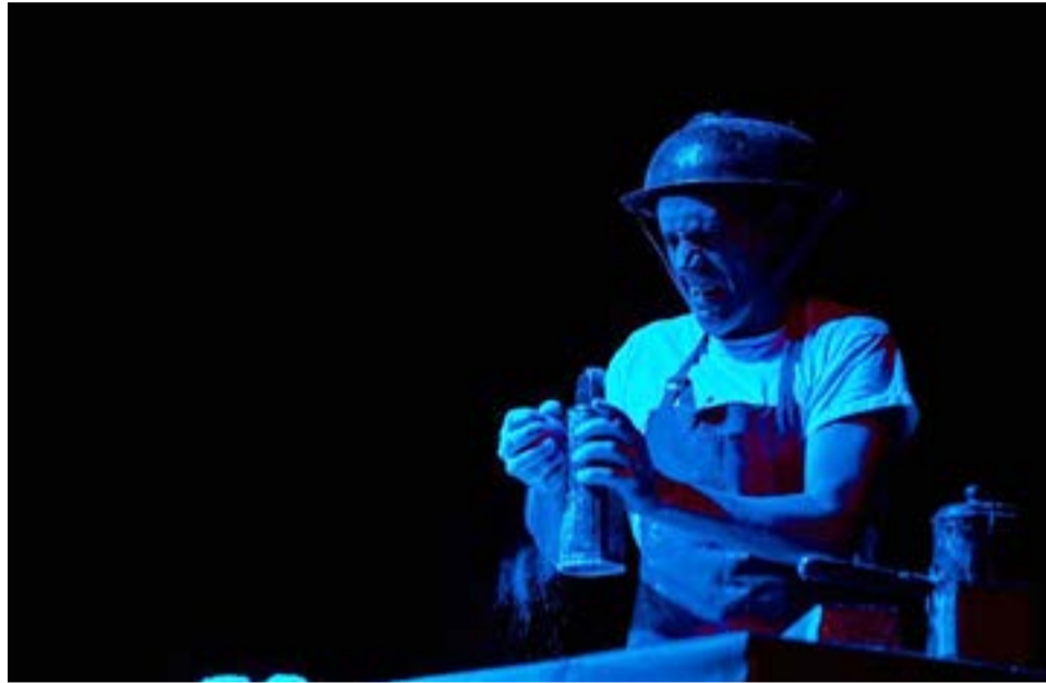
Ushuaia fue la primera ciudad del país donde se presentó la obra teatral “Con un kilo de harina”.