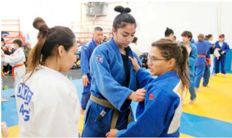
Detallando a continuación por disciplina a las y los deportistas que fueron seleccionados en la "IX Edición de los Premios Ciudad de Río Grande".