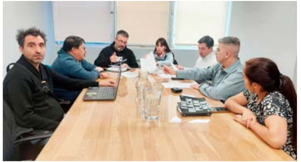
El pasado viernes, 14 de abril, se retomó el cuarto intermedio de la Mesa Paritaria Salarial, en el marco de la Ley Nro. 424, en la ciudad de Ushuaia.

Posteriormente desde el SUTEF se planteó que frente al proceso inflacionario que no cesa, la falta de control de precios y alquileres, se reitera el pedido del Congreso Provincial de Delegadas y Delegado de mantener los mismos parámetros y porcentajes establecidos durante el primer cuatrimestre.