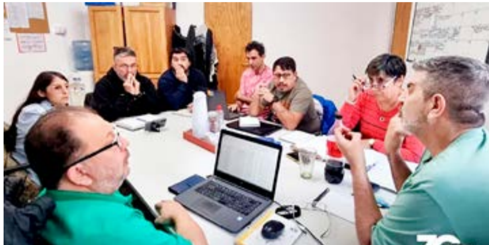
El pasado viernes, se retomó el cuarto intermedio de la Mesa Paritaria Salarial en el marco de la Ley Nro. 424, en la ciudad de Río Grande.

En primer término, desde SUTEF se manifestó una “profunda preocupación por los últimos acontecimientos en la econo-