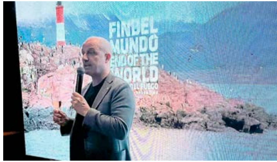
Los eventos se realizaron en el Bar Catch, Córdoba con la participación de 70 personas y en Anselmo, CABA, con más de 100 invitados, quienes disfrutaron de la presentación del destino junto con las activaciones y degustaciones.

de los prestadores de servicios turísticos locales, referentes de centros invernales,