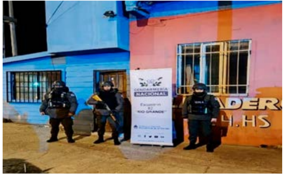
Personal de Gendarmería estuvo a cargo de los procedimientos que fueron ordenados por la Justicia Federal de Río Grande.

En ese marco los efectivos de la Unidad de Investigaciones de Delitos Complejos y Procedimientos Judiciales "Ushuaia", Unidad de Reunión de Información "Ushuaia", Grupo Operativo de Investigaciones y Procedimientos dependien-