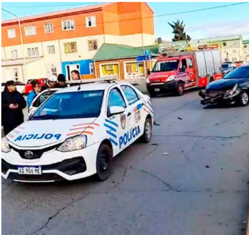
En Río Grande se registró un choque con un patrullero involucrado y un policía lesionado.

Río Grande.- Este domingo pasadas las 16 horas, un patrullero de la Comisaría Tercera de Chacra II fue impactado de atrás por otro vehículo en la intersección de las