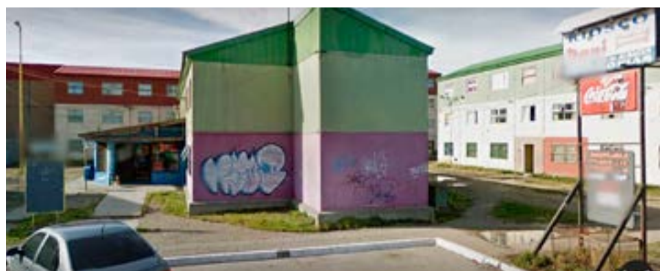
Un hombre terminó hospitalizado luego de haber recibido una golpiza en el barrio Chacra II.

Respecto a la víctima se encuentra hospitalizado siendo intervenido quirúrgicamente por posible fractura de cráneo.