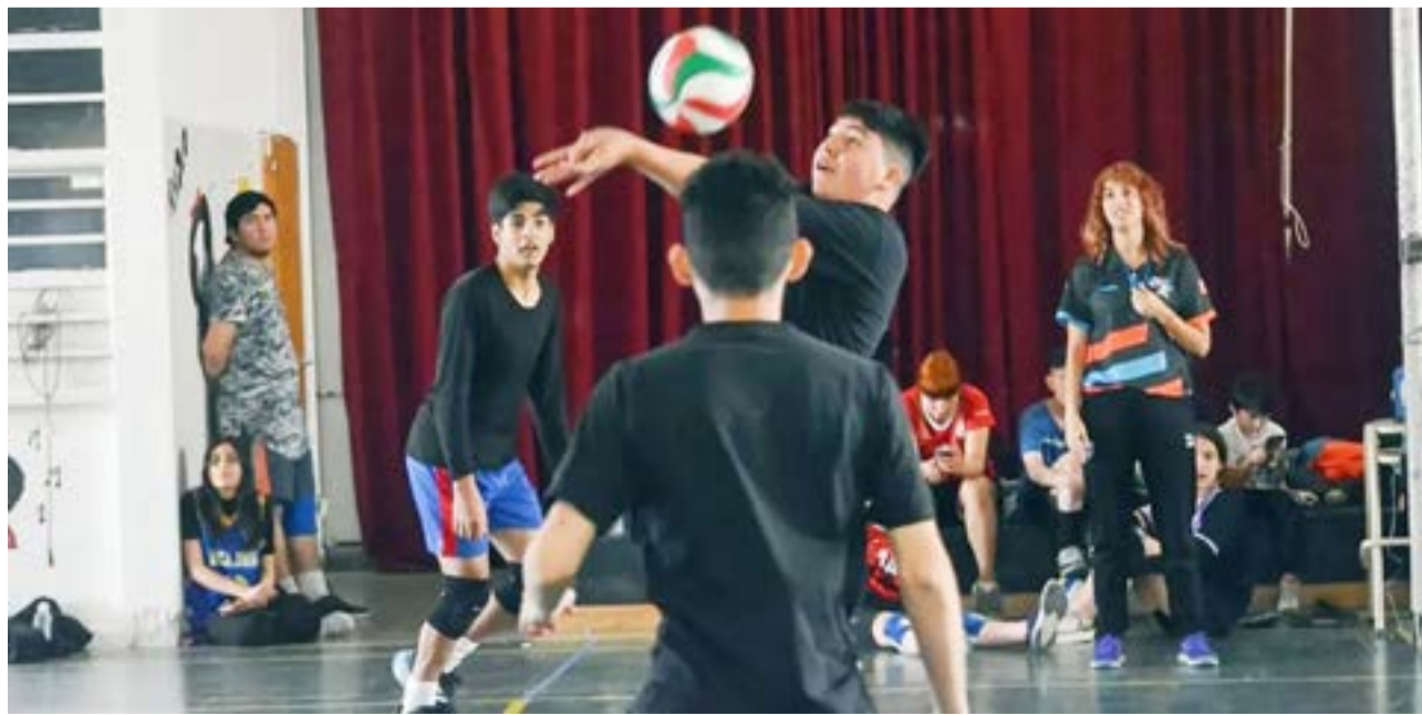
La Secretaría de Deportes y Juventudes ofrece más de treinta propuestas de las Escuelas Deportivas que se desarrollan actualmente en la ciudad de Río Grande.

Para más información sobre días, horarios y espacios; invitamos a visitar las redes sociales de la Secretaría de Deportes y Juventudes, en Facebook como Subsecretaría Provincial de Deporte TDF AIAS y en Instagram como deportestdf_aias.