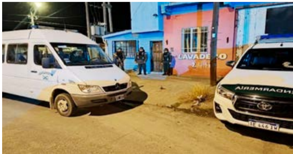
Una mujer detenida como posible regenteadora y otras 7 mujeres rescatadas en el marco de una causa por trata de personas con fines de explotación sexual.

Durante las actividades investigativas realizadas, que demandaron varios meses, los funcionarios reunieron valiosos elementos probatorios para sostener que, en los domicilios investigados, se realizaban actividades que guardan correspondencia con aquellas tipificadas en la Ley 26.364 de Prevención y Sanción de la Trata de Personas.