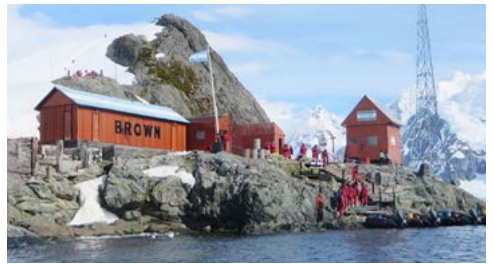
La base Brown está emplazada en la Península Sanavirón de la Bahía Paraíso, a los pies de un peñón llamado Punta Proa; el lugar fue llamado así porque ese sector de las costas de la Península Antártica está protegido de las mareas por las islas que la rodean. También está resguardado de los vientos por altos cerros nevados entre los que se consolidan altos glaciares.

"Hay que tener en cuenta que la base Brown no es una atracción turística, es una estación científica y como tal todos los días tiene que completar su cronograma de actividades de investigación y logísticas, si nos piden permiso para desembarcar en un momento en el que los científicos están trabajando, o los botes salieron a recoger muestras, o estamos en