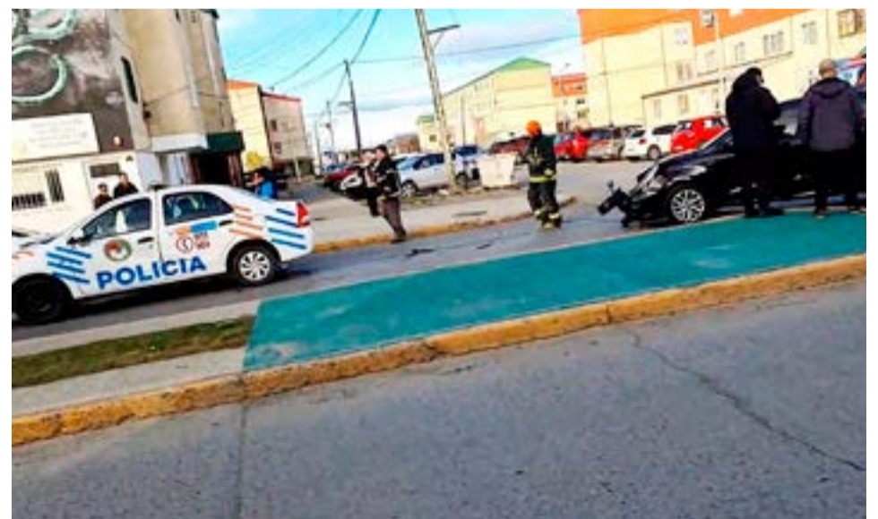
El hecho se registró sobre Prefectura Naval y Arturo Illía de Chacra II, a metros de la Comisaría Tercera.

El mayor daño material entre estos rodados fue el Fiat Cronos con la rotura de todo el paragolpes delantero.