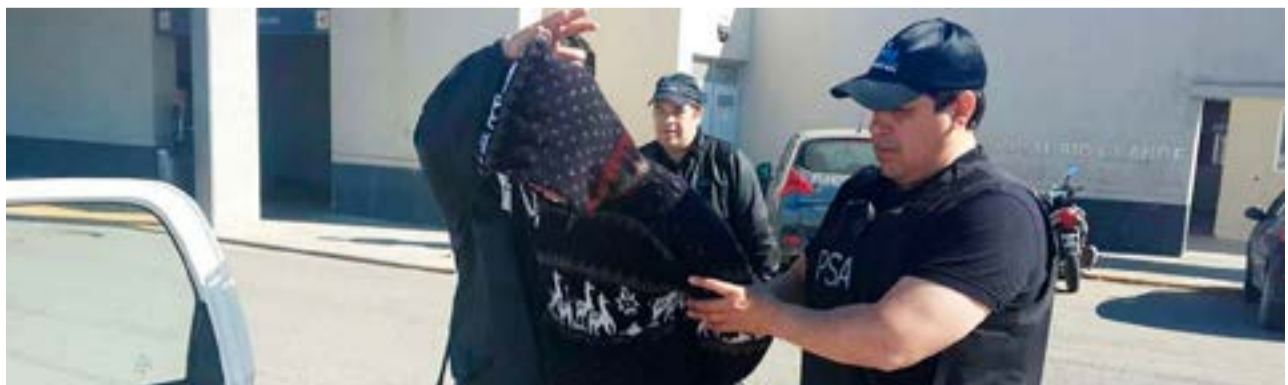
Prófugo en una causa de abuso sexual intrafamiliar, luego de 6 años, será extraditado a Río Grande. (Imagen de archivo)

Desde Río Negro mantuvieron contacto con el juzga-