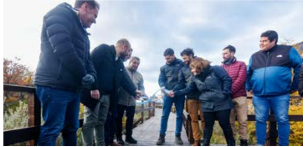
La Municipalidad de Ushuaia acompañó a parques nacionales en la inauguración de nuevas obras en Bahía Lapataia y en Laguna Negra.

serva natural, es asiduamente visitada por los turistas y vecinos y vecinas de la ciudad y el flujo tiende a seguir aumentando.