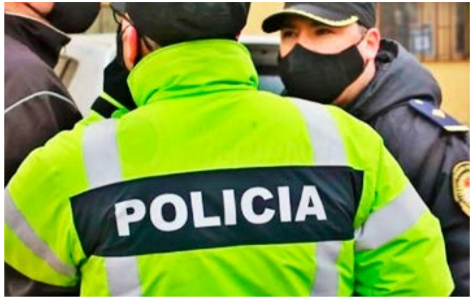
Son tres las personas detenidas por el ataque a un hombre en Chacra II.

Finalizados los diligenciamientos judiciales con resultados positivos, se procedió a la detención en carácter de incomunicado de un total de tres hombres, todos mayores de edad, quienes serán indagados en las próximas horas.