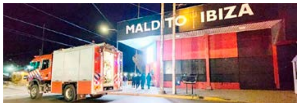
Allanaron un domicilio lindero al local.

Hasta el momento, no hay personas imputadas de semejante episodio que, por fortuna, no terminó en una tragedia.