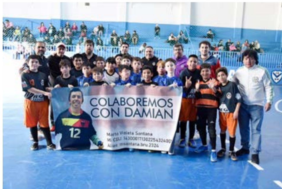
Los equipos de Pingüino vs. Tigre, categoría sub-11.