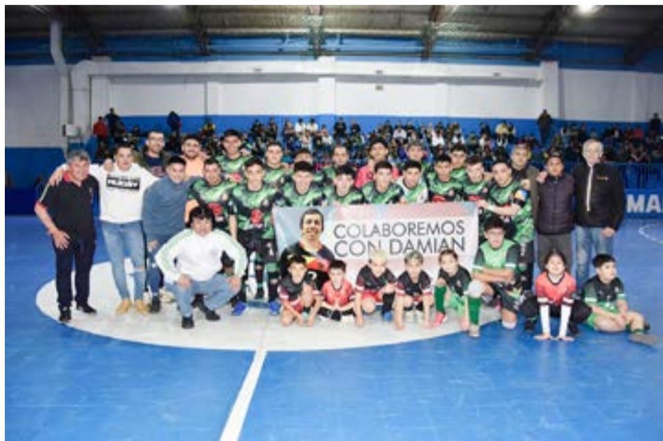
Los equipos de Estrella Austral vs. Luz y Fuerza, primera división.