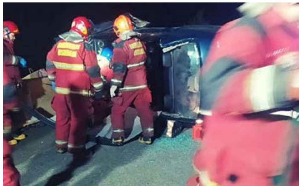
Estado en que quedó la unidad siniestrada en la capital fueguina.

Los dos ocupantes del taxi, debieron ser trasladados al Hospital Regional Ushuaia.