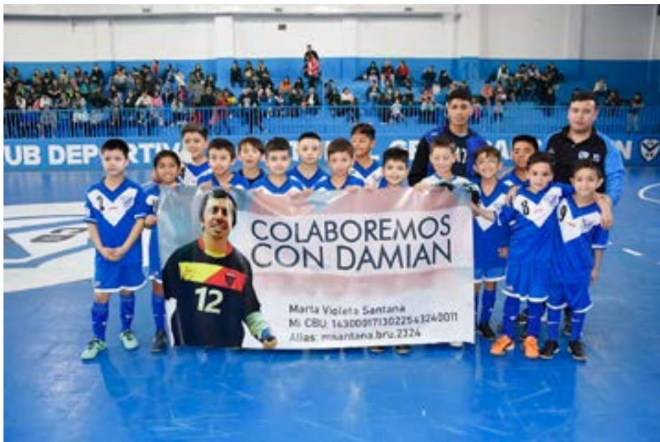
.El equipo de San Martín, categoría sub-9