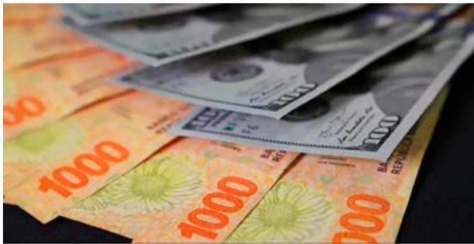
Los dólares paralelos iniciaron el primer día hábil de la semana con un nuevo salto, que llevó al libre por encima de los $460, un incremento superior al 4,75% en un día

Aunque a mediano plazo el panorama luce más despejado desde la perspectiva del mercado, ya sin sequía y con lo que se presume un futuro gobierno “moderado”, lo cierto es que el tránsito hasta las elecciones es una fuente de inestabilidad. A través del director argentino en el FMI, Sergio Chodos, el propio Gobierno admitió que negocia el adelantamiento de desembolsos por parte del organismo en el marco de una revisión completa del acuerdo, al tiempo que acusó a economistas de la oposición de pedirle al organismo que rechazara esa solicitud oficial. En el medio, los datos de las cuentas públicas del primer trimestre arrojaron un incumplimiento de las metas fiscales, con lo cual los rumores de una eventual devaluación, que exigiría el FMI como contrapartida al giro de dinero fresco, hacen mella en el mercado y agregan más presión el dólar.