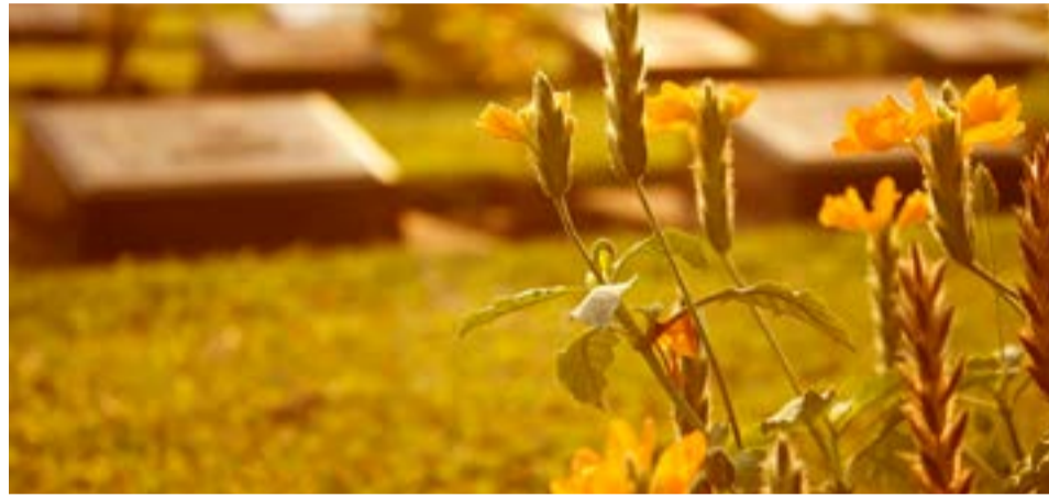
La "Fundación León para el Desarrollo Humano" anunció la construcción de un cementerio parque en la ciudad de Río Grande.

En ese sentido, manifiestan que postulan "La construcción de un Cementerio Parque, para el reordenamiento urbano y ambiental en la Ciudad de Río Grande te-