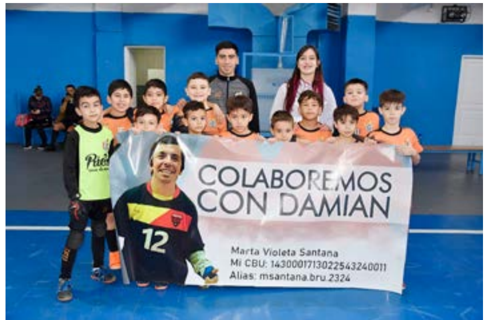
El equipo de ADEFU, categoría sub-9.

la familia -la familia lo quiere mucho-, es un chico muy respetuoso, se hace querer mucho, así es ojalá Dios quiera que esto sea solamente un sueño y el día de mañana nuevamente otra vez por las canchas ya que le encanta jugar y disfrutar de