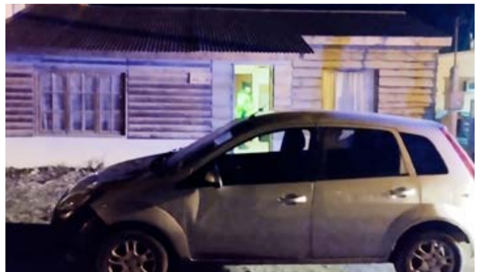
Dos mujeres quedaron detenidas tras irrumpir en una vivienda y agredir a una tercera persona.

tomar declaración indagatoria, otorgó la Libertad de ambas detenidas con medidas de protección hacia las víctimas.