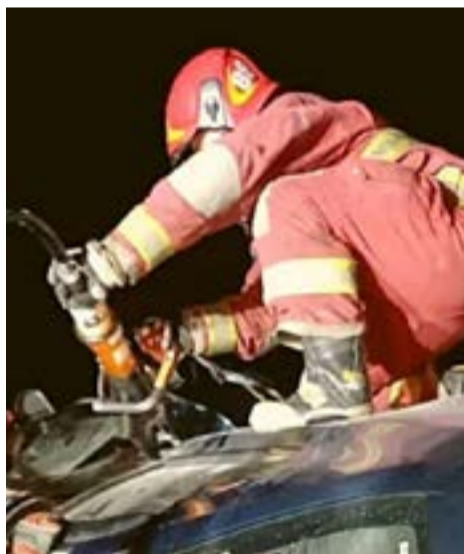
Dos personas fueron rescatadas de un taxi que chocó en la zona del Martial.

El vuelco de un taxi en la zona del Martial, a la altura del restaurante Chef Manu ocurrió alrededor de las 06:00 hs de este lunes. Personal de Bomberos Voluntarios de la capital fueguina intervinieron y lograron rescatar a dos personas que estaban atrapadas dentro del rodado. Ambos heridos debieron ser trasladados al Hospital Regional Ushuaia.