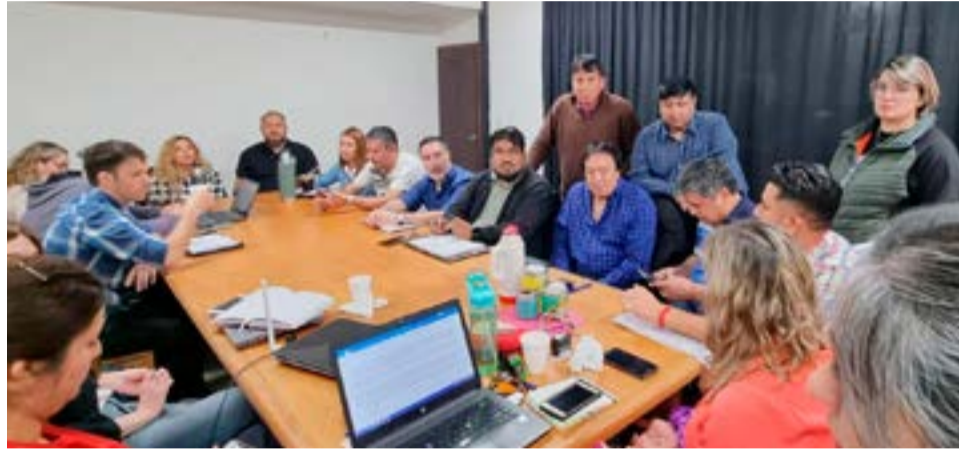
En la ciudad de Tolhuin, representantes de ATE, ATSA, UPCN y el Gobierno provincial llevaron adelante una nueva mesa técnica, en el marco de las negociaciones paritarias para los escalafones seco y húmedo.

finiciones relacionadas con el tema salarial y con algunos ítems que estaban pendientes de resolución.