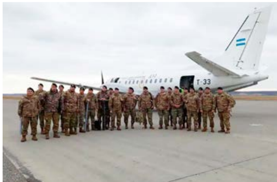
La Brigada Mecanizada XI, está a cargo de la actividad, de la que también participan miembros del Comando de la Fuerza de Infantería Marina Austral, integrado por el Batallón de Infantería Marina 4 y 5, junto al Destacamento Naval Río Grande y personal de la Fuerza Aérea con aviones de transporte SAAB 340 pertenecientes a la IX Brigada Aérea con asiento en Comodoro Rivadavia.