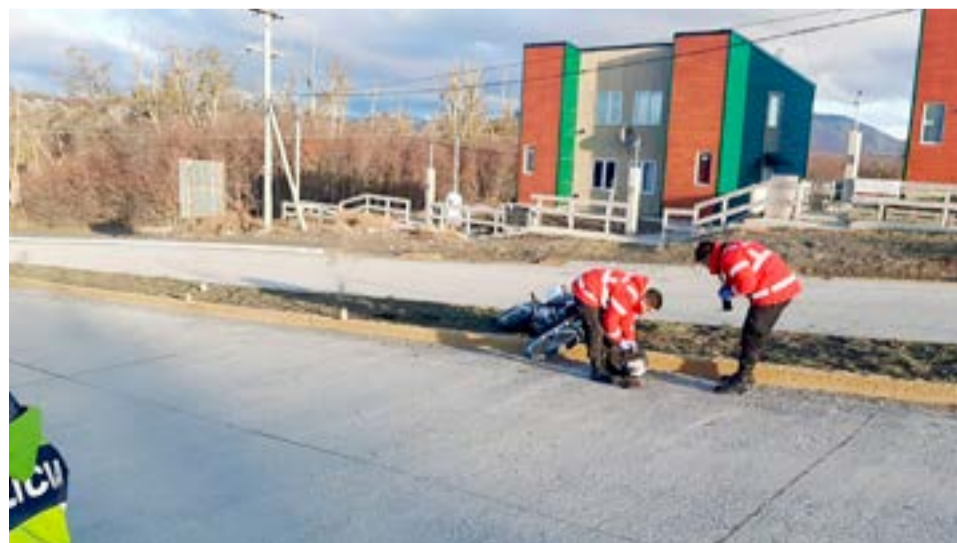
Un hombre sufrió una caída en su moto y terminó hospitalizado.

Debido a que el accidentado requería de estudios de mayor complejidad, fue derivado hacia el Hospital Regional Río Grande.