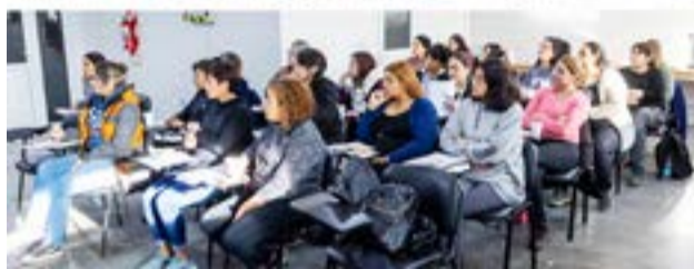
El Municipio de Río Grande, a través de la Secretaría de la Mujer, Género y Diversidad, dio inicio al Curso de Manejo de Auto Elevadores.