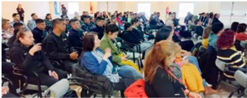
Se han conformado equipos que capacitan a servidores públicos y brindan charlas a los jóvenes que atraviesan situaciones difíciles.

mes de prevención en septiembre y se puede encontrar información en sus redes sociales.