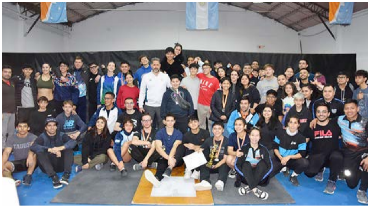
Delegaciones de El Calafate, Río Gallegos, Rawson, Ushuaia, Tolhuin y Río Grande completaron exitosamente la segunda fecha del circuito Patagónico de Levantamiento Olímpico.

Coto: "Para cerrar quiero agradecer a todos los profesores que colaboraron de inicio a fin, estuvieron espectacular, y felicitar a la gente que vino de El Calafate, Río Gallegos y de Rawson, la verdad es que sabemos muy bien lo que cuesta hoy viajar, los costos que implica eso y hacer el esfuerzo, pero bueno esto es un compromiso que asumimos todos para que esta actividad siga en constante crecimiento, nosotros vamos a hacer lo mismo cuando nos toque viajar a sus lugares, y agradecer especialmente al (CePAR) de Ushuaia, Tolhuin y Río Grande porque siempre estamos empujando de este carro entre todos, y eso nos pone súper contentos, a todos muchas gracias", finalizó