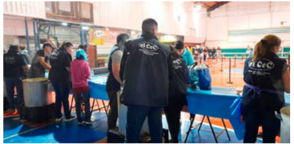
El Centro de Empleados de Comercio de Río Grande y Tolhuin entregó más de 4000 porciones de locro este lunes, por el Día del Trabajador.

Respecto de la conmemoración, dijo que el deseo fue “que los compañeros y las compañeras lo pasen lindo junto a