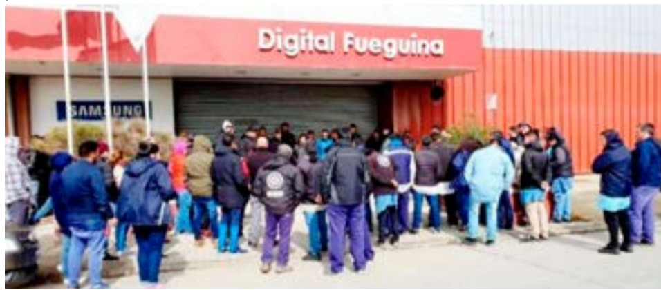
Trabajadores y trabajadoras pretenden hacer “un llamado a la conciencia para los vecinos de Río Grande en general”, visibilizando la crítica situación en la cual se encuentran.