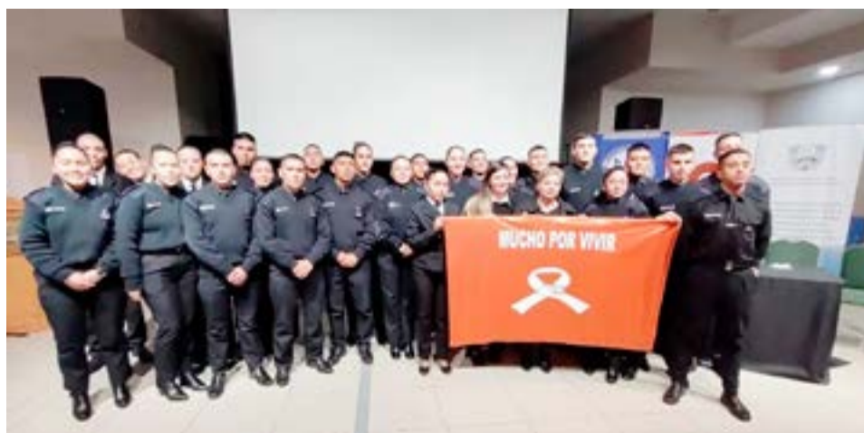
‘Mucho por Vivir’ de Río Grande trabaja con instituciones en prevención del suicidio.

“También, cuando por ahí hay un abuso, los chicos por ahí detonan en no querer vivir, pero sabemos que siempre que uno puede hablarlo y ponerlo en palabras al dolor, porque la mayoría de las personas