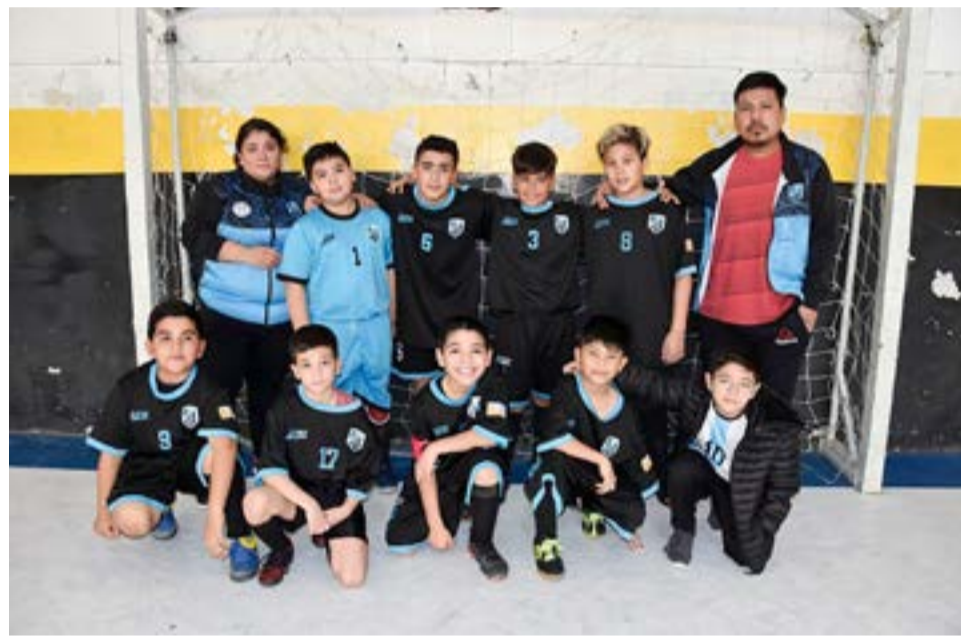
El equipo de Rosario, categoría C-11.

participativas como así también las competitivas, vienen desarrollando una evolución por demás aceptable y dejando bien el claro la fuerte presencia salonista