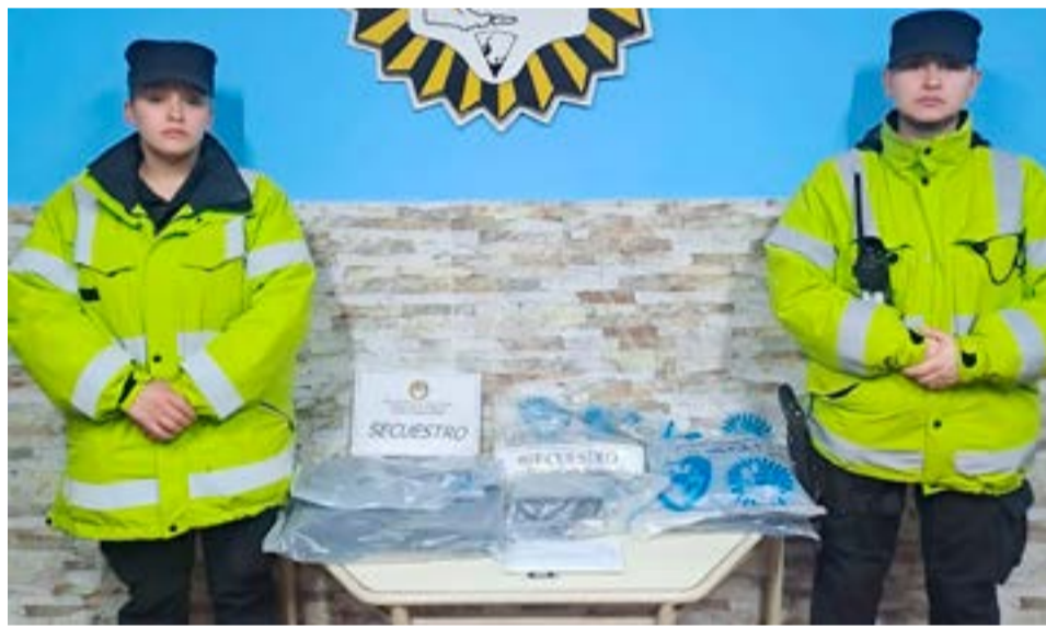
Recuperan elementos que habían sido hurtados de un automóvil en Ushuaia.

De dicha medida resultó positiva dado que se pudieron secuestrar los elementos de interés para la presente causa.