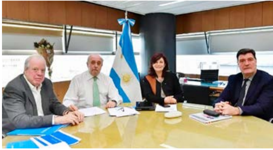
La ministra de Trabajo, Kelly Olmos ratificó la política para afrontar el incremento sostenido de precios con paritarias y revisiones, y volvió a descartar que el pago de sumas fijas aminore la corrosión salarial.

Olmos hizo foco sobre el empleo en crecimiento sostenido y el "vigor con el que se pelean las paritarias que asumen la heterogeneidad de cada sector y las características de cada actividad, de su composición entre empresas más grandes o pymes. No podemos decir que una sola definición resuelve un mundo tan heterogéneo como el laboral", sustentó la funcionaria nacional.