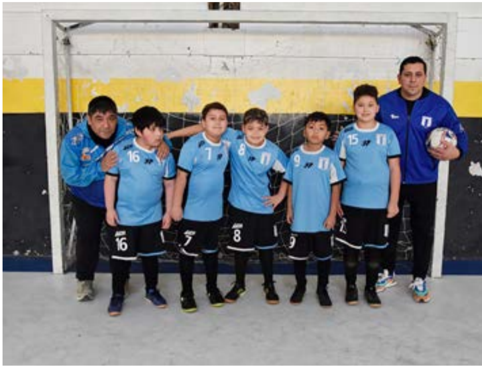
El equipo de O'Higgins, categoría C-11.