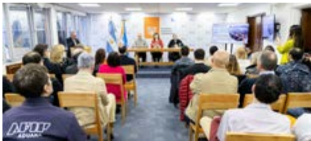
Ayer las autoridades provinciales brindaron una conferencia sobre el cierre de la temporada de cruceros.

Asimismo, recordó que "muchos nos preguntaban qué iba a pasar con el Puerto y si efectivamente íbamos a concretar la ampliación para prestar mejores servicios y para no perder este mercado tan importante para la provincia. Con mucho esfuerzo y a pesar de la pandemia, esto fue posible y hoy contamos con una ampliación de 104 metros de muelle y 22 metros más de dolphin". La Vicegobernadora agradeció el apoyo del Gobierno nacional; de la Administración General de Puertos y