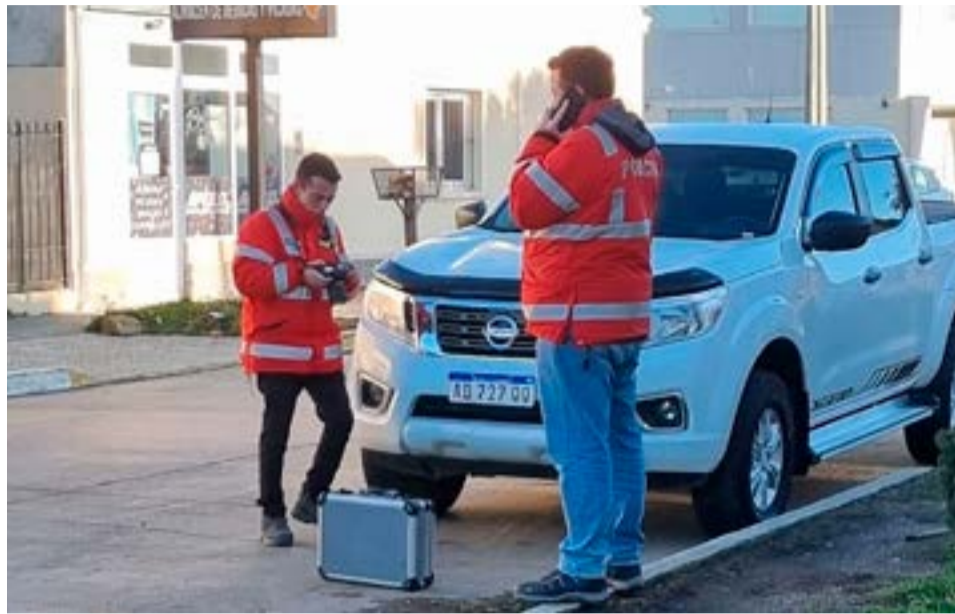
18 personas fueron notificadas de derechos y garantías por los daños y detonaciones en el barrio Buena Vista.

Se procedió a la notificación de derechos y garantías a las 18 personas mayores de edad localizadas en los domicilios objeto de diligenciamiento.