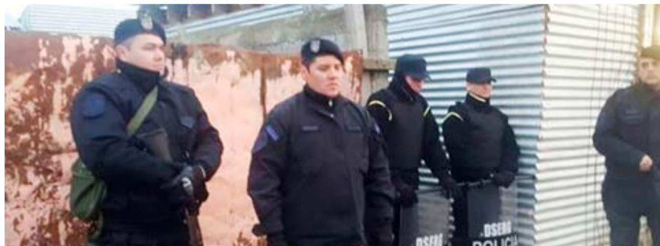
Allanamiento positivo en torno al robo en un obrador del barrio San Martín Norte.

propietario previo reconocimiento de las piezas de perfilería denunciadas como sustraídas.