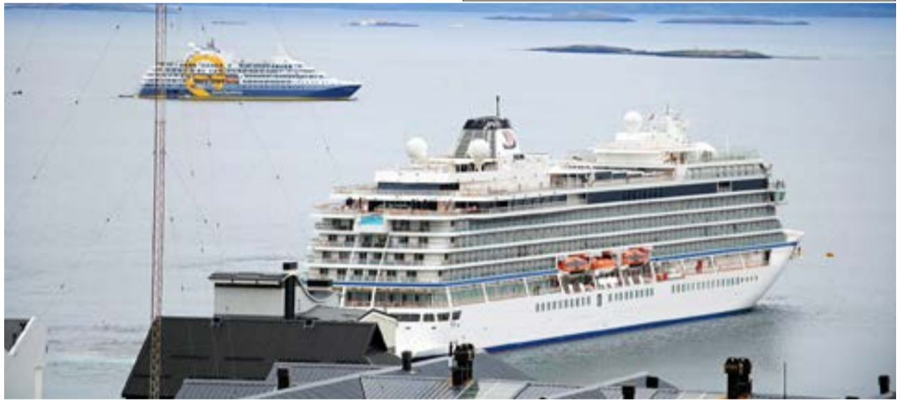
Culminó la temporada de cruceros con cifras récord.

Urquiza aseveró que "todo esto se logró porque hemos cumplido con un objetivo que teníamos al iniciar la gestión y que era el de poder trabajar con todos y todas. Y aquí los privados son un socio estratégico desde todo punto de vista, ya que sin ellos el Estado no tiene razón de ser".