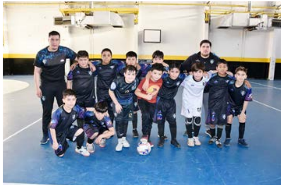
El equipo de Luz y Fuerza, categoría C-11.

que hoy día todos los clubes riograndenses aplican cada fin de semana, quedando en evidencia el muy buen trabajo y con qué seriedad la (FFF) disputa este especial campeonato en nuestra ciudad. Detallar además que desde el inicio del certamen; si bien la información por parte de la federación que debería entregar a los comunicadores acreditados llega muy a destiempo o directamente no informan en lo que respecta a las tablas de posiciones en todas sus categorías, “si así debo decir claramente en tiempo y forma los resultados finales de cada semana”, convengo informar que