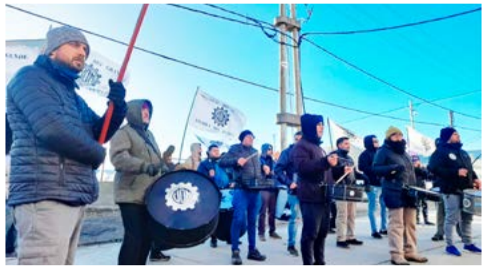
Los metalúrgicos de Río Grande cerraron el acuerdo salarial y vuelven a las paritarias en junio.

Las y los metalúrgicos riograndenses también lograron conformar dos mesas de trabajo en conjunto con la cámara empresarial, una para mejorar el tratamiento por parte de las aseguradoras de riesgo de trabajo (ART) y otra para mejorar la continuidad laboral que tienen de contratados.