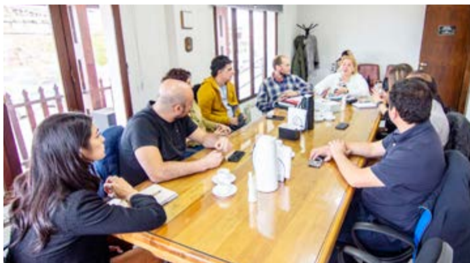
Por otra parte la Cámara de Comercio analizó el nuevo proyecto de recolección de residuos comerciales.

A partir de esto último, el funcionario municipal dijo que “la generación de empleo a través de los residuos debe ser un compromiso que deben asumir tanto los privados como el Municipio”.