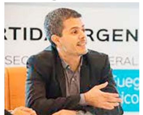
Andrés Dachary, Secretario de Malvinas, Antártida, Islas del Atlántico Sur y Asuntos Internacionales.

pretendidas e ilegítimas autoridades británicas que ocupan nuestras Islas Malvinas, las cuales no reconocemos como válidas. Muy por el contrario, se requirió mayor información y documentación para avanzar en distintas alternativas que están previstas en nuestra propia legislación, entre ellas la posibilidad de la presentación de elementos probatorios supletorios dada la situación de usurpación que hoy padece parte de nuestro territorio provincial”.