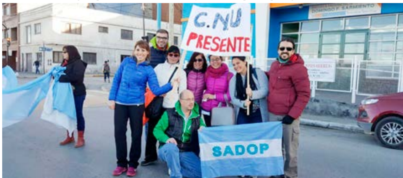
Desde el Sindicato Argentino de Docentes Particulares (SADOP) convocaron a un paro de actividades para el próximo viernes, con el objetivo de reclamar el pago del ítem Ayuda de Material Didáctico.

“Fieles a nuestra conducta hemos agotado todas las instancias en aras de resolver el conflicto por otros medios, y lamentamos tener que recurrir a esta medida por la incomprensión de nuestros empleadores y del estado provincial”, concluye el comunicado.