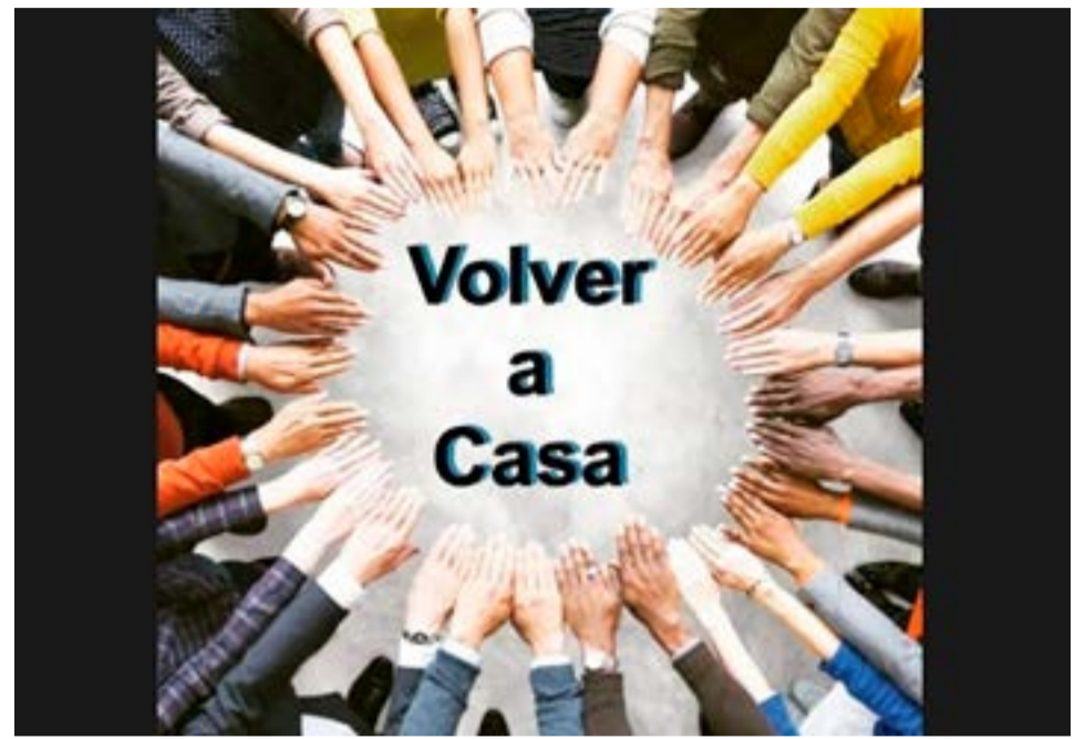
La familias que integran “Volver a Casa”, quienes tienen hijos e hijas estudiando en el norte del país”, advirtieron que la supuesta “tarifa especial” de Aerolíneas Argentinas para los fueguinos, no es lo que se encuentran solicitando.

Además, desde julio Aerolíneas realizará 2 vuelos semanales entre Ushuaia y San Pablo, en Brasil, los jueves y domingo, en operaciones que forman parte de los vuelos de temporada alta de invierno, época en la que la línea aérea también incrementará sus vuelos regulares desde Buenos Aires.