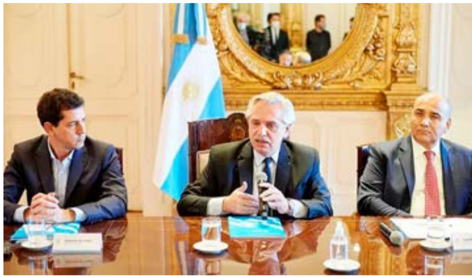
El Gobierno entró en estado de ebullición ayer por la tarde después de conocer que la Corte Suprema había suspendido las elecciones en Tucumán y San Juan cinco días antes de los comicios, para investigar los cuestionamientos que presentó Juntos por el Cambio contra las candidaturas de los actuales mandatarios provinciales, Juan Manzur y Sergio Uñac.

La decisión tomó por sorpresa a los ejecutivos provinciales, que, dicen, se enteraron por los medios que difundieron el documento judicial, y sopesaban cómo proceder. Más allá de las acciones legales y políticas que lleven adelante, lo más probable es que este domingo no haya comicios en esos distritos donde el peronismo esperaba anotarse sendos triunfos mientras debate la estrategia para las complicadas elecciones presidenciales previstas para el 13 de agosto.