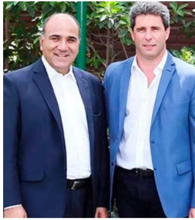
Juan Manzur, gobernador de Tucumán, y Sergio Uñac, gobernador de San Juan. En ambas provincias, la oposición plantea que no pueden presentarse a competir.