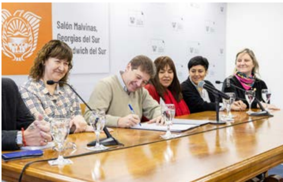
El Gobernador de Tierra del Fuego AIAS, Gustavo Melella, firmó el decreto de reglamentación del Régimen de Jubilaciones y Pensiones para el personal de los tres poderes del Estado Provincial Ley 561 y reformas.

va a repercutir en nuestros jubilados y pensionados. Es importante de destacar, porque después de varios años nuestros jubilados están viendo las movilizaciones que les corresponde”, recalzó.