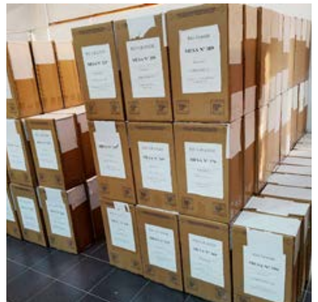
MOVIMIENTO POPULAR FUEGUINO (1 BANCA)