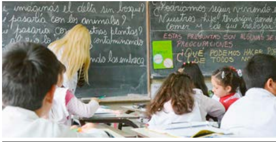
La semana pasada se llevó adelante una nueva Mesa Técnica de Convenio Colectivo de Trabajo.

Para concluir, el informe menciona que se solicitó reunión en carácter urgente con el subsecretario de salud, esto surge a raíz de las demandas y quejas del sector docente ante el requerimiento de turnos para terminar el psicofísico, observación de certificados médicos, entre otros temas.