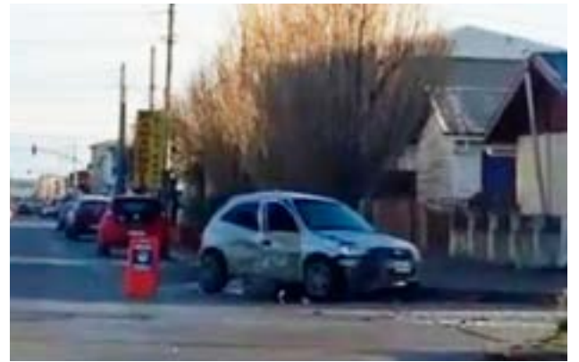
Ocurrieron tres violentos accidentes de tránsito en Río Grande.

Personal de Tránsito, corroboró que los conductores poseían la documentación habilitante y se les realizó el test de alcoholemia arrojando resultados negativos (0.00 g/l). Las partes fueron asesoradas de los trámites a seguir.