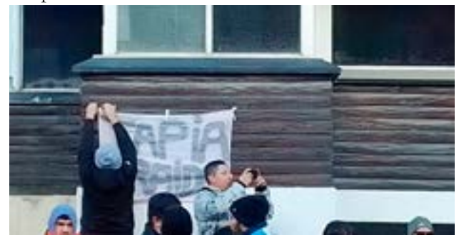
Durante la jornada del sábado, una movilización de la cual participaron diferentes sectores de la sociedad se desarrolló en Ushuaia

Los debates en las asambleas concluyeron en un pedido generalizado para que la UOM a nivel nacional intervenga, reclamo que aparentemente hizo modificar la posición de los representantes gremiales locales, quienes ahora se encuentran al frente del conflicto, empujados por las bases.