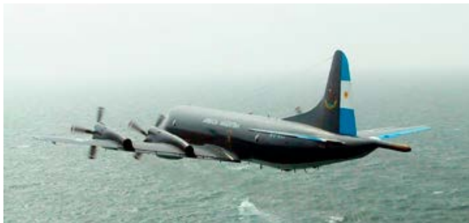
Brindan detalles de la compra de aviones que Argentina cerró con Noruega sobre aeronaves de gran porte P-3 Orion.

la pesca ilegal que avanza de manera indiscriminada.