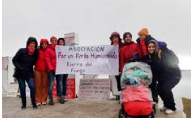
Desde la provincia se participó activamente de la Convocatoria de la Primera Marcha Nacional contra la Violencia Obstétrica.

personas gestantes, por nacer y recién nacidas dentro y fuera del sistema de salud".