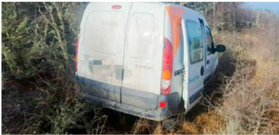
Un utilitario de Gobierno despistó sobre la ruta nacional 3 en el kilómetro 2939.