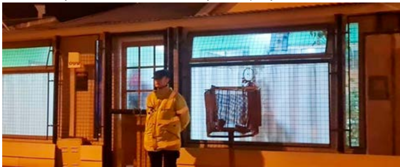
Siguen los allanamientos por las amenazas de bombas en escuelas. Esta vez secuestraron el celular de un chico de 17 años.

ubicada en calle Caleta La Misión al 600, con el objeto de proceder al secuestro de un celular y requisar personal de sus ocupantes. Finalmente, la medida arrojó resultado positivo procediéndose al decomiso del dispositivo celular de interés, propiedad de un menor de 17 años, asimismo se procedió a la fehaciente identificación de las personas mayores presentes en el domicilio.