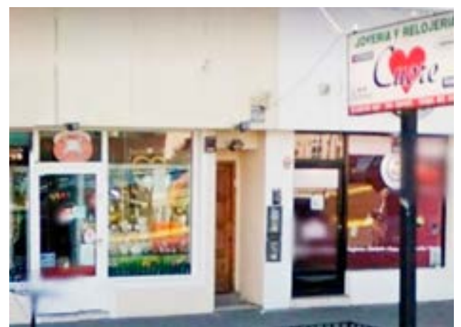
Sujeto fue detenido por daños a la vidriera de una joyería.

cuestro de un arma de fuego marca Bersa calibre .22 en condiciones de disparo, restos de marihuana y cocaína, interviniendo también la División Narcocriminalidad y Delitos Federales Río Grande. Finalmente, se procedió a la notificación de derechos y garantías del ocupante mayor de edad.