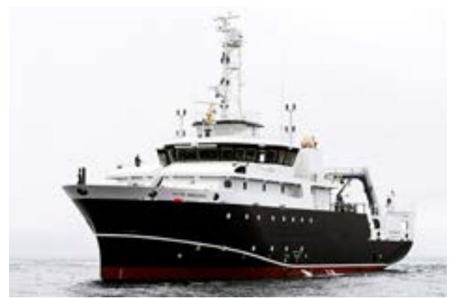
El Buque de Investigación Pesquera Oceanográfica (BIPO) Víctor del INIDEP.

A lo largo de 18 días los investigadores estimarán índices de abundancia de merluza, densidad (en peso y número), porcentaje de juveniles, distribución de longitudes de merluza; y las variables reproductivas: fecundidad parcial y relativa, frecuencia de puesta y producción potencial de huevos, realizando también la fecundación artificial de huevos de merluza a los fines de hacerlos eclosionar y criar larvas en condiciones experimentales. El área de investigación se extenderá desde los 35° S hasta los 39° S, entre las isobatas de 50 m y 300 m. Se trabajará sobre un diseño de muestreo sistemático por transecta, donde se planificaron 15 transectas con un total de 53 lances de pesca y 29 estaciones de CTD-roseta y multired.