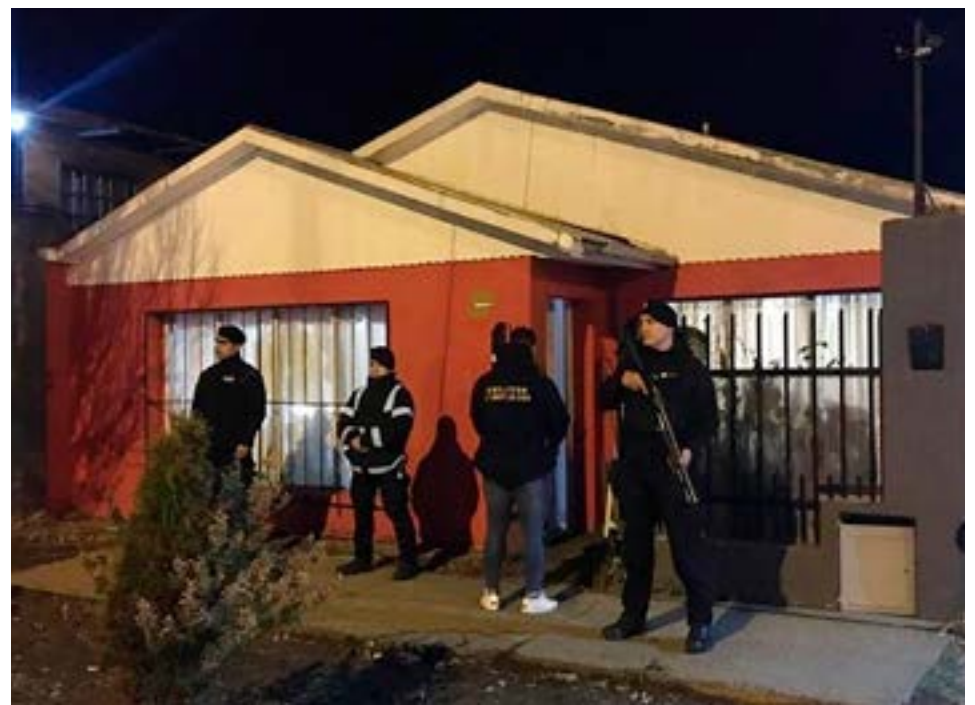
Allanaron un domicilio y encontraron un arma de fuego calibre.22, marihuana y cocaína.

Una persona denunció disparos sobre su domicilio