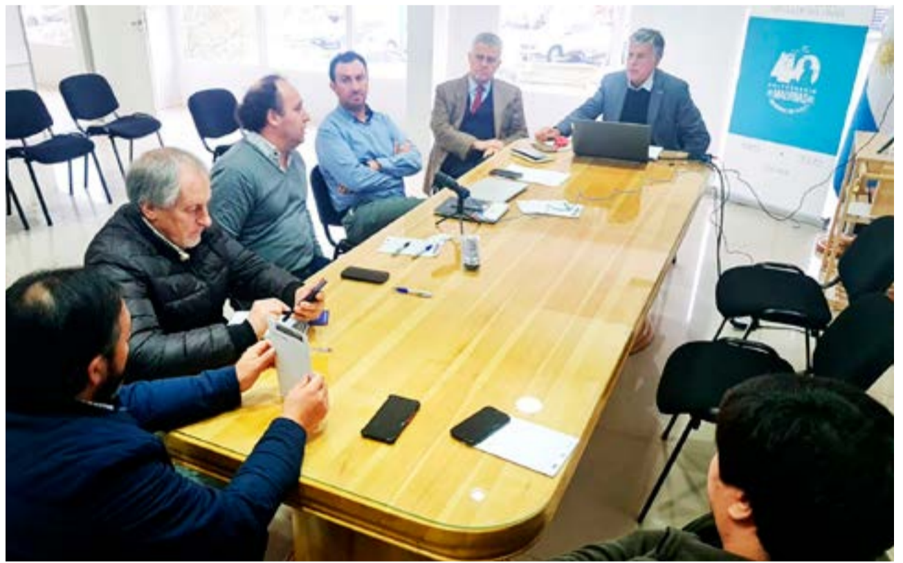
Este martes al mediodía se realizó una importante reunión en la Cámara de Comercio, Industria y Producción de Río Grande (CCIP) para abordar la problemática del giro de divisas para servicios de la barcaza.

hecho que estos plazos se alarguen y en los últimos 20 días no hemos podido recibir ningún pago”, reveló. Agregó sobre este punto que “nuestra preocupación radica en que por nuestra parte tenemos la responsabilidad también de mantener nuestra operación, de asumir nuestros costos, cancelarlos, y dicho eso le pedimos a la Cámara de Comercio acá que nos pudiera apoyar y reunirnos para contarles esto y buscar en forma paralela caminos que nos permitan mantener a todas las partes nuestras responsabilidades, compromisos y operación que es lo más importante para la provincia de Tierra del Fuego”.