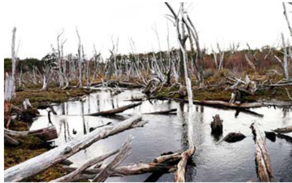
Un bosque nativo afectado por castores, el 14 de mayo 2023, en Puerto Williams (Chile).

do por la Universidad de Chile, pero la degradación del castor no solo frena esa absorción, sino que convierte los árboles muertos en una bomba de gases de efecto invernadero. Al cubrir con agua zonas boscosas, los árboles que siguen en pie mueren ahogados, caen y se pudren, un