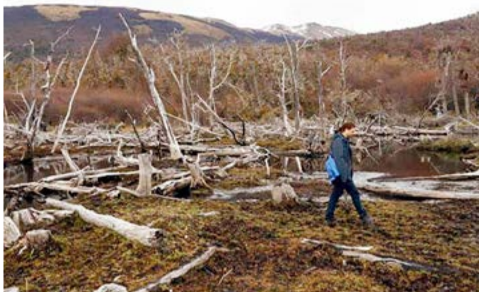
Fotografía de árboles de un bosque nativo afectado por castores, el 14 de mayo 2023, en Puerto Williams (Chile).

Magallanes alberga otro ecosistema con gran capacidad de capturar carbono y mitigar el cambio climático: las turberas, un tipo de humedal en el que se amontonan desde hace milenios varios metros de material orgánico sin descomponerse.