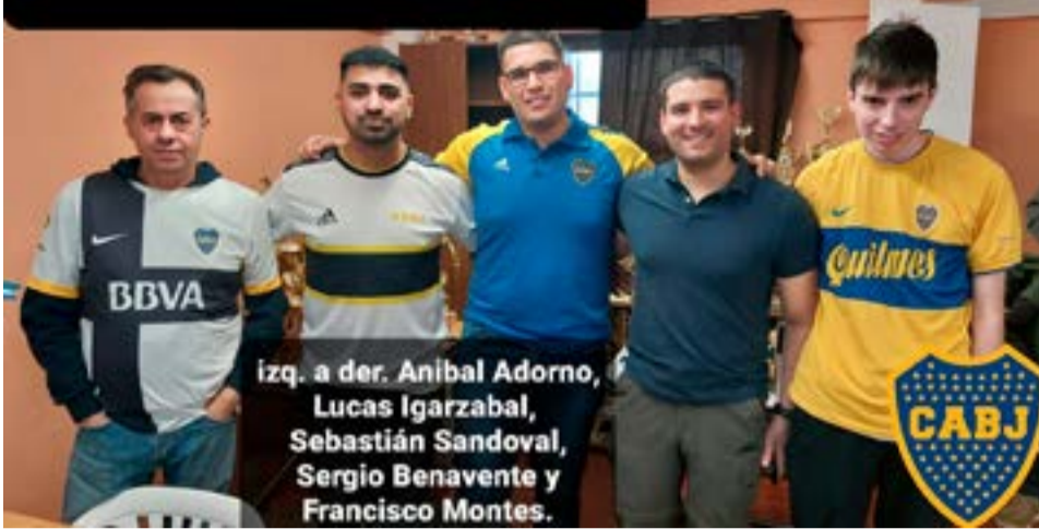
El Club Atlético Boca Juniors, subcampeón del evento.