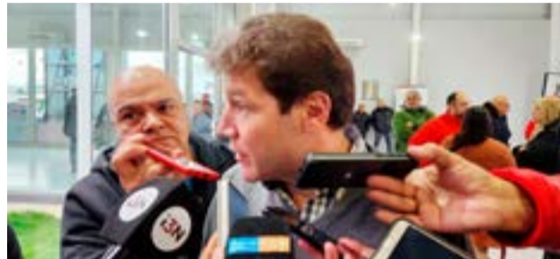
En rueda de prensa el gobernador Gustavo Melella habló sobre la situación de las fábricas de la provincia y sobre la incorporación de las textiles a la 19640.

El gobernador Gustavo Melella recordó que “nosotros hemos hablado con los industriales y lo he hablado con el gremio y lo he dicho el 1 de marzo: tenemos que trabajar