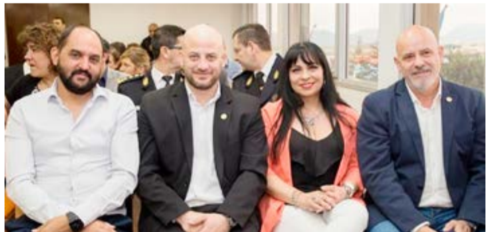
Desde el bloque de FORJA en la Legislatura se pronunciaron respecto de los despidos y las caídas de contratos en Brightstar, Solnik y Newsan.

Finalmente se expresa en el texto que “Desde nuestro espacio político repudiamos los despidos arbitrarios y discriminatorios realizados por la patronal y los exhortamos al reconocimiento de los derechos de los trabajadores metalúrgicos en su justo reclamo”.