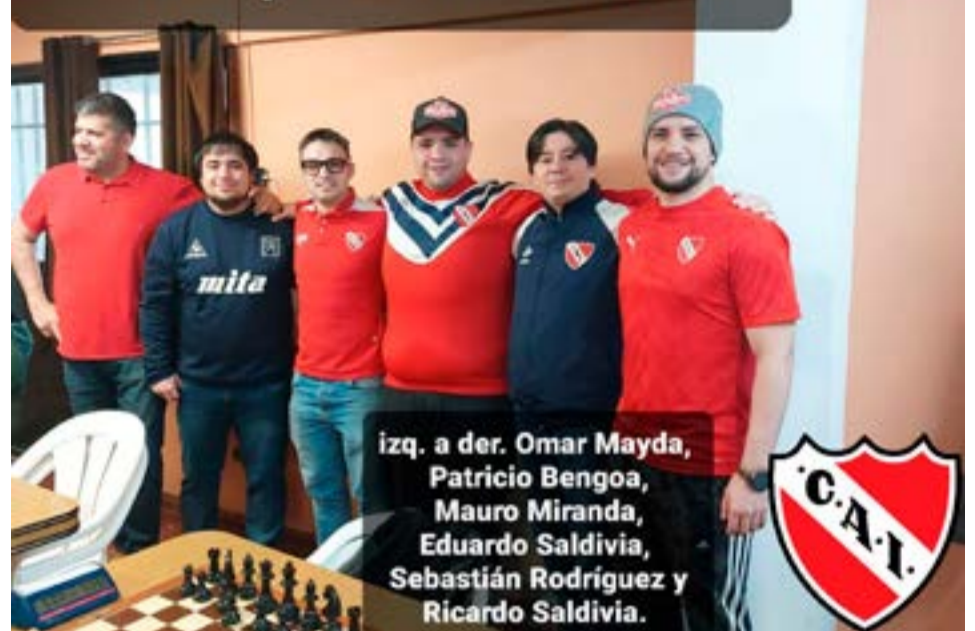
El club Atlético Independiente obtuvo la cuarta posición de la competencia.