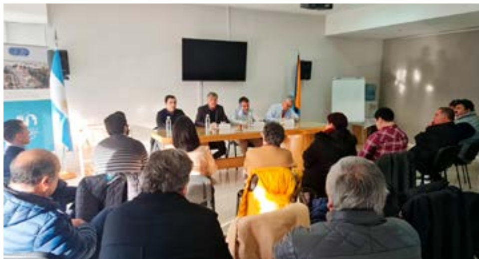
Este jueves al mediodía se llevó a cabo un encuentro binacional entre Porvenir y Río Grande en la Cámara de Comercio local (CCIP) donde se analizó el desarrollo de la zona norte de Tierra del Fuego en temas económicos, sociales, culturales y deportivos, con la intención de potenciar el comercio y el turismo conjuntamente, además de temas ambientales y energía renovable.

El Jefe comunal de Porvenir destacó que “tenemos muchas cosas que nos unen, más que nos separen, pero sobre todo el hecho de que hay muchos chilenos, descendientes de chilenos, sobre todo de gente que vino de Chiloé como migrantes a Porvenir, después se unieron a Río Grande y que han construido tanto este lado argentino como el lado chileno. Y en ese sentido nosotros nos debemos a la me-