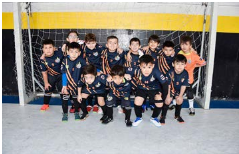
El equipo de ADEFU, 9na división.

horas Residentes Jujeños 7 Victoria 1 Partido 12 – 7ma división – inicio: 21.00 horas Italiano 23 Escuela Argentina Celeste 0 Gimnasio Margen Sur Partido 1- 5ta división – inicio: 12.00 horas 9 de Octubre 4 La Bianca 2 Partido 2 – 6ta división – inicio: 13.10 horas Independiente 3 9 de Octubre 3 Partido 3 – 3ra división – inicio: 14.20 horas Defensores del Sur 1 9 de Octubre 0 Partido 4 -3ra división femenina – inicio: 15.30 horas Escuela Argentina 12 Los Troncos 0 Partido 5 – 3ra división femenina – inicio: 16.40 horas Celeste FC 8 San isidro 2 Partido 6 – 3ra división – inicio: 17.50 horas Los Troncos 3 Metalúrgico 1 Partido 7 – 3ra división – inicio: 19.00 horas INTER RG 5 Residentes Jujeños 11 Partido 8 – 4ta división – inicio: 20.10 horas Nueva Roma 0 Metalúrgico 8 Domingo 28 Gimnasio Margen Sur Partido 1 – 5ta división – inicio: 10.00 horas Estrella Austral 5 Camioneros 0 Partido 2 – 4ta división – inicio: 11.10 horas Independiente 8 Estrella Austral Roja 2 Partido 3 – 4ta división – inicio: 12.20 horas San Isidro 0 ADEFU 12 Partido 4 – 4ta división – inicio: 13.30 horas Estrella Austral 2 Camioneros 0 Partido 5 – 3ra división – inicio: 16.00 horas Barcelona 1 Defensores del Sur 5 Partido 6 – 4ta división – inicio: 17.10 horas Escuela Argentina 2 Los Troncos 0 Partido 7 – 5ta división – inicio: 18.20 horas Progreso/Petroleros 5 Italiano 3