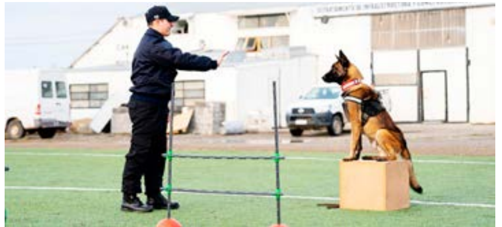
Realizaron ejercicios con canes adiestrados

Federal y de Defensa Civil Municipal”. “Este curso es muy importante para nosotros porque somos pioneros en crear