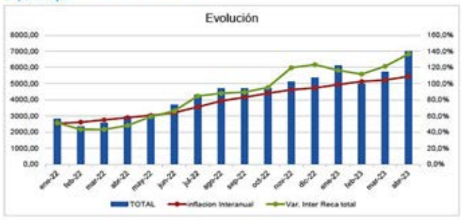
Gráfico N° 1. Serie Recaudación Evolución crecimiento nominal vs inflación. En porcentajes

Las industrias que acreditan origen bajo el subrégimen de promoción industrial fue uno de los principales sectores que aportaron a la recaudación fiscal, con casi $1.508,2 millones, un 259,4% mayor al año pasado.