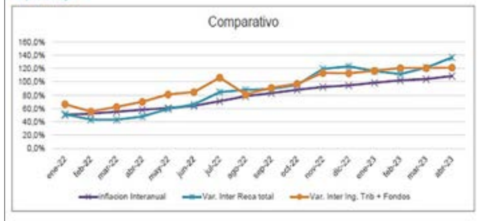
Gráfico N° 2. Serie Recaudación Comparativo crecimiento nominal vs inflación. En porcentajes

Los datos oficiales publicados en la página Web del Gobierno de la provincia indican que la recaudación interanual en conceptos de impuestos, tasas industriales y otros ingresos, llegó al 136,7%, superando por 27,9% a la inflación registrada en el mismo periodo, que fue del 108,8%.