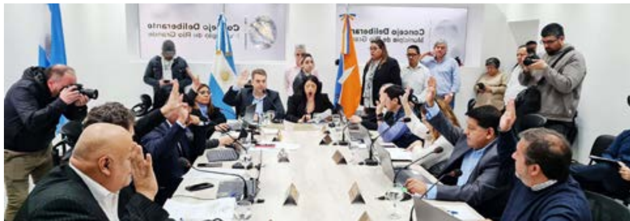
Los concejales llevaron adelante la IV Sesión Ordinaria en la cual pusieron a consideración una variada cantidad de proyectos impulsados desde los distintos Bloques que integran el Cuerpo de Concejales.

Todos los bomberos voluntarios que se acojan a este beneficio deberán tramitar una credencial personal, única e intransferible, la cual deberá contener nombre y apellido, Documento Nacional de Identidad, foto tipo carnet, fecha de vencimiento y el Cuartel de Bomberos al que pertenece. Dicha credencial será renovada anual-