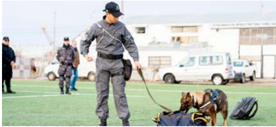
El Servicio Penitenciario llevó a cabo una demostración del Primer Curso Básico de Guía de Canes.

presencia de varias instituciones de otras provincias, entre ellas los servicios penitenciarios de Tucumán, de San Juan y de Santa Cruz. También participan funcionarios de la Policía Provincial, de Policía