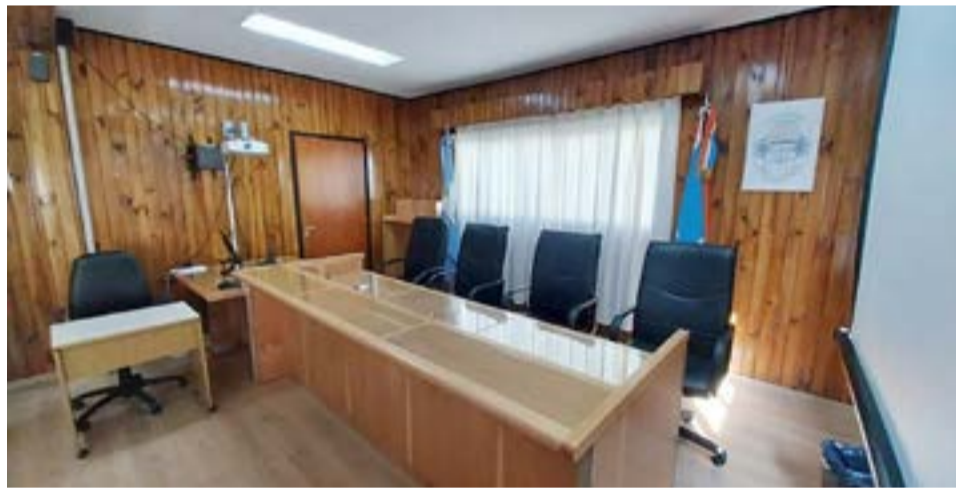
Juzgan a sujeto que abusó de en reiteradas ocasiones de una adolescente entre el 2019 y el 2021.

Otro juicio por abuso sexual en Río Grande