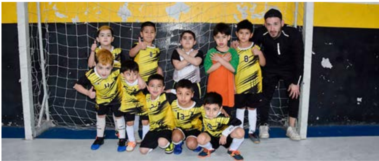
El equipo de San Isidro, 9na división.

Partido 4 – 5ta división – inicio: 13.00 horas