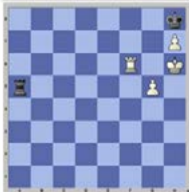
Problema 024 Horwitz 1881 Juegan negras y hacen tablas