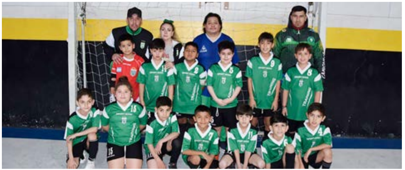
El equipo de Camioneros, 8va división.

9 de Octubre 6 San Francisco 4 Partido 5 – 5ta división – inicio: 14.10 horas Residentes Jujeños vs. 9 de Octubre Partido 6 – 7ma división – inicio: 15.20 horas Residentes Jujeños 4 9 de Octubre 2 Partido 7 – 3ra división – inicio: 16.20 horas Defensores del Sur 3 9 de Octubre 2 Partido 8 – 9na división – inicio: 17.30 horas Defensores del Sur 0 9 de Octubre 10 Partido 9 – 8va división – inicio: 18.30 horas 9 de Octubre 0 Italiano 16 Partido 10 – 6ta división – inicio: 19.30 horas 9 de Octubre 5 La Blanca 6 Partido 11 – 5ta división – inicio: 20.30 horas Progreso/Petroleros 3 9 de Octubre 6 Domingo 11 Gimnasio club San Martín Partido 1 – 4ta división – inicio: 15.50 horas Los Troncos 6 Nueva Roma 0 Partido 2 – 4ta división – inicio: 17.00 horas Progreso/Petroleros 4 San Francisco 3 Partido 3 – 4ta división – inicio: 18.10 horas Escuela Argentina 3 Independiente 4 Partido 4 – 3ra división – inicio: 19.20 horas Metalúrgico 7 ADEFU 4 Partido 5 – 3ra división – inicio: 20.30 horas Los Troncos vs. Nueva Roma Partido 6 – 3ra división – inicio: 21.40 horas Estrella Austral vs. Camioneros Sanciones Tribunal de Disciplina - junio 2023 Nombre y Apellido DNI Club Cat. F e - cha Partido Tarjetas Rol Sanción Art. GARCIA MATIAS 37.173.968 ADEFU 1° DIV 9-Jun R DT 2 fechas 186 CUESTA GONZALO 40.000.887 CAMIONE-