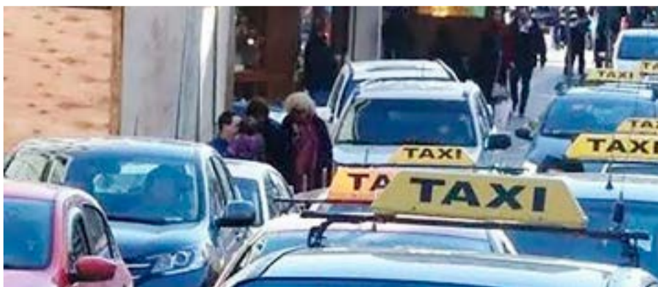
En el edificio municipal de calle Arturo Coronado se realizó la asamblea tarifaria en la que se evaluó el pedido de aumento de la tarifa del servicio de taxis, con participación de integrantes de la Asociación de Propietarios, de la Cooperativa, y de funcionarios municipales.

“Las Islas Malvinas, Georgias y Sandwich del Sur son y serán argentinas”