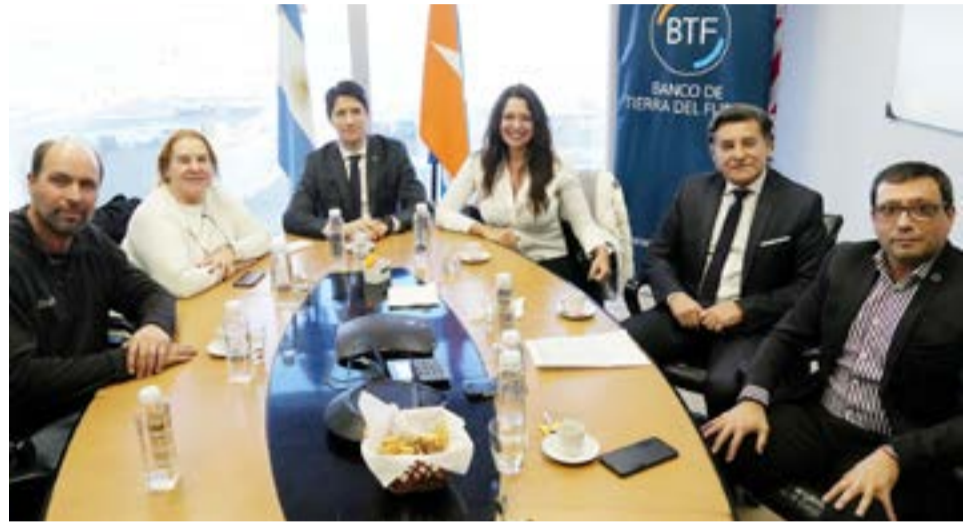
Representantes de las Cámaras de Comercio de las tres ciudades de la Provincia se reunieron con autoridades del Banco de Tierra del Fuego.

Para recibir más información y solicitar estas líneas de asistencia, los interesados deben acercarse a cualquiera de los locales de atención exclusiva de Banca Empresa: J.M. de Rosas n° 37, en Ushuaia; 9 de julio n° 767, en Río Grande; o a la sucursal de Tolhuin, Minkiol 331.