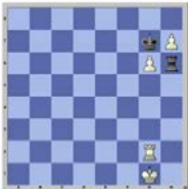
Problema 023 Cheron 1949 Juegan negras y hacen tablas