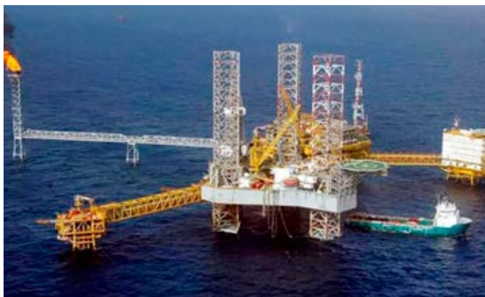
Entrevistado por Mejor Energía, el mandatario provincial Gustavo Melella, valoró que “Fénix es un paso clave para la industrialización de los hidrocarburos fueguinos”.

El gas producido será transportado a través de un nuevo gasoducto de 35 km hasta la plataforma Vega Pléyade, perteneciente al consorcio CMA-1, y procesa-