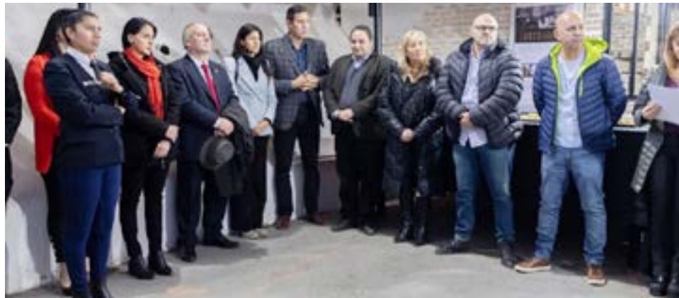
El “Centro Alas de Libertad” será el Primer Centro de Formación Profesional para personas en contexto de encierro del país.