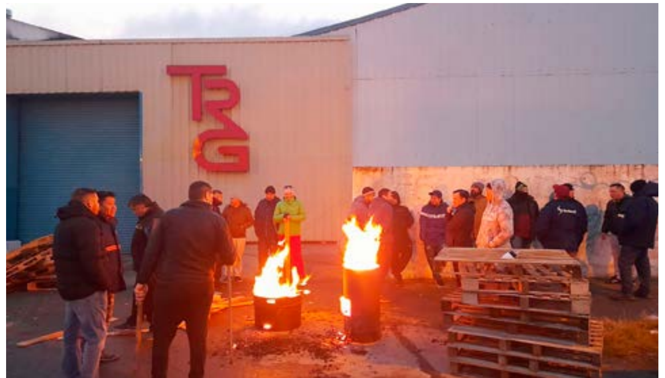
Trabajadores de la empresa Textil Río Grande, se manifestaron el pasado viernes en el exterior de la planta por el despido de un trabajador.

que “La nota también fue enviada al área de Recursos Humanos de la empresa, en su sede de Buenos Aires. El miércoles veremos si hacemos una presentación en