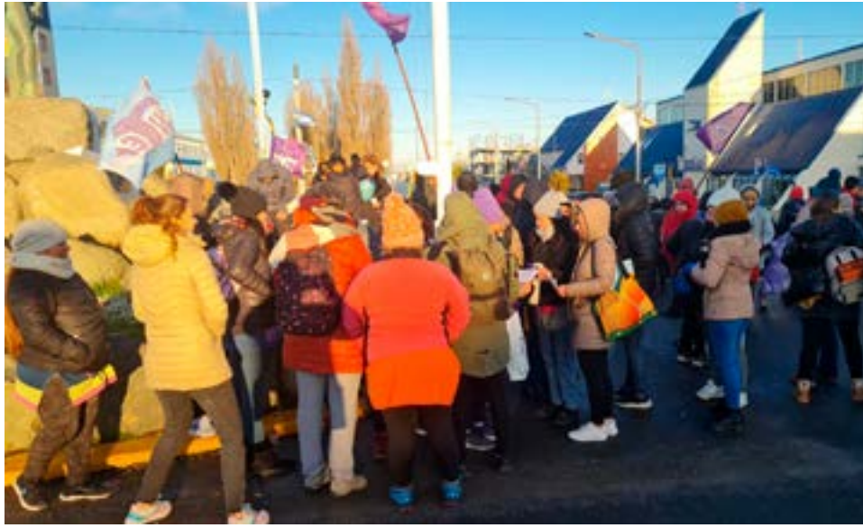
Desde el sindicato docente adelantaron un marcado rechazo a la última propuesta salarial, que recibieron por parte del gobierno.

Vale mencionar que se desarrolló un nuevo Congreso Provincial de Delegadas y Delegados donde se informó sobre la negociación salarial y se realizó un intercambio respecto a las situaciones de las instituciones educativas. Allí, por amplia mayoría se resolvió: para el miércoles 21/06: asambleas en todas las instituciones educativas de la provincia, con tachos en las puertas de las instituciones que deseen implementarlo. Para el jueves 22/06: asambleas en todas las instituciones educativas a mitad de jornada. Finalmente, para el día viernes 23/06: desobligaciones con movilización en toda la provincia.