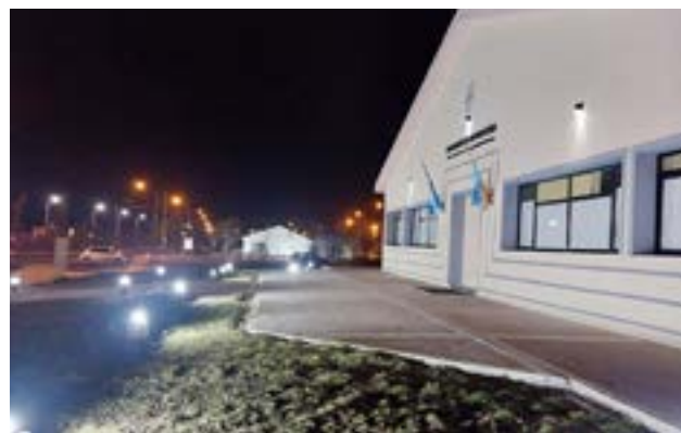
Nueva luminaria en dependencias judiciales de Río Grande.

Además, complementa las tareas realizadas durante el primer semestre del año, oportunidad en la que se