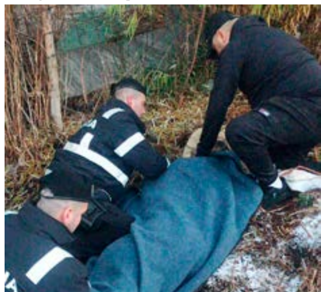
Un hombre de 73 años fue rescatado de un estado de hipotermia.

El mismo se encontraba consciente, en estado de hipotermia. Fue trasladado urgente en ambulancia al Hospital Regional Ushuaia para una mejor atención.