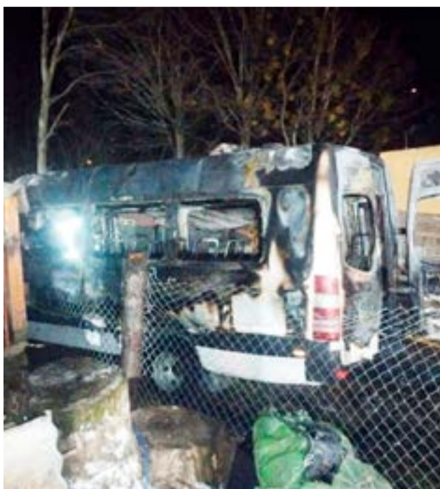
Se incendió por completo una combi estacionada.

Las pericias realizadas por personal de la División Policía Científica Ushuaia, determinaron luego que el ígneo fue hipotético accidental.