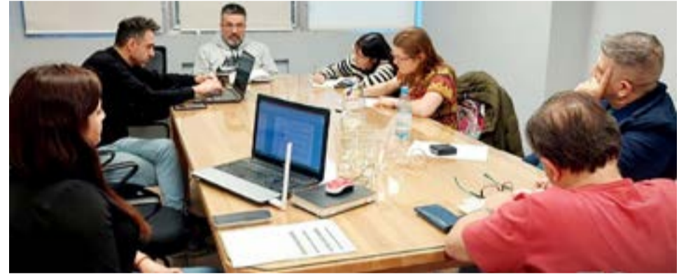
Este viernes 23 de junio, se desarrolló una nueva mesa paritaria salarial, en el marco de la Ley Provincial Nro. 424.

Viernes 30/06: desobligaciones con movilización en toda la provincia.