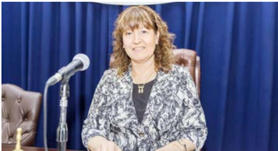
La vicegobernadora de Tierra del Fuego, Mónica Urquiza, participará en el marco de la celebración del 27° aniversario del Tratado de la Patagonia.