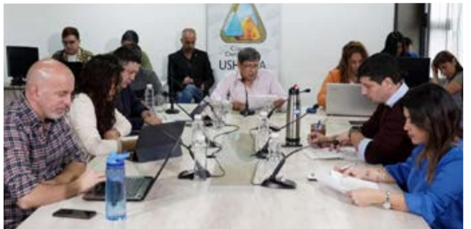
"Las Islas Malvinas, Georgias y Sandwich del Sur son y serán argentinas"

De esta manera, el Concejo Deliberante se prepara para sesionar por cuarta vez dentro del XL período legislativo. La sesión se desarrollará el miércoles 28 de junio, desde las 11 horas, en el edificio de Gobernador Paz y Piedra Buena. La invitación es para interesados y comunidad en general, y se transmitirá por la red social Facebook de la Institución.