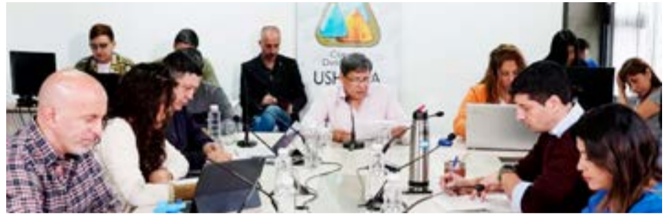
El pasado viernes tuvo lugar el cierre de boletín de asuntos entrados, a partir del cual los concejales definirán el orden del día de la cuarta sesión ordinaria. La conformación de la agenda de temas que recibirán tratamiento legislativo, se dará en el ámbito de la comisión de Labor Parlamentaria, programada para este lunes desde las 11 horas.

De esta manera, el Concejo Deliberante se prepara para sesionar por cuarta vez dentro del XL período legislativo. La sesión se desarrollará el miércoles 28 de junio, desde las 11 horas, en el edificio de Gobernador Paz y Piedrabuena. La invitación es para interesados y comunidad en general, y se transmitirá por la red social Facebook de la Institución.