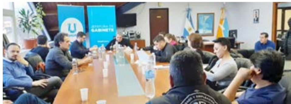
Trabajadoras y trabajadores municipales de la ciudad de Ushuaia, definen en asambleas si aceptan la última propuesta salarial recibida de parte del Ejecutivo.

“En la reunión efectuada en el día de hoy, el departamento ejecutivo realizó la siguiente oferta de recomposición salarial: 5% de incremento en el mes de julio, 5% en agosto y 4% en septiembre”.