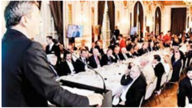
La definición contrarreloj de Unión por la Patria, de bajar a última hora a Daniel Scioli y a Eduardo "Wado" de Pedro, y encolumnarse detrás de la candidatura de Sergio Massa, fue vista con buenos ojos por el empresariado.

Buenos Aires.- La definición contrarreloj de Unión por la Patria, de bajar a última hora a Daniel Scioli y a Eduardo "Wado" de Pedro, y encolumnarse detrás de la candidatura de Sergio Massa, fue vista con buenos ojos por el empresariado, tanto por grandes cámaras como por pymes, según pudo averiguar Ámbito . Así, el sector privado ve un oficialismo más competitivo, aunque mantiene el temor por Javier Milei, y hay incertidumbre sobre quién puede ganar las primarias de Juntos por el Cambio, entre Horacio Rodríguez Larreta y Patricia Bullrich.