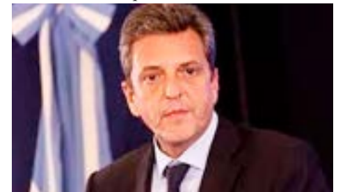
El ministro de Economía, Sergio Massa, seguirá en su cargo mientras se desarrolla la campaña que lo tiene como pre candidato a presidente.

En el Palacio de Hacienda se mueven rápido para mostrar gestión: "Ese será el eje de nuestra campaña", explicó un intendente del conurbano que orbita en el Frente Renovador. Se cocinan anuncios. La idea es recrear las expectativas que se habían generado con la llegada de Massa al ministerio y que en el Gobierno consideran que se vieron trastocadas por los efectos de la sequía.