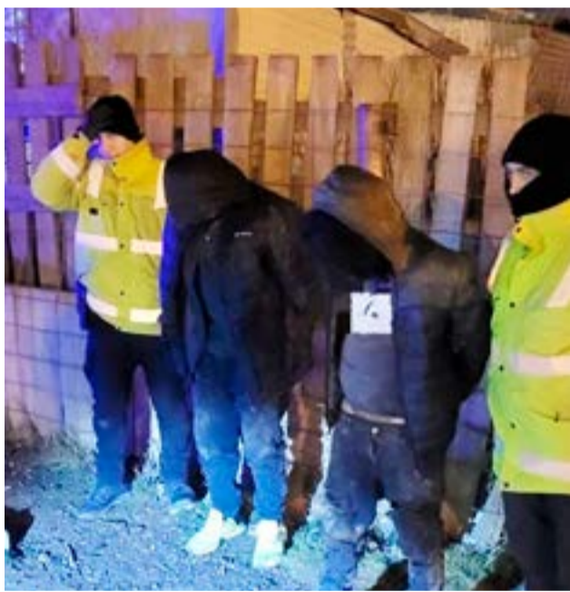
Dos hermanos fueron aprehendidos por agredir a otro sujeto en un kiosco de margen sur.

Asimismo, en torno a la presente causa se notificó de Derechos y Garantías al joven, quien se encuentra sindicado en el presente evento.