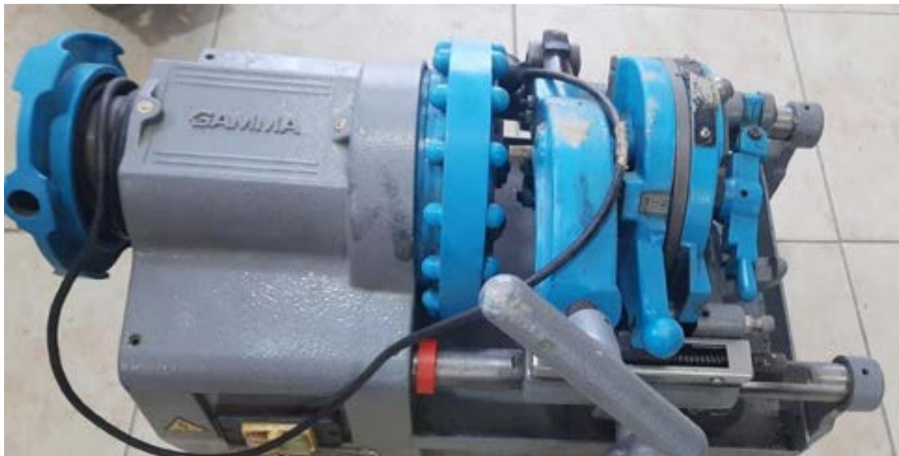
Allanamiento permitió recuperar máquinas y herramientas sustraídas en un obrador.

Finalmente, ambos masculinos fueron notificados de derechos y garantías procesales y fehaciente identificación.