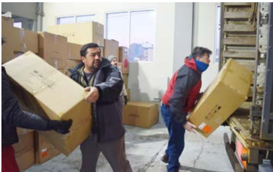
El Poder Judicial donó más de 400 cajas de papel triturado a la Fundación Garrahan.

desde el Programa de Reciclado y Medio Ambiente de la Fundación se aplican en la compra y reparación de equipamiento de alta complejidad; la adquisición de