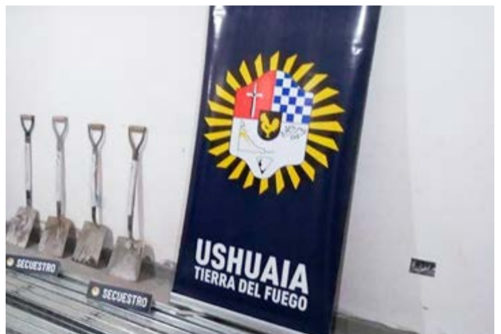
Vehículo Chevrolet en el cual se movilizaba la persona imputada del robo.

pero no se encontraron elementos de interés. El vehículo fue confiscado por falta de documentación por parte del tránsito municipal mientras circulaba por la calle