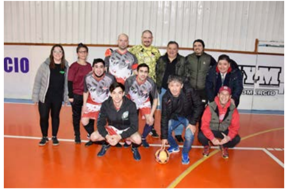
El equipo de FIRE Control, categoría libre.