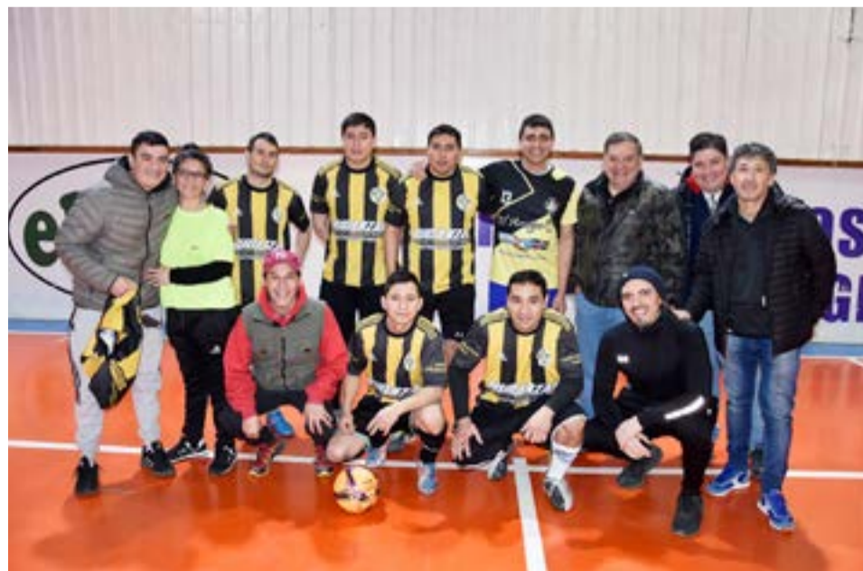
El equipo de Los Del Duende, categoría libre.

ya que todo está saliendo de acuerdo a lo planificado, y los más importante para nosotros es que gracias a dios no tenemos a ningún jugador lesionado, y ese detalle es fundamental para nosotros porque los compañeros de trabajo entienden que en este evento; los jugadores vienen a divertirse y a pasarla muy bien entre todos y junto a sus familiares, que también es muy importante para el centro de empleados de comercio de que todos podamos disfrutar de estos lindos momentos