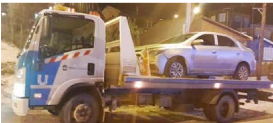
Allanamiento, requisa personal y registro vehicular por robo de materiales de construcción en una vivienda de la ciudad de Ushuaia.