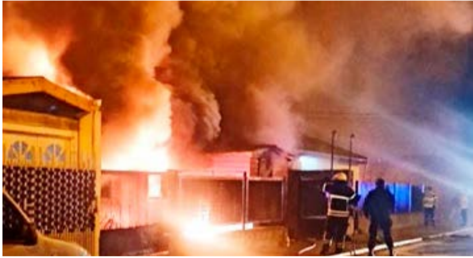
Ardió una vivienda en Ángela Vallese al 770. Hay una persona en terapia intensiva con quemaduras graves y hay un detenido.