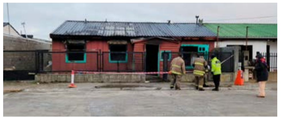
En el domicilio funcionaba una suerte de inquilinato, y en la cocina, se habría dado una discusión entre dos personas que alquilaban piezas.