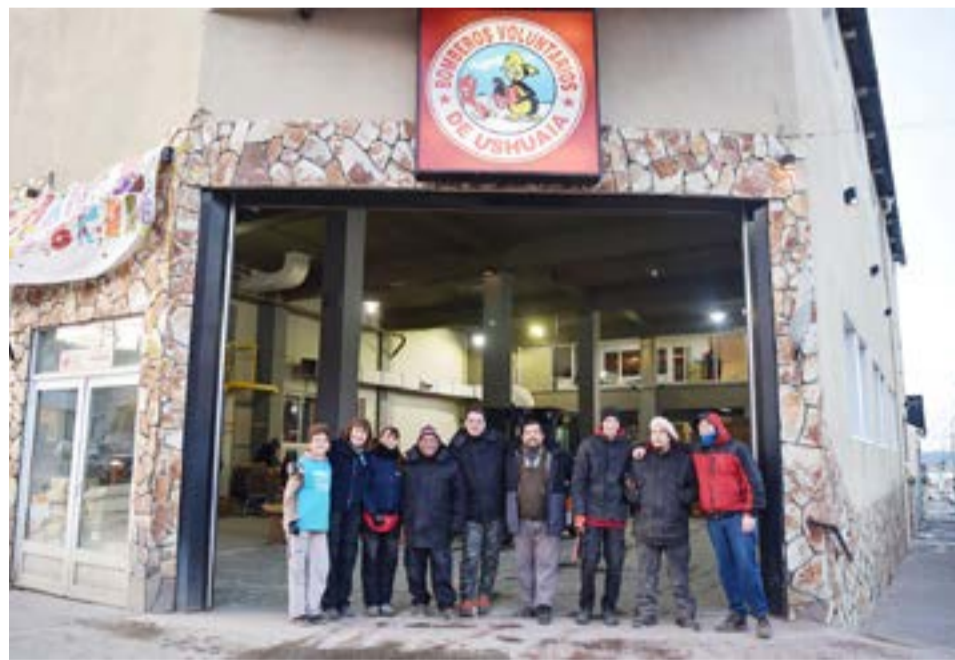
El Poder Judicial donó más de 400 cajas de papel triturado a la Fundación Garrahan.

tardan entre 15 y 20 años en crecer. Además, al reciclar papel se ahorra un 70% de agua, un 45% de energía y se reduce la contaminación.