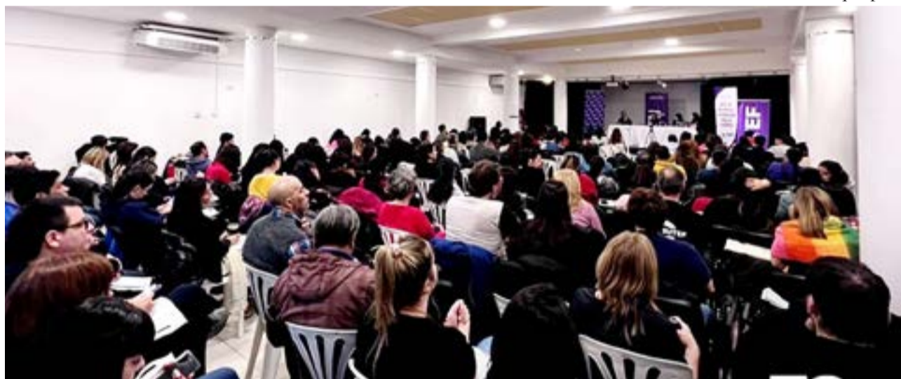
Durante los días jueves 22 y viernes 23 de la semana pasada se desarrolló, en las instalaciones del IPES "Florentino Ameghino" en la ciudad de Ushuaia, el Primer Foro sobre Educación Pública de Tierra del Fuego AeIAS "Diálogos acerca de los nuevos desafíos de la enseñanza en la Educación Secundaria".

"Ahí comenzamos a planificar este trayecto que se concretó en el año 2011. Dictamos con otros colegas