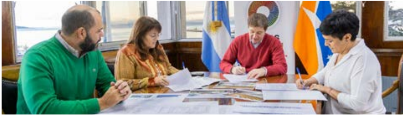
Estarán ubicadas en Río Grande, Tolhuin y Ushuaia; y prevén la formación de perfiles laborales vinculados a la matriz productiva de cada ciudad.

“Esto genera una demanda de nuevos edificios, adaptados a esta modalidad y que puedan fomentar y contener