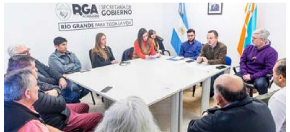
Taxistas, remiseros y el Municipio de Río Grande trabajan en la prohibición de transportes no habilitados.

Los referentes de taxis, remises y el Municipio de Río Grande manifestaron su acompañamiento al tratamiento y avan-