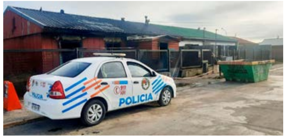
Peritos determinaron que el incendio fue intencional.

Finalizadas las tareas periciales por parte de Bomberos de Policía, se estableció el hecho como hipotético intencional.