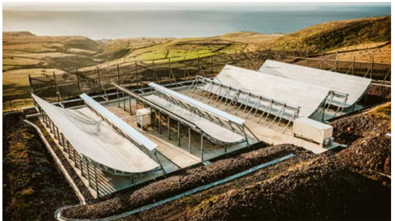
El senador nacional Pablo Daniel Blanco solicita que se informe: ¿Cuáles son las capacidades actuales y potenciales de los dispositivos a instalar en relación con el seguimiento de satélites y objetos de órbita baja y misiles tácticos o balísticos intercontinentales.

“La construcción implicaría una amenaza en general sobre la República Argentina y en particular sobre la zona donde se instalarían las antenas”, finalizó Blanco.