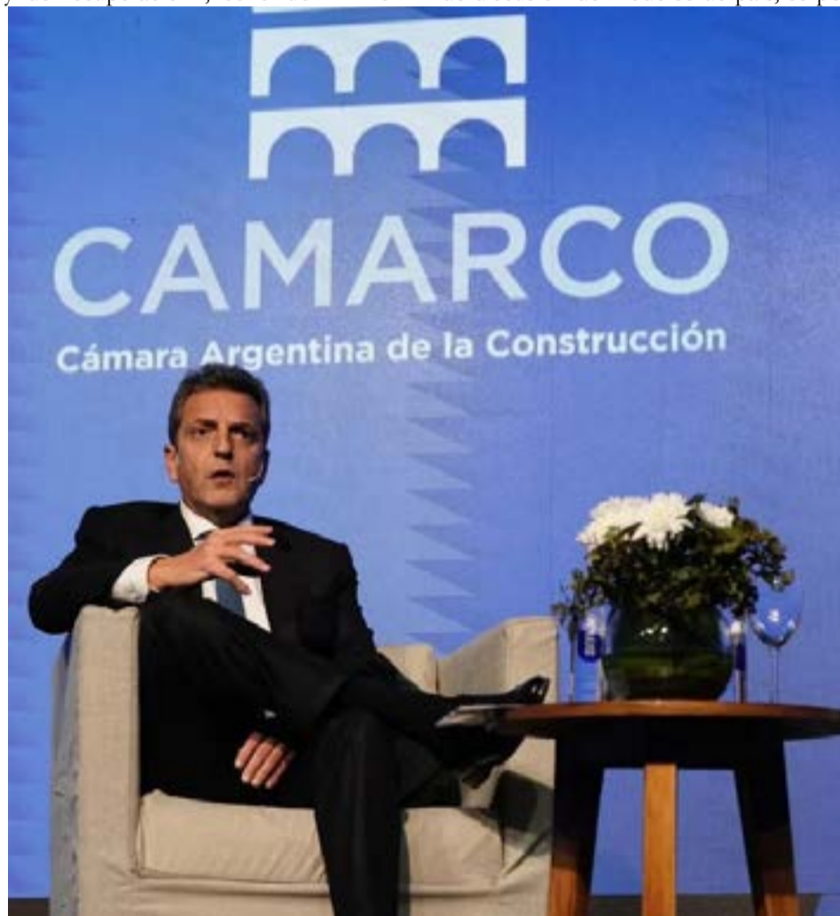
El ministro de Economía Sergio Massa estrenó su candidatura a presidente por el oficialismo ante empresarios este martes durante la Convención Anual de la Cámara Argentina de la Construcción (Camarco), ante quienes anticipó una resolución inminente de la negociación con el Fondo Monetario Internacional.

“Hubo una decisión de sintetizar una coalición de Gobierno, para demostrar que frente a la pelea y la división y la falta de discusión de modelos de país, se po-