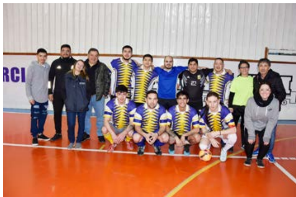
El equipo de La Scabioneta, categoría libre.

pos, y para este año pudimos organizar el evento con veintinueve equipos que se conformaron con jugadores de diversos comercios e industrias de nuestra ciudad, ya que hasta el pasado año, cada combinado que intervenía presentaba de forma exclusiva a su equipo representado a un comercio determinado, así es que debo decir que ahora se ha tornado más competitivo el certamen y sinceramente me agrada mucho que así sea, porque todos disfrutaron de muy buena