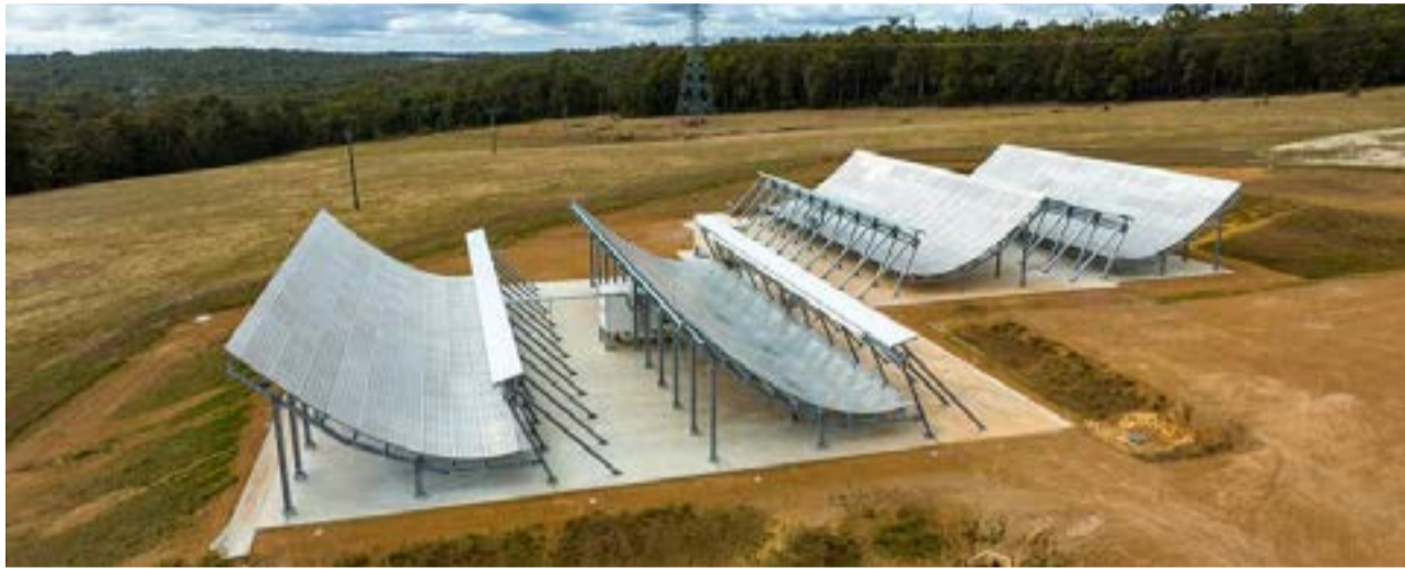
La polémica antena radar similar a la que se tenía planificado instalar en Tierra del Fuego.

La Estación Terrena en Banda S permitiría el rastreo y monitoreo de objetos en órbita baja, lo cual podría tener implicaciones en la seguridad nacional y en la capacidad del Estado para controlar y proteger