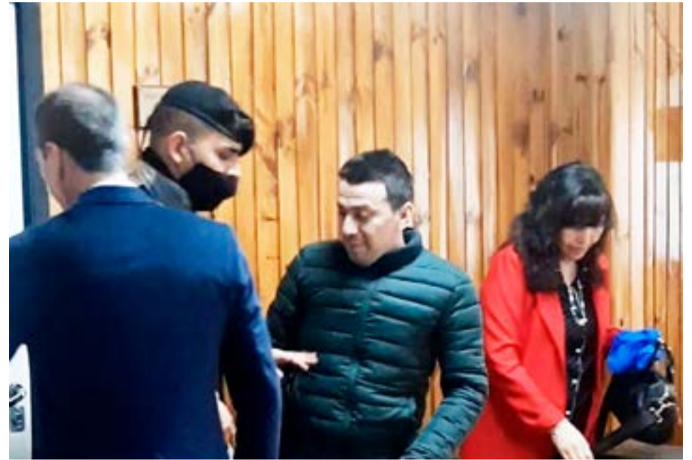
La víctima presenta secuelas

menor mediante las grabaciones realizadas en Cámara Gesell, cuyo objetivo fundamental radica en obtener el testimonio