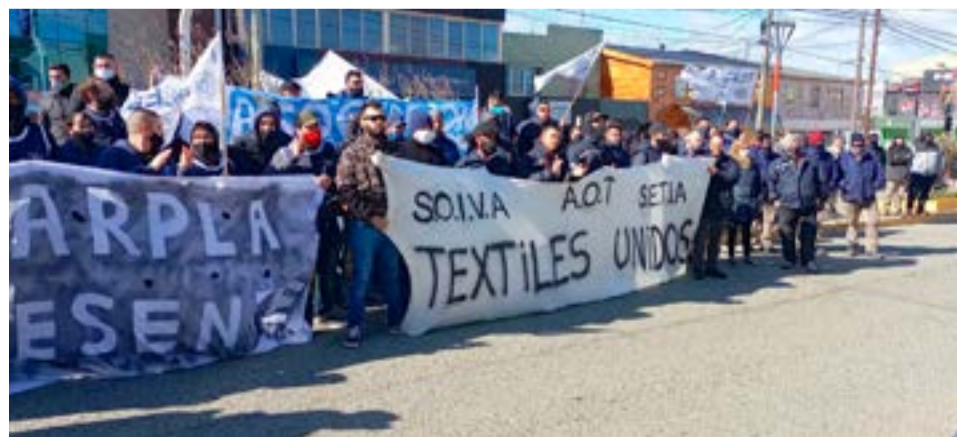
Representantes de los tres gremios del sector textil y del vestido se hicieron presentes en la reunión de la Comisión del Área Aduanera Especial.