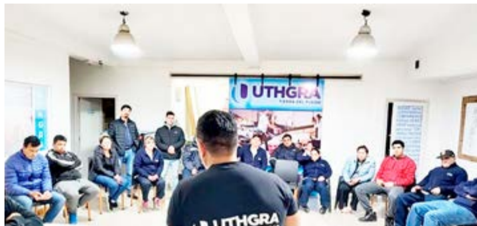
Según el propio titular del gremio gastronómico, se estableció que “no se va a tocar ningún puesto de trabajo y que los puestos de trabajo de la cocina siguen.

están todos acá. Festejar en el sentido de la tranquilidad porque realmente que un trabajador se quede sin su puesto de trabajo, significa que es una familia a la cual también le entra ese inconveniente de no