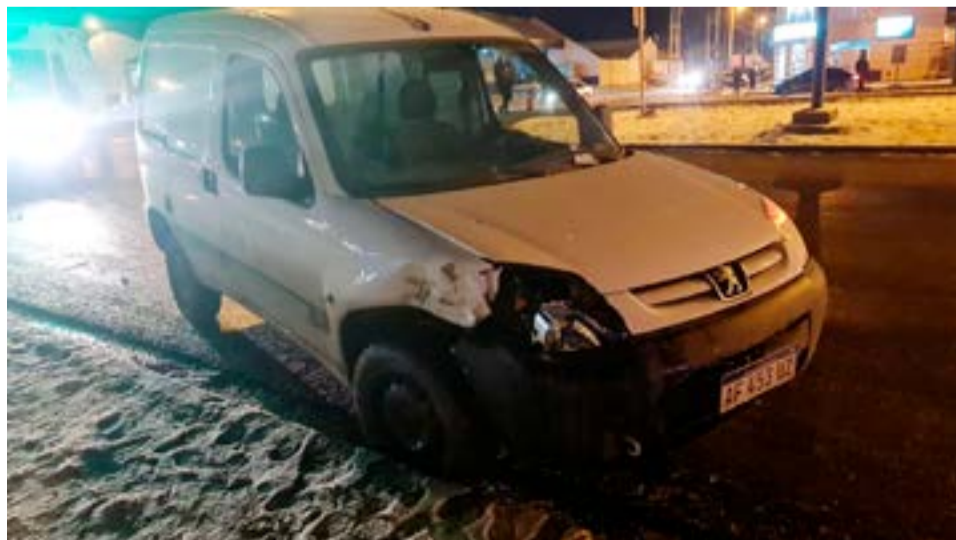
Violento choque sin heridos en Almafuerite y ruta nacional 3 de Río Grande.

De todos modos la ambulancia fue llamada por prevención, pero los facultativos comprobaron que no hubo lesionados y no fue necesario trasladar a ninguno de los ocupantes de ambos rodados.