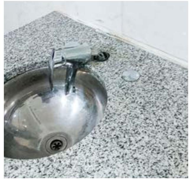
Se inició una investigación a partir de los hechos.

Asimismo el Secretario recordó que el edificio comparte sus espacios con otras instituciones, “con lo cual hasta tanto se realicen las reparaciones correspondientes; una vasta comunidad educativa se verá afectada por este hecho, tras quedar inhabilitado el sector de los sanitarios para su uso”.