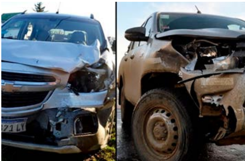
Tres heridos en violento accidente ocurrido en Libertad e Irigoyen.

Finalmente, el funcionario adelantó que desde el Ministerio se abrirá una investigación de manera de dar con los responsables de los daños provocados y el robo de la grifería.