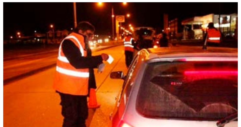
Tres efectivos policiales fueron demorados cuando circulaban en estado de ebriedad.

que, si bien se encontraban de franco, en el marco de este control de tránsito, se procedió al secuestro del rodado, test de alcoholemia al conductor, aplicación de la Ley 1024, por lo cual quedaron aprehendidos en carácter contravencional y se iniciaron las actuaciones para el sumario administrativo correspondiente.