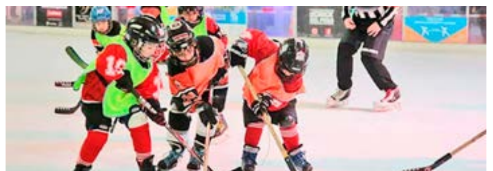
Las fotos captadas este lunes, corresponden a un partido promocional de la Sub 8 (izquierda) y al encuentro entre Templarios de Iquique y Warriors de Punta Arenas (derecha).

y también la Patagonia. Las fotos captadas este lunes, corresponden a un partido promocional de la Sub 8 (izquierda) y al encuentro entre Templarios de Iquique y Warriors de Punta Arenas (derecha).