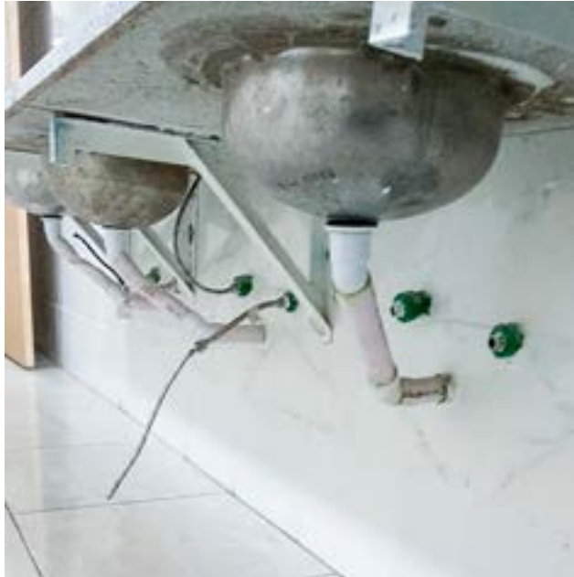
Robo de griferías y daños varios en el Colegio “Comandante Luis Piedrabuena”.

Río Grande.- En las últimas horas, personal del área de Infraestructura Escolar detectó importantes daños realizados en los sanitarios del Colegio Provincial “Coman-