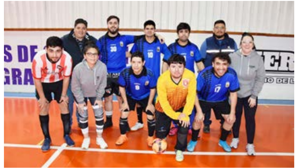
El equipo de Academia FC, categoría libre.

promovemos desde la organización, así es que debo felicitar a todos por el gran acompañamiento que hacen".