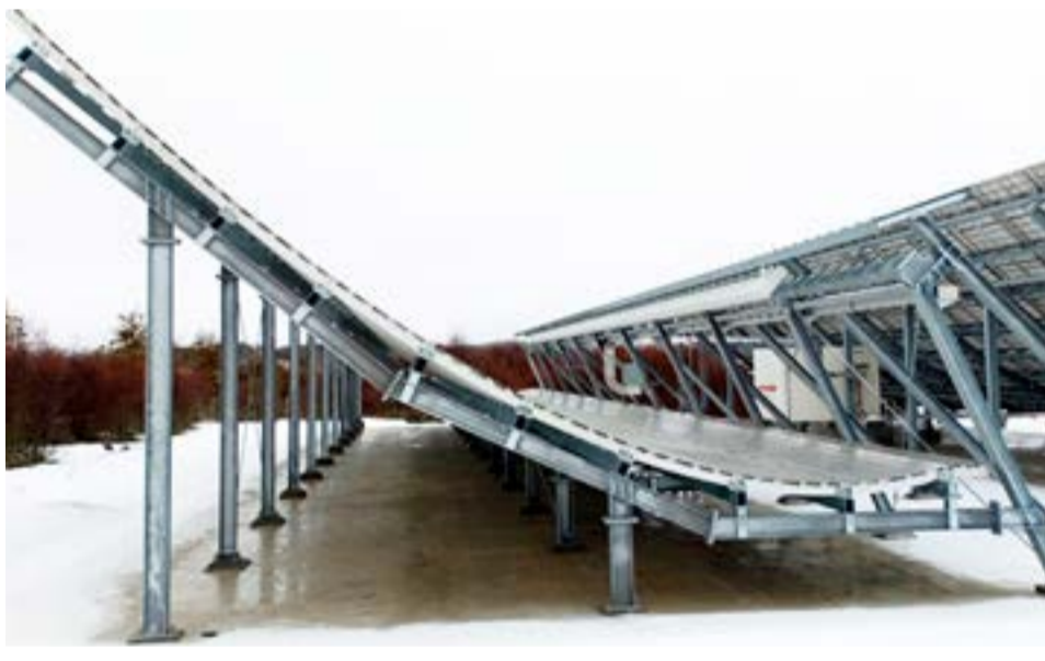
El radar ya está instalado y funcionando en Estancia El Relincho.