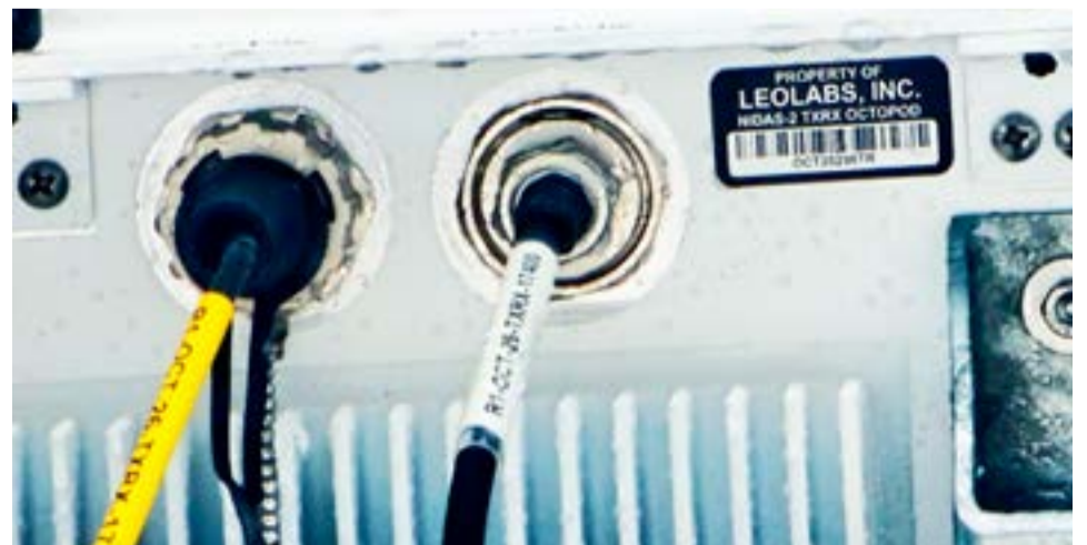
El pasado 29 de junio, mientras los fueguinos estaban discutiendo sobre la instalación del polémico radar, el Gobierno nacional estaba haciendo una inspección para verificar el correcto funcionamiento del sistema.