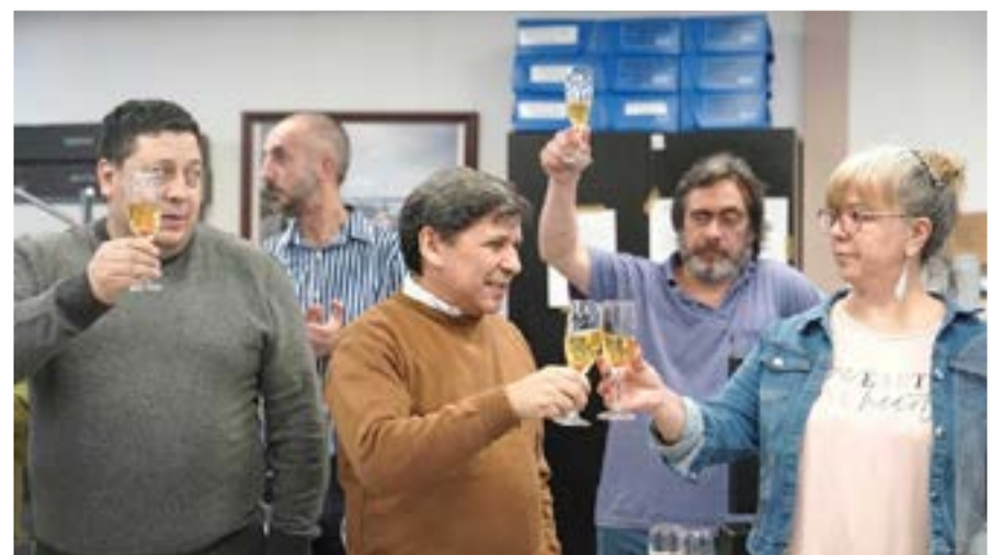
“Las Islas Malvinas, Georgias y Sandwich del Sur son y serán argentinas”

La conmemoración es debido al Primer Congreso Nacional de Empleados Legislativos realizado en la provincia de Salta, en 1960. Por tal motivo, quedó fijada esta fecha como jornada no laborable por convenio legislativo, alcanzando a todos los ámbitos del resto del país, en reconocimiento a la labor que realizan los trabajadores.