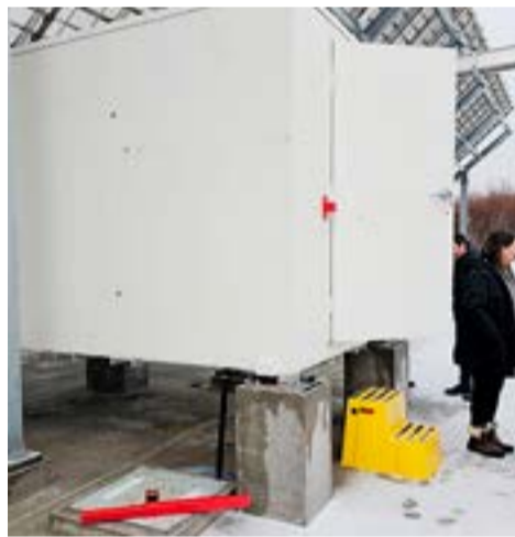
La energía eléctrica trifásica fue pro- vista por la DPE.

Con respecto a la reacción del ministro Taiana, que elevó una nota a la Jefatura de Gabinete para pedir la suspensión del permiso precario, el senador señaló que “él manifiesta que tuvo conocimiento de esta inversión en el mes de marzo o abril a través de una publicación de la embajada argentina en Estados Unidos. Ahí pidió información y tomó la determinación sobre fines de junio de suspender la autorización provisoria. Yo conozco a Taiana por haber compartido un tiempo en el Senado y me parece que bajo ningún