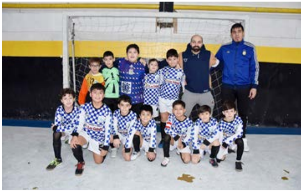
El equipo de Escuela Argentina, 8va división.