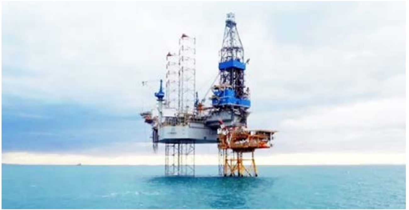
El operador del proyecto es Equinor, pero también participan como socios YPF y Shell.

La medida se publicó este martes en el Boletín Oficial a través de la resolución 17/2023 de la cartera a cargo de Cecilia Nicolini. Se trata de la aprobación del Estudio de Impacto Ambiental para la perforación en aguas ultra profundas en el bloque 100 de la Cuenca Argentina Norte (CAN 100) entre el 15 de diciembre de 2023 y el 15 de junio de 2024. Equinor hará el pozo exploratorio a 1.527 metros de profundidad del lecho marino. El buque que hará los trabajos de perforación es el Valaris DS 17, que en estos momentos está en Río de Janeiro, Brasil.