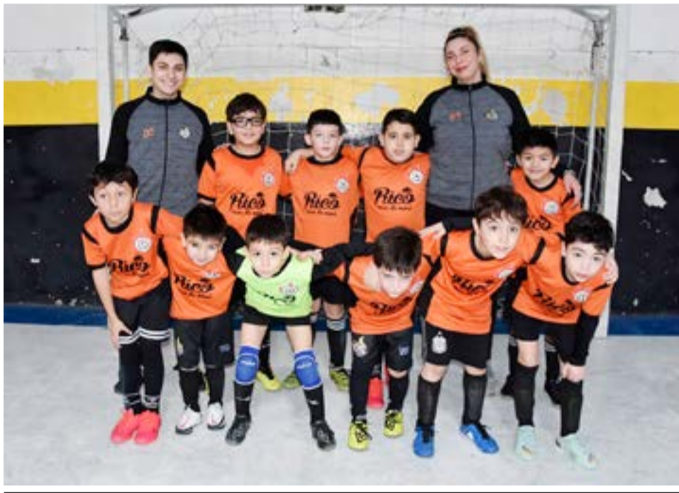
El equipo de ADEFU, 8va división.

divisiones inferiores con equipos que representaran a las tres localidades de la provincia los días 21, 22 y 23 de julio, que coincide con las vacaciones de invierno si no me equivoco, así es que ya estamos coordinado todo para que la sexta, sép-