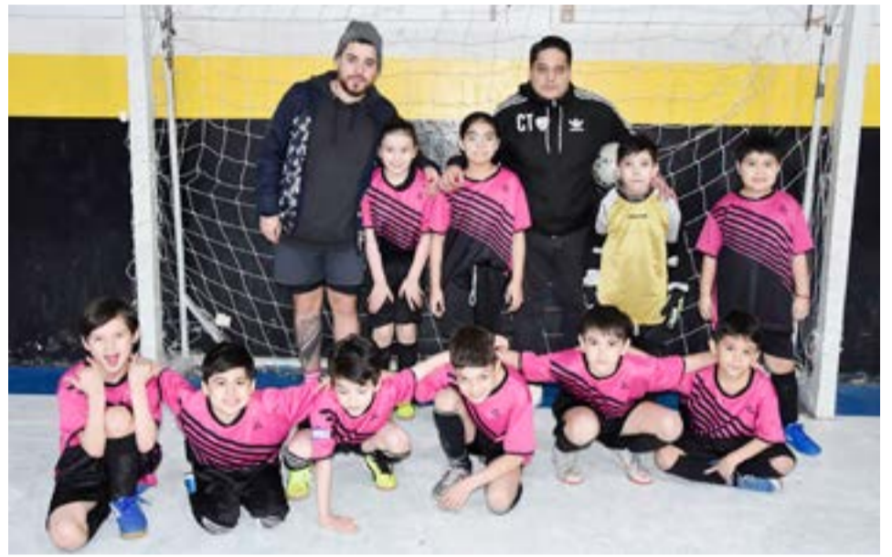
El equipo de Defensores del Sur, 8va división.