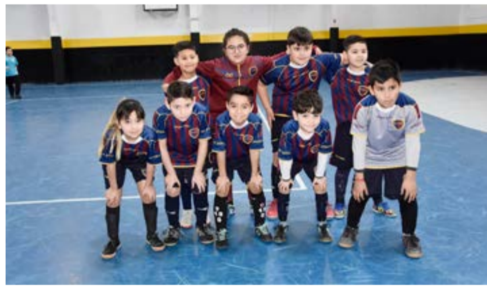
El equipo de Victoria, 8va división.