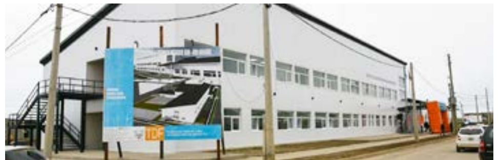
En la asamblea se expresó disconformidad, frente a la posibilidad de continuar con el dictado de clases, sin solucionar definitivamente el problema planteado por la presencia de roedores.

Además, trascendió que frente al problema solamente se colocaron cebos para las ratas y se realizó la limpieza del edificio; pero sin avanzar con una desratización a fondo. Esto generó malestar en padres y madres, quienes en la asamblea expresaron la voluntad de concurrir al Ministerio de Educación, para reclamar una solución definitiva.