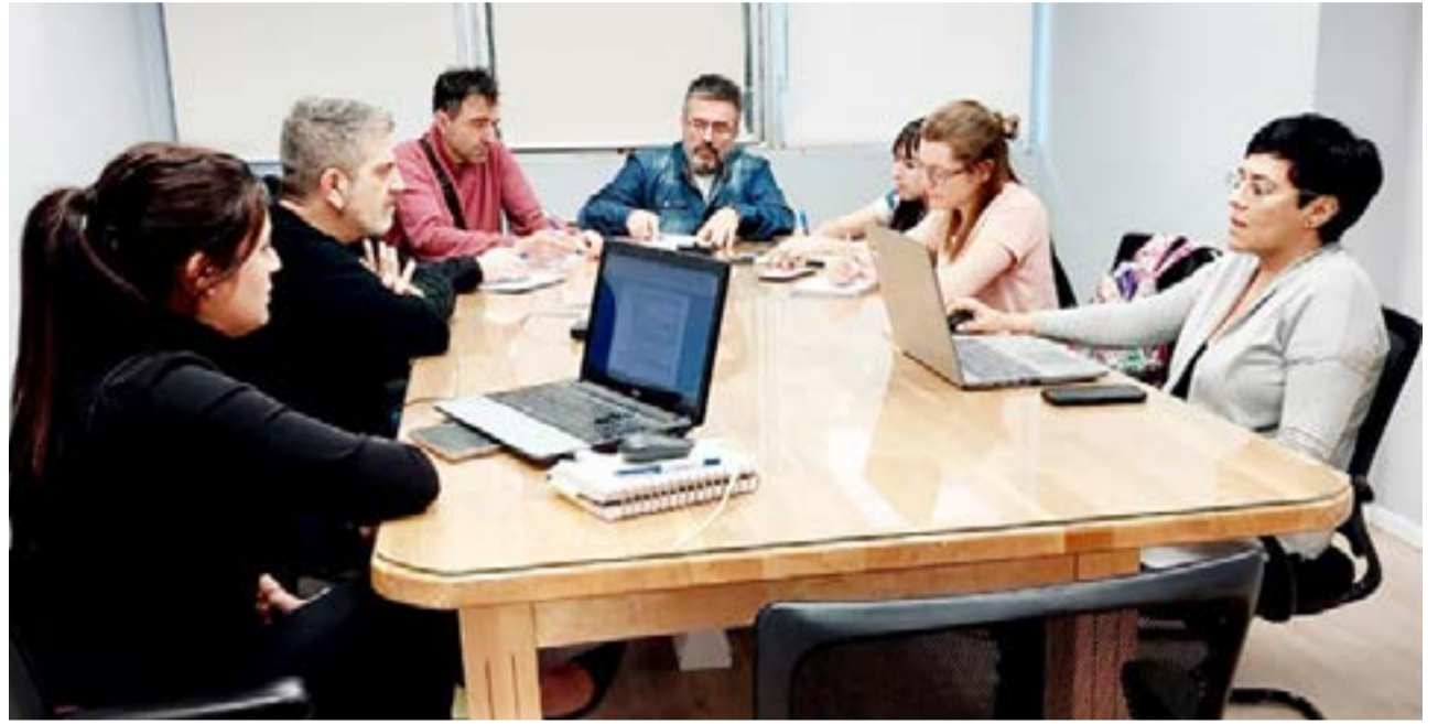
Esta semana se retomó la mesa paritaria salarial docente, en el marco de la Ley Nro. 424, en la ciudad de Ushuaia.

En esos términos, desde la conducción del SUTEF resolvieron que “siendo la última propuesta por parte del Ejecutivo, en la cual se ha presentado una grilla,