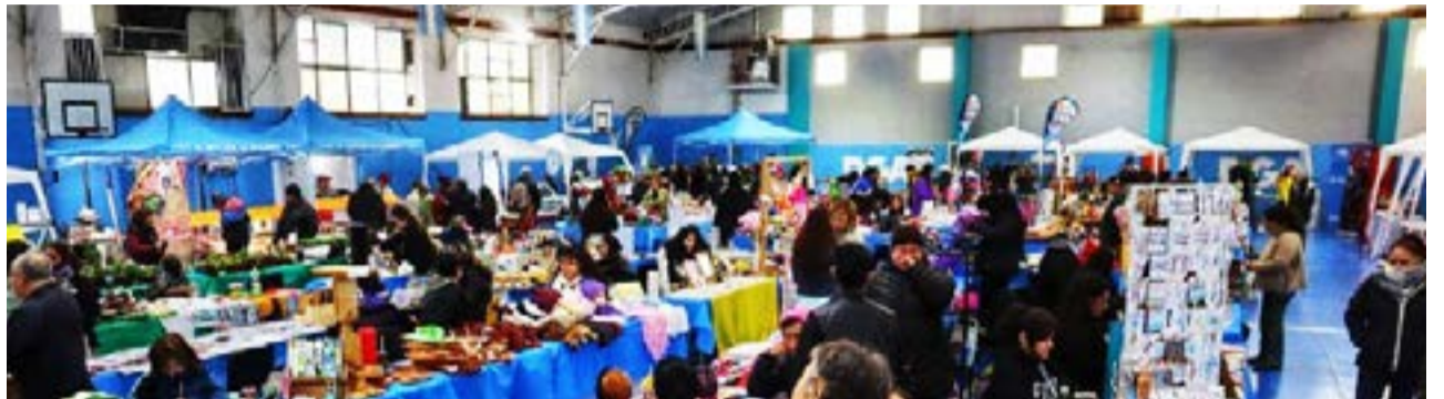
Este sábado 8 de julio, de 11 a 20 horas, el Polideportivo Malvinas Argentinas (Giamarini 3419) se prepara para recibir a los vecinos y vecinas que eligen comprar en el “Mercado en tu Barrio”, una iniciativa municipal que ha llegado para quedarse.

Podrán encontrar los rubros: verdulería, carnicería, pollería, carne porcina, panadería; productos de limpieza, artesanías y propuestas de elaboradores locales. El Mercado en Tu Barrio es un espacio que motoriza la economía local y colabora con la economía familiar. Por ello, el Municipio invita a todas y todos aquellos que aún no ha pasado por él, a que se acerquen y conozcan de primera mano la calidad de los productos y las artesanías hechos en nuestra ciudad.