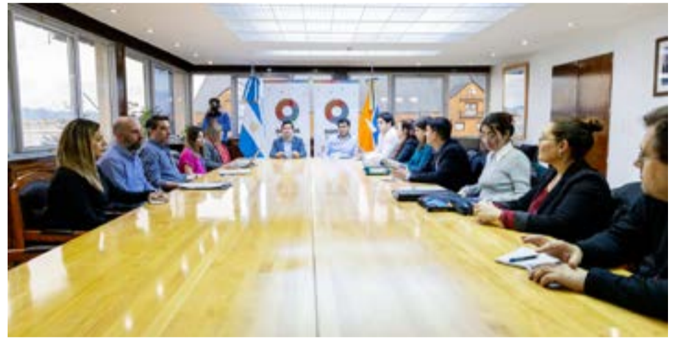
En el marco del encuentro entre los municipios y el Gobierno de la provincia, avanzan en soluciones sobre la percepción del impuesto inmobiliario.