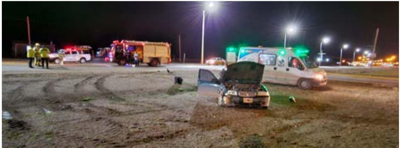
Tres heridos incluidos una mujer y su bebé fueron llevados al hospital tras choque en ingreso a Las Barrancas.

Aparentemente uno de los vehículos, un Skoda, venía en sentido Norte-Sur y cuando iba a bajar al ingreso por el derivador a Las Barrancas, el otro vehículo que venía de frente no logró frenar y lo embistió.