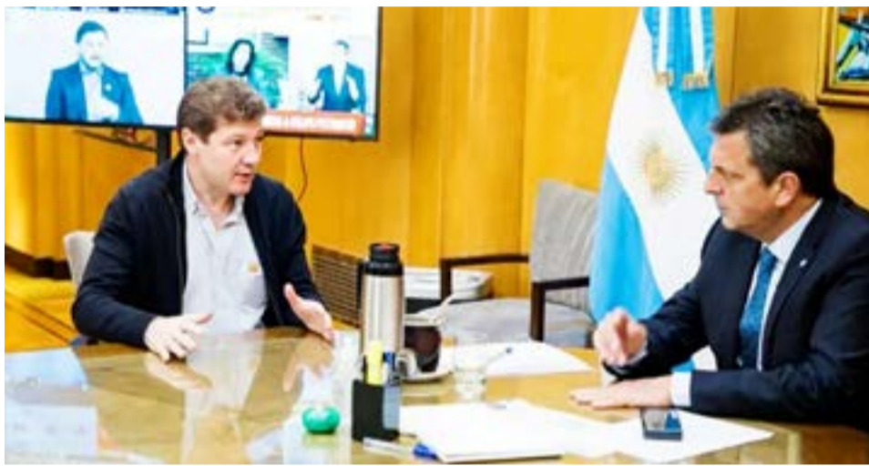
El Fondo Fiduciario para el Desarrollo Provincial fue creado por decreto en 1995 y tiene por objeto, entre otros, asistir y financiar programas que contemplen el saneamiento de las deudas de los Estados Provinciales, su renegociación y/o cancelación.

“Es intención de ese Fondo contribuir a la sostenibilidad de los esquemas fiscales provinciales, a través de préstamos solventados con fondos propios y/o transferencias del Tesoro Nacional”, resaltó Economía.