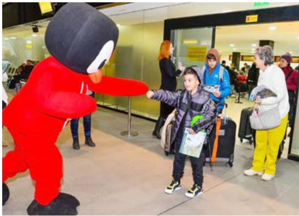
Arribó a Ushuaia un vuelo de Aerolíneas Argentinas con pasajeros procedentes de San Pablo, Brasil, en el marco de la temporada de invierno 2023 que el área de Turismo municipal promocionó en su gira nacional.

de la ciudad, como también corroborar los alojamientos, servicios y excursiones habilitadas, velando por su seguridad y