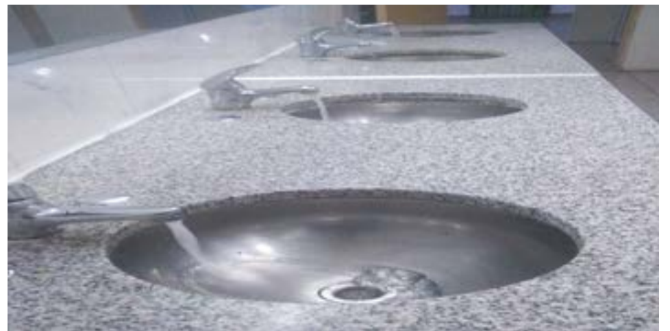
Cabe recordar que por el hecho se abrió una investigación a fin de dar con los responsables del hecho.

"Pedimos a todos que estos nuevos arreglos se cuiden y que quien vea que se está rompiendo, robando o sacando algo de su lugar lo advierta. Esto es algo que tenemos que hacer entre todos porque es de todos" aseveró Turdó.