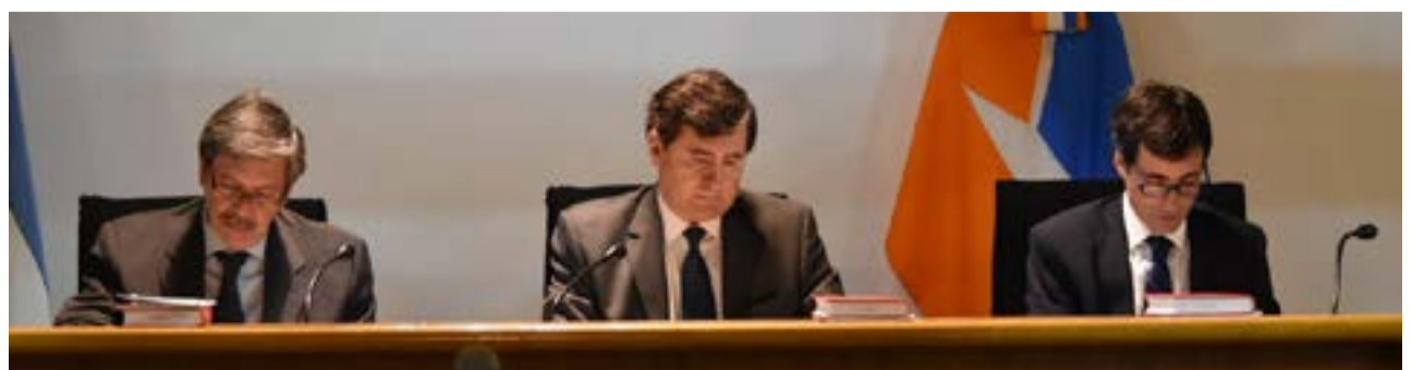
Condenan a 9 años de prisión a un hombre por el delito de abuso sexual en la ciudad de Ushuaia.