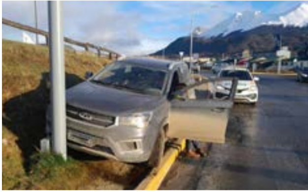
Una mujer resultó lesionada en un choque en Ushuaia.

Ushuaia.- Una vez en el lugar se constató el siniestro entre los rodados Chery Tiggo; el cual era conduci-