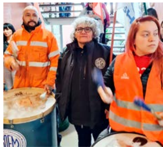
Hubo un nuevo rechazo a la oferta salarial y continúan las asambleas por los sectores.

Igualmente, la propuesta que llevó la Municipalidad de Ushuaia indicaba que “en el caso de las 144 personas ya enunciadas en anteriores reuniones cuyo básico más zona no supera los ciento ochenta mil pesos ($ 180.000) todos dentro del grado”.