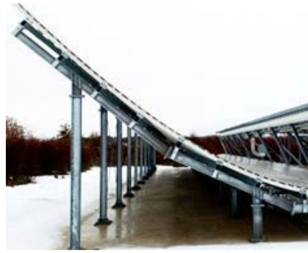
Melella indicó que “sería bueno que la Estación Astronómica de Río Grande, que es la que realiza este acuerdo, salga a explicar, porque cuando nosotros pedimos información nos dijeron que era un radar para identificar la basura en la órbita. Esto también lo dijo públicamente el Embajador argentino en los Estados Unidos”.

porque va a ser jefe de campaña. Fue un momento bueno y positivo a pesar del contexto del país”.