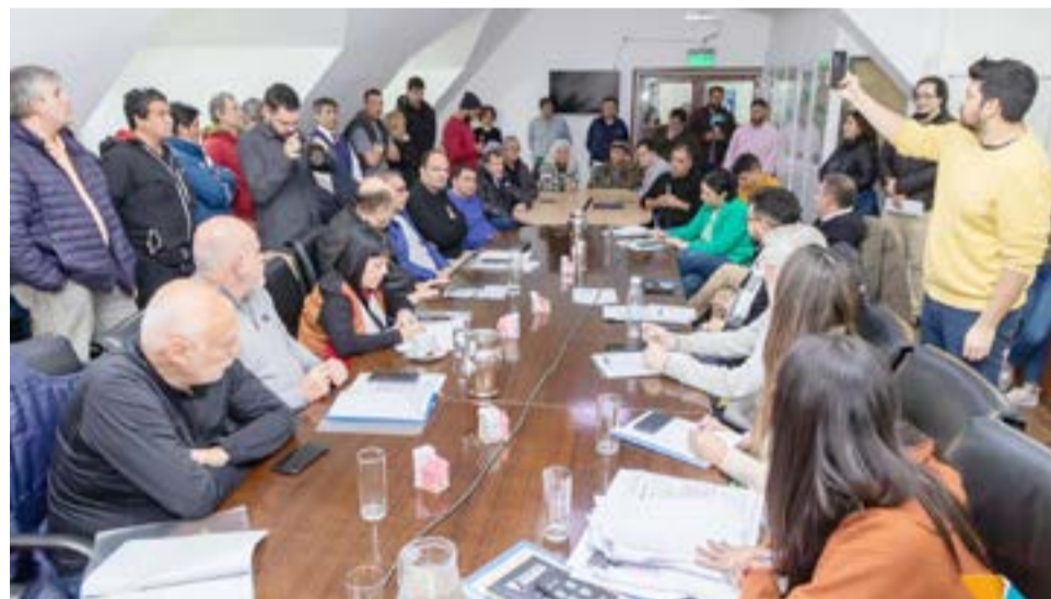
Ayer se reunió la comisión 1 de legislación general para debatir el pedido de taxistas y remiseros, y del Concejo Deliberante, para que se sancione una ley que prohíba la instalación de UBER.

el turista que circula por la ciudad. Hay esperas de 45 minutos o de una hora y eso no puede seguir pasando. Nosotros tenemos que garantizar que la población tenga el servicio de transporte público como corresponde. En caso de que se autorice UBER tendrá que cumplir con todos los requisitos de los taxis y remises", consideró.