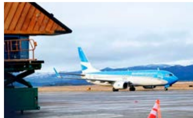
Según el informe mensual que registra la Administración Nacional de Aviación Civil (ANAC) 66 mil pasajeros pasaron por Ushuaia en junio.

con un impacto económico proyectado de 2.522 millones de dólares, mientras desde abril, las cifras superan a la pre pandemia. Ushuaia se posiciona como uno de los destinos que de seguro estará entre los más elegidos por los turistas para disfrutar de la nieve y actividades invernales.