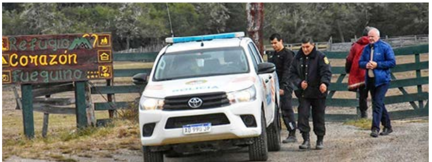
Los tres imputados por el incendio en la Reserva Corazón de la Isla, ampliarán su declaración indagatoria.

Y agregó: "Ya prestaron declaración, ahora como hubo una modificación en la imputación debemos darle el derecho de defensa, y luego quedará en su decisión si declarar o no".