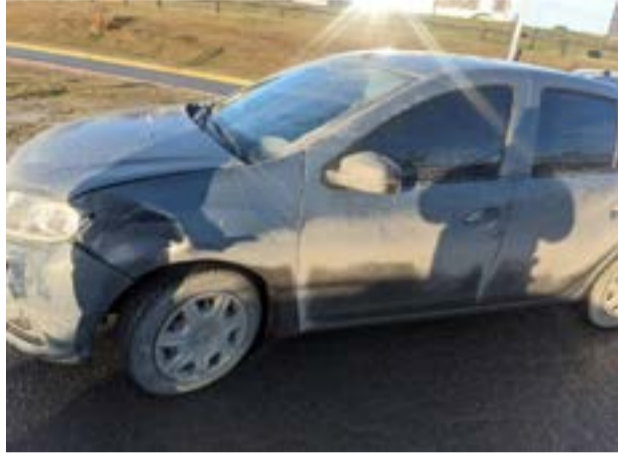
Uno de los conductores confió que debido al resplandor del sol no pudo ver al otro vehículo.