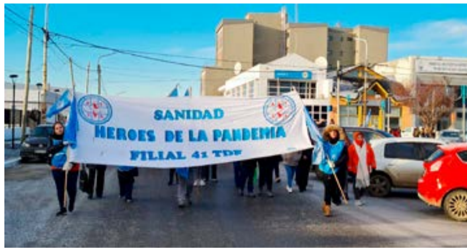
Trabajadoras y trabajadores del hospital de Río Grande se movilizaron, ayer por la mañana, pasando por las delegaciones del Ministerio de Salud y de Gobierno.

Etchepare señaló que “los compañeros quisieron salir a manifestarse y seguro se van a endurecer las medidas, ya es jueves, mañana es viernes y tenemos una semana más perdida sin una propuesta que supere lo que nos quieren dar y que cubra nuestras expectativas”, advirtió. Para concluir, manifestó que “el ministro está jugando mucho con el tema de la paz social, tenemos otra organización que se manifiesta todos los días y está con desobligaciones; parece que el ministro de Economía está buscando un enfrentamiento con los trabajadores”, advirtió la secretaria General de ATSA.