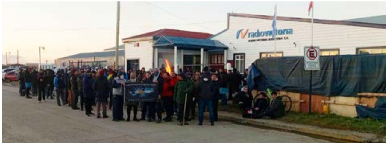
Anoche, a las 22:30, comenzó un paro por tiempo indeterminado de la UOM seccional Río Grande.

El reclamo de las y los metalúrgicos riograndenses es