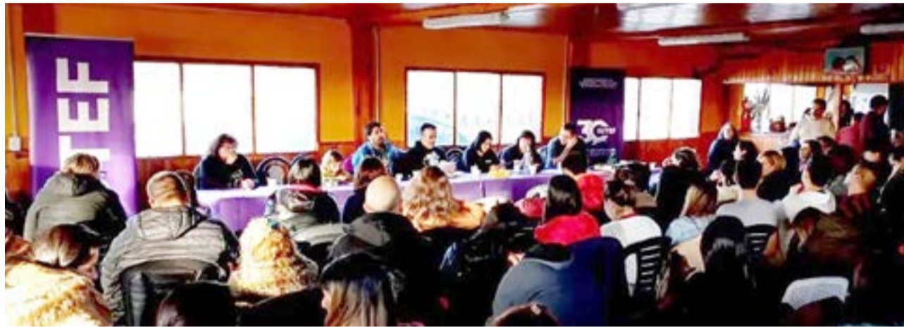
Se llevó adelante el Congreso Provincial del sindicato docente, con la participación de más de 100 delegadas y delegados del SUTEF en el Quincho del Autódromo de la ciudad de Tolhuin.

Lugares de concentración para desobligaciones Turno mañana y Turno tarde Ushuaia: Escuela Nro. 1 Río Grande: San Martín y Belgrano Tolhuin: Rotonda. Jueves 13/07: Conferencia de prensa a las 11.30 hs. en la seccional de SUTEF en Río Grande (Fagnano 1145), con participación de delegadas y delegados. Asambleas en todas las instituciones educativas de Ushuaia y Tolhuin. Viernes 14/07 turno mañana y tarde: desobligaciones con movilización. Turno vespertino: desobligaciones internas constituyéndose en asambleas dentro de la institución. Horarios de desobligación turno mañana: 10:45 hs. Turno tarde: 15:35 hs. (en el caso de Educación Primaria, por hora extendida hay que agregar 20 min. a la convocatoria 15:55 hs.). Turno vespertino: se realizará una vez cumplida el 50% de la jornada escolar del estudiantado de cada institución. Lugares de concentración para desobligaciones T.M. y T.T. Ushuaia: Escuela Nro. 1; Río Grande: San Martín y Belgrano; Tolhuin: Rotonda.