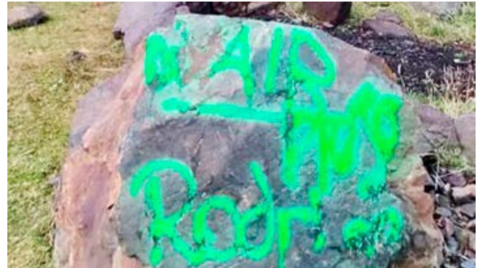
Se registraron nuevos hechos vandálicos en las reservas Río Valdez y Playa Larga.

no asociado a la costa -ya que muchas especies eligen estos espacios para alimentarse y descansar-, sino que está además vinculado con la salud y zoonosis asociada a su presencia y por supuesto,