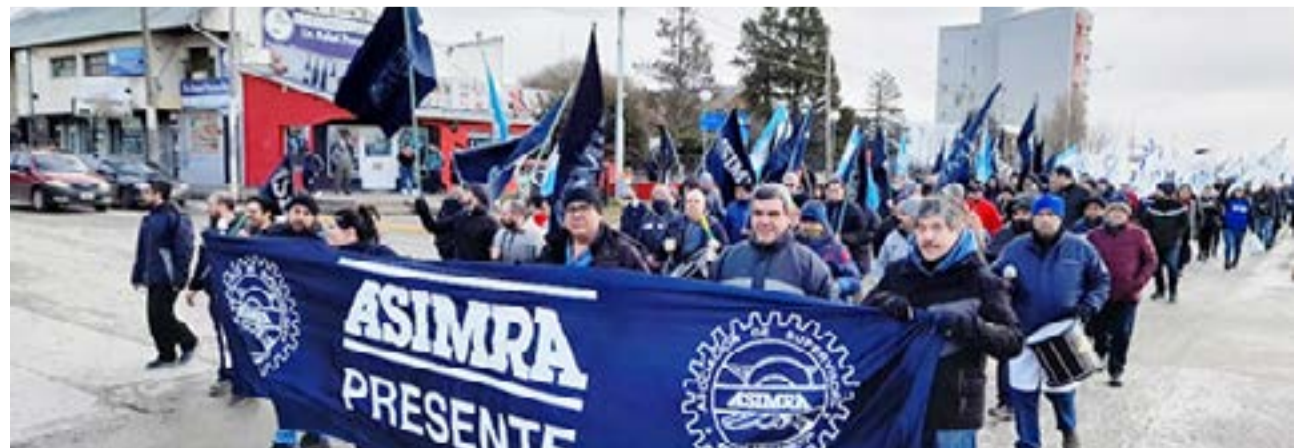
El Congreso Extraordinario de ASIMRA seccional Patagonia resolvió el inicio de medidas de fuerza desde este lunes 10 de julio.