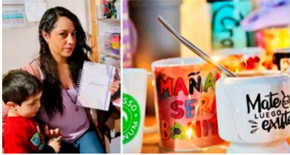
Koshpe: emprendimiento magallánico de diseño y elaboración de cuadernos personalizados.

Punta Arenas (LPA).- La posibilidad de dar vida a las ideas de cada uno de sus clientes, en un diseño único que se elabora junto al cliente y de acuerdo a sus necesi-