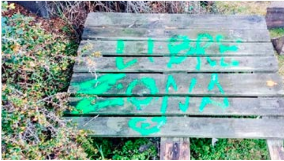
Estos incidentes afectaron tanto la Reserva Provincial Playa Larga como a la Reserva Río Valdez.

actividades no permitidas dentro de la reserva, como aperturas de camino, tala de