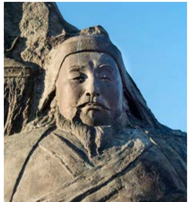
La dinastía Yuan (oficialmente Gran Yuan "Gran Estado Yuan") fue una dinastía china fundada por los invasores mongoles en el año 1271.

las dinastías Yuan", contó el coleccionista.