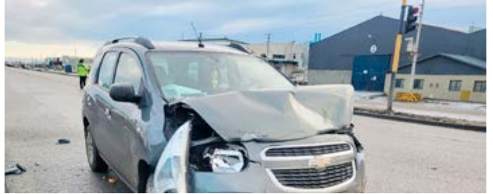
La colisión se produjo en Islas Malvinas y D'Agostini de Río Grande.