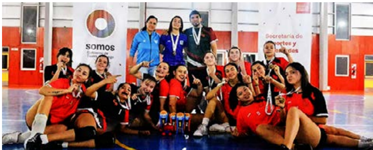
El equipo del club Universitario correspondiente a las categorías sub-15 y sub-17 de la rama femenina, logran obtener las dos plazas para la instancia provincial de los Juegos Fueguinos 2023.

El club Universitario se clasificó a la instancia provincial en la categoría femenina sub-15 y sub-17 tras la etapa de clasificación donde ambos equipos finalizaron en el primer lugar, ya que el sábado en el gimnasio de la Escuela N° 21, Universitario enfrentó a Malvinas Vóley y Secretaría de Deportes, con triunfos en ambos encuentros, y continuando el domingo en la Casa del Deporte, la Sub-17 de Universitario venció a Metalúr-