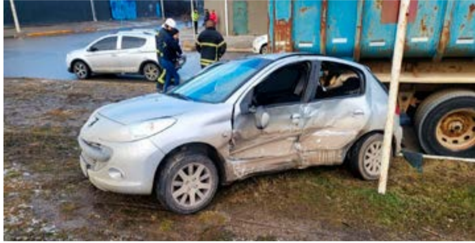
Dos personas trasladadas al Hospital tras fuerte impacto entre rodados.

Río Grande.- Alrededor de las 16:20 hs personal policial intervino por una colisión entre los rodados: Chevrolet Spin color verde conducido por Alejandra Ve-