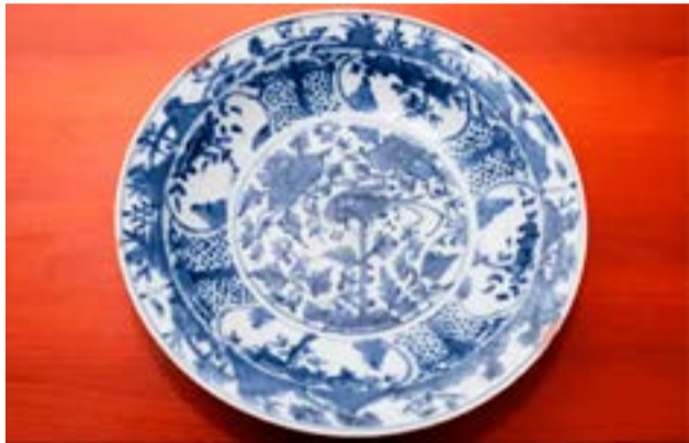
El objeto tiene 700 años de antigüedad y pertenece a la dinastía Yuan (1271 - 1386), la primera dinastía liderada por extranjeros de China.