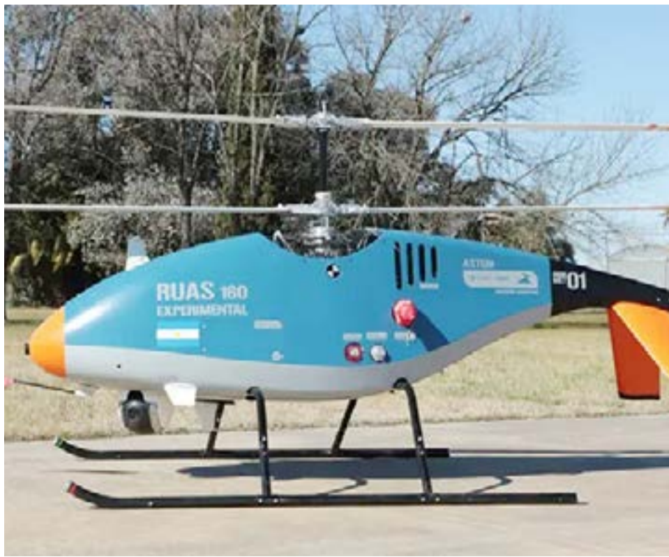
El IDC utiliza el ROV para realizar relevamientos de recursos marinos, costeros, sitios arqueológicos y turísticos en colaboración con la empresa Terminales Marítimas Patagónicas (Termap), responsable del transporte de hidrocarburos.

En resumen, los vehículos autónomos con inteligencia artificial y control remoto están encontrando su camino en áreas de difícil acceso y peligrosas en Argentina. Con aplicaciones que van desde el conteo de colonias de pingüinos en la Antártida hasta la elaboración de mapas de sensibilidad ambiental en áreas subacuáticas, esta tecnología demuestra su utilidad en diversos campos. El impulso tanto del sector público como del sector privado, junto con la colaboración de universidades y el Ministerio de Defensa, está permitiendo el desarrollo y la implementación de estos vehículos autónomos, brindando beneficios tanto científicos como de búsqueda y rescate.