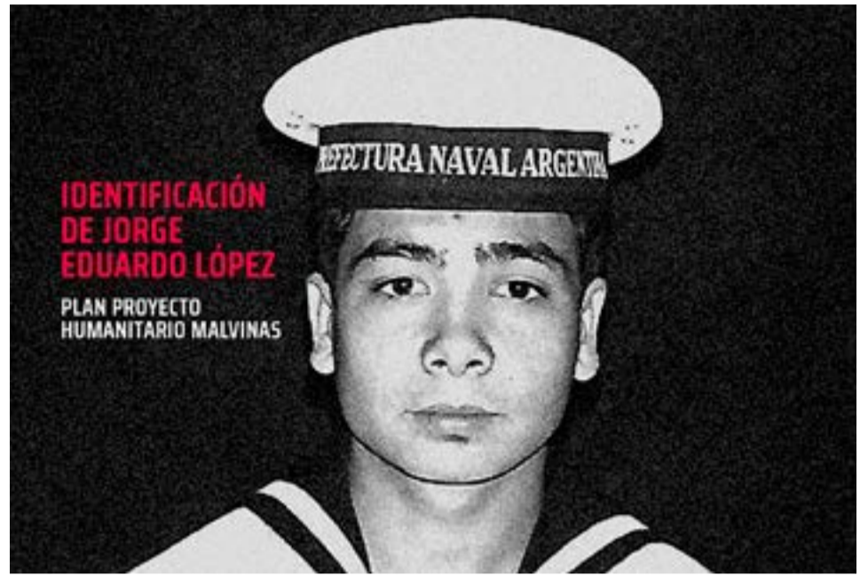
Cabo segundo Jorge Eduardo López de la Prefectura Naval Argentina, caído en la guerra de Malvinas.

Así, narró que “aquel 10 de mayo el Isla de los Estados navegaba a oscuras por el Estrecho de San Carlos en una misión de abastecimiento de víveres, municiones, medicamentos y vehículos con destino a Puerto Yapeyú. Jorge y otros 24 héroes fueron sorprendidos por el fuego de la fragata Alacrité. Nuestro buque se incendió y hundió en el estrecho, solo dos tripulantes sobrevivieron”.