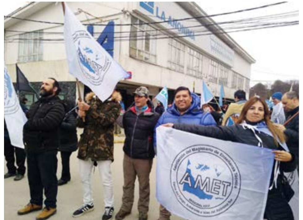
La Asociación Magisterio de Enseñanza Técnica (AMET) de Tierra del Fuego, expresó su "profunda preocupación por el modelo de concurso para el acceso a cargos jerárquicos que pretende instaurar el Ejecutivo provincial".

dependiendo el 80% restante de un coloquio integrado seguramente por acto-