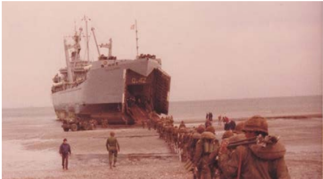
Las fuerzas argentinas partieron el 28 de marzo desde el continente rumbo a Malvinas en el ARA Cabo San Antonio.

Vale acotar que en los últimos años han sido muchos los VGM que tuvieron que recurrir a los estrados judiciales al detectarse incongruencias o arbitrariedades a la hora de definir la condición de excombatientes a militares o civiles destacados al conflicto y que realizando tareas similares sufrieron la aplicación de criterios totalmente dispares por la aún no zanjada cuestión sobre el concep-