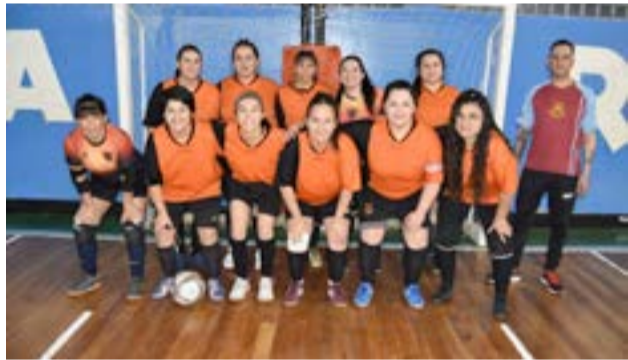
El equipo de Olympic F.C., categoría mayores zona "B".

Río Grande.- Comenzado el calendario deportivo con el inicio del torneo Apertura de futsal (CAFS) que tradicionalmente año tras año la 'Asociación Civil, Deportiva, Social y Cultural de Río Grande' realiza en la ciudad, es que el sábado 21 de abril desde las 11.00 horas en las instalaciones del polideportivo Alejandro "Guata" Navarro, se disputó la primera fecha del certamen que ha reunido a dieciocho equipos riograndenses pertenecientes a la primera división y con la particularidad de que en esta oportunidad, el campeonato se disputará con ocho equipos que pertenecen a la zona "A" con la modalidad que será todos contra todos en fase clasificatoria, en el cual los primeros cuatro mejor posicionados jugarán la semifinal y final, mientras que los otros diez equipos que pertenecen a la zona "B", también tendrán las mismas características que la división "A".