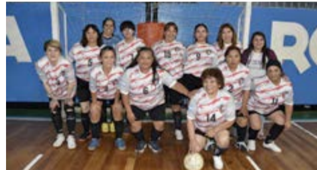
El equipo del Club Atlético Río Grande, categoría mayores zona "B".

sotros podemos lograr visibilizar esta linda actividad deportiva que involucra exclusivamente a todas las mujeres riograndenses que juegan al futsal, así es que reitero mi agradecimiento en nombre de toda la comisión directiva; y con respecto al inicio de este ya tradicional torneo de futsal femenino que la asociación realiza en Río Grande ya hacer muchos años, bueno, contarte