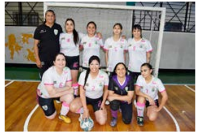
El equipo de Sol Naciente, categoría mayores zona "B".

Spordivas 2 Garibaldi 5 Partido 6 – categoría "B" – inicio: 16.00 horas Olympic FC 2 Águilas del Sur "B" 11