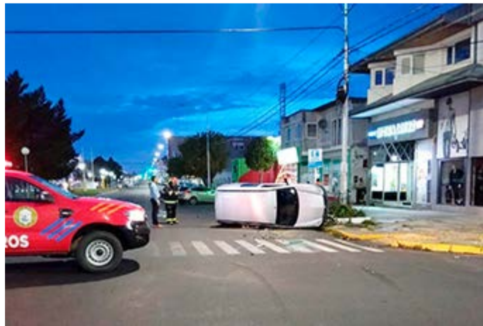
Violento choque y vuelco en la zona céntrica de Río Grande, sin heridos.

dos precedentemente aquejaba dolencias. Es de mencionar que en el lugar se hizo presente personal de la División Bomberos de Policial, personal de Bomberos Voluntarios y personal de Tránsito Muni-