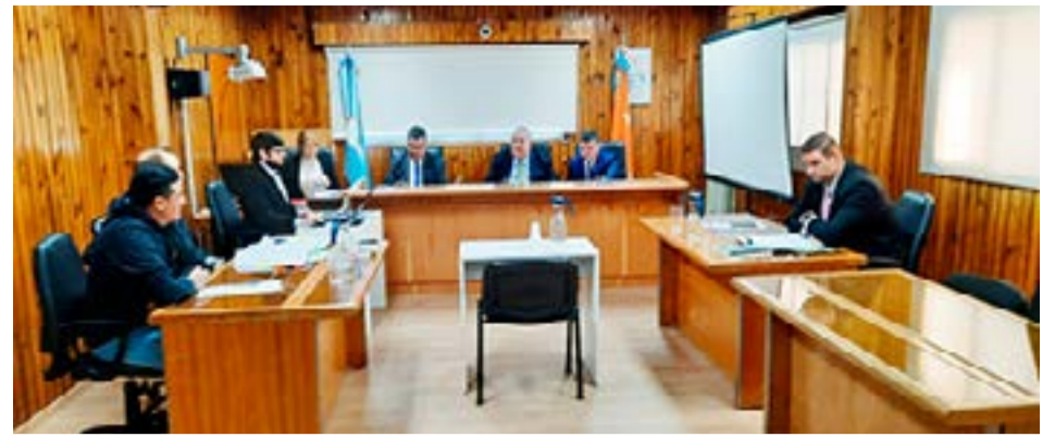
Sujeto que abusaba de dos sobrinas fue condenado a 18 años de prisión y se lo detuvo tras conocer el veredicto.

do; estos últimos verificaron la totalidad de la documentación de ambos vehículos, los cuales poseían en regla. Asimismo procedieron a efectuar el correspondiente test de alcoholemia arrojando ambos conductores resultado NEGATIVO (0,00 G/L).