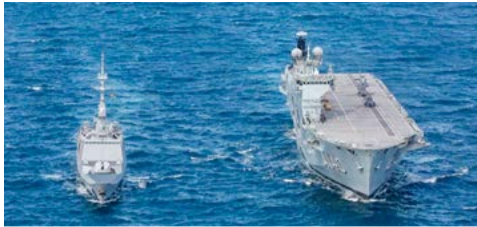
Durante las últimas semanas, las unidades que conforman la misión francesa han tenido una activa participación en el Mar Caribe y el Atlántico Sur.

conformando un Grupo de Tareas Combinado en aguas de la Baía de Sepetiba. Además de las operaciones de estricto carácter anfibio, los buques multipropó-