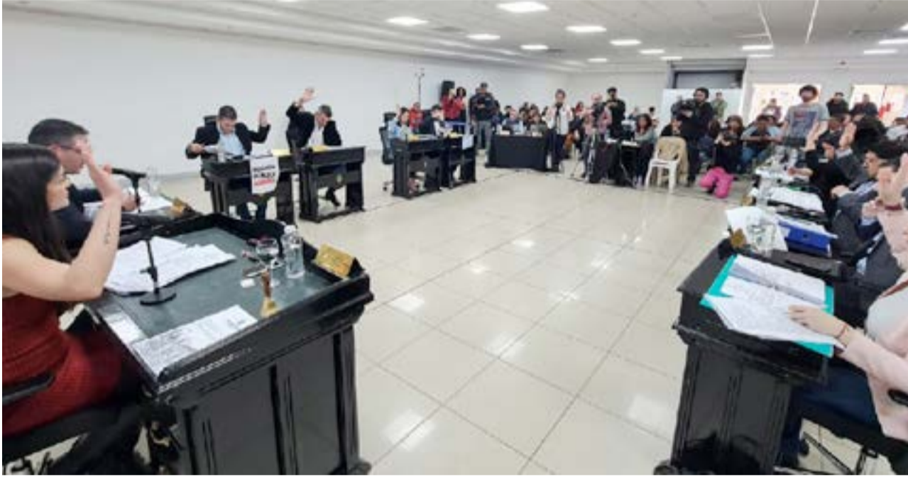
Este jueves los concejales llevaron adelante la III Sesión Ordinaria en el Centro Cultural Yaganes en la cual pusieron a consideración una variada cantidad de proyectos impulsados desde los distintos Bloques que integran el Cuerpo de Concejales como así también por el Departamento Ejecutivo Municipal