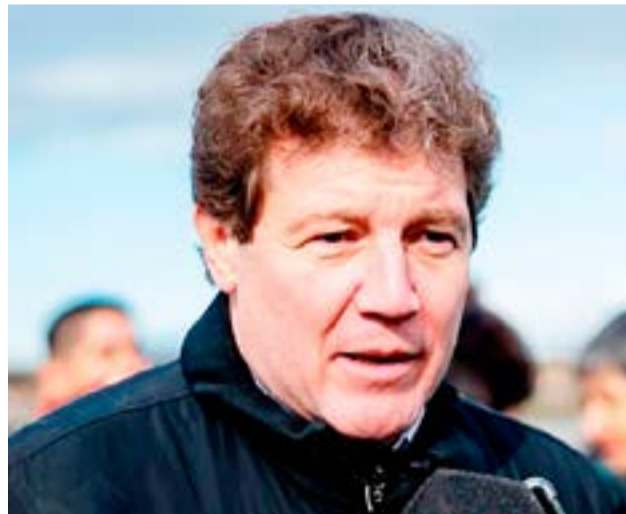
El Mandatario Provincial Gustavo Melella lamentó las asiduas críticas que recibe el régimen impositivo que rige en la provincia, entendiendo que responden “a una ignorancia absoluta sobre el tema”.

está enviando dinero. Por más que se nos quite el subrégimen no va a significar que se va a poder sostener la