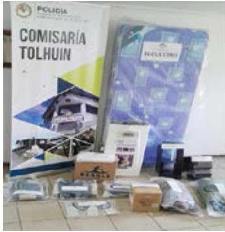
Allanamiento permitió esclarecer robo en Tolhuin.

Las medidas fueron dispuestas en el marco de la Causa 886/24 caratulada "S/Dcia. S/ROBO" en trámite ante el Juzgado de Competencia Integral Tolhuin, quien además ordenó la notificación de Derechos y Garantías sobre el imputado.