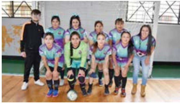
El equipo de Spordivas, categoría mayores zona "A".

entrenadoras y acompañando a sus equipos y siempre colaborando y siempre presentes. Y por suerte estamos vislumbrando el florecimiento de nuevas chicas que se