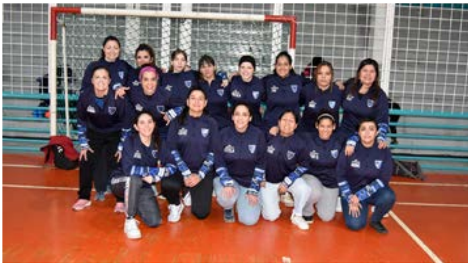
El equipo de A.A.T.E.D.Y.C., categoría mayores zona "A".

"También quiero resaltar que la 'asociación civil, deportiva, social y cultural de Río Grande' es una de las pocas o la única institución o federación que de pronto desarrolla este evento sin ningún tipo de inconvenientes, si bien hay técnicos mujeres, también hay técnicos hombres, pero en definitiva el evento se desarrolla de forma impecable, tanto en el apertura como el clausura y ese es el objetivo que creo que tiene la organización, y por