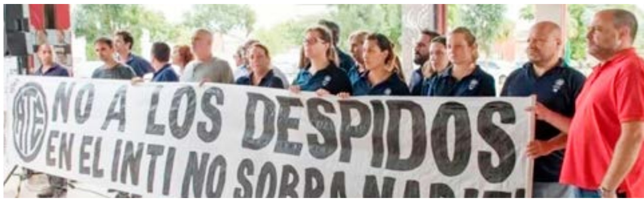
El reciente anuncio de Nación de cerrar ocho sedes en la Patagonia, generó alarma en Tierra del Fuego, donde el INTI tiene una sede.

La noticia del cierre generó preocupación tanto en los trabajadores del INTI como en la comunidad industrial y académica de la provincia, que ve en esta medida un retroceso en el apoyo y desarrollo tecnológico local.