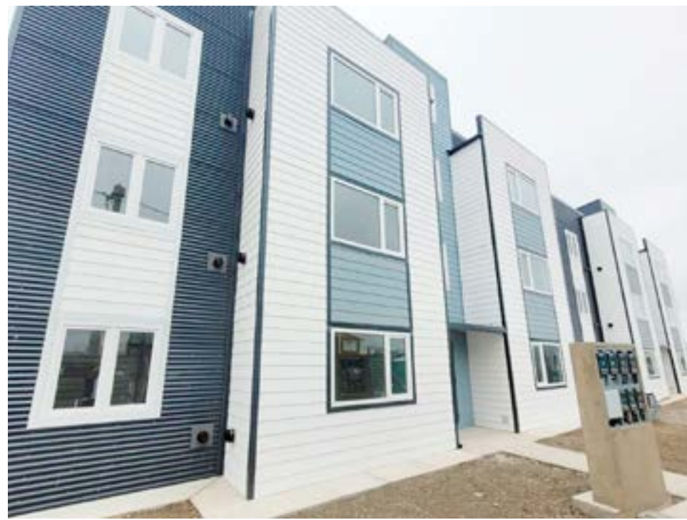
“Hay 446 viviendas entre Ushuaia y Río Grande, que son las viviendas Casa Propia y también las 54 viviendas de Río Grande que están a más del 95%”, dijo.

Consultada sobre los seguros de las viviendas del IPV, dijo que “en 2022 se firmó un convenio con una compañía de seguros y se le propone al adjudicatario de las viviendas que no tenían seguro, si acepta. Si no acepta, puede traer su propio seguro. El IPV propone una compañía pero siempre está la libertad del adjudicatario poner el seguro que quiera. El seguro es obligatorio, pero no la compañía. Tenemos muchos con-