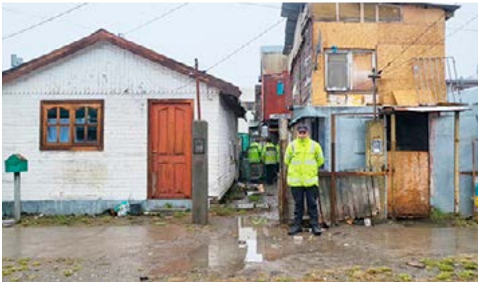
Allanamiento positivo y dos detenciones por el robo a una empresa constructora.