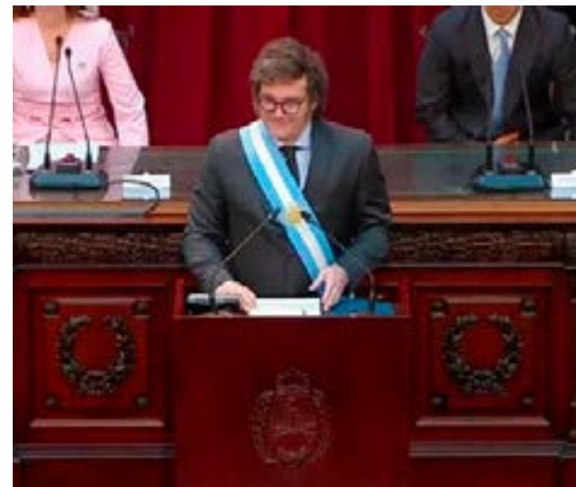
El presidente Javier Milei se prepara para presentar el Presupuesto 2025 ante el Congreso el próximo lunes 16 de septiembre.

del crimen organizado, según la argumentación oficial. Las autoridades se encuentran elaborando además los datos cuantitativos que contendrá el proyecto (inflación