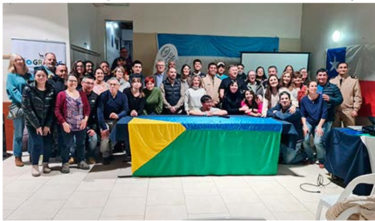
Con gran acompañamiento institucional se lanzó la 33ª Edición del Raid Náutico Binacional entre Argentina y Chile en el Club Náutico Ioshlelk Oten.

Agregó que "desde la Provincia acompañaremos con lo que haga falta, no solo nuestra Secretaría de Deportes, sino seguramente, y esto lo confirmaremos más adelante, con el apoyo de otras áreas gubernamentales