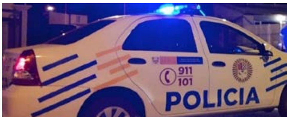
Un hombre de 70 años fue encontrado sin vida en el interior de su casa en Ushuaia, sin que se constataran indicios de criminalidad.

El Juzgado interviniente ordenó la realización de una autopsia.