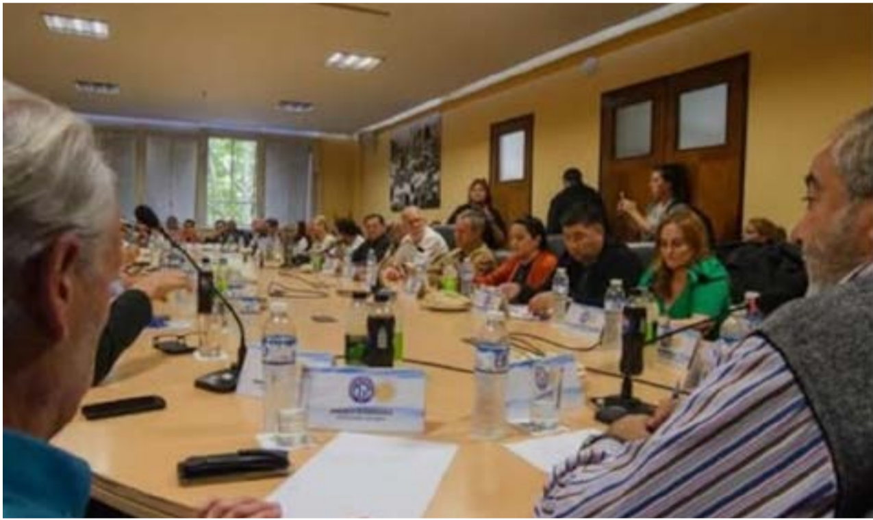
La CGT cambió la fecha de la marcha por el Día del Trabajador: será el 30 de abril y no el 1° de mayo. Sorpresivamente, el cambio obedeció a temas organizativos.