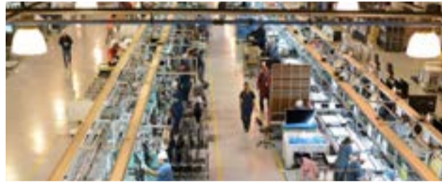
El Fondo Monetario Internacional (FMI) recopiló una serie de reformas que el Gobierno nacional debe cumplir a partir del nuevo acuerdo de endeudamiento, y entre ellas se mencionan los beneficios fiscales con los que cuenta Tierra del Fuego.

Y agrega: "Desde una perspectiva de equidad, la alta dependencia de los impuestos indirectos, que representan más de la mitad de todos los impuestos, reduce la progresividad, y las exenciones fiscales (incluso para apoyar la producción en regiones como Tierra del Fuego) también contribuyen a las inequidades".