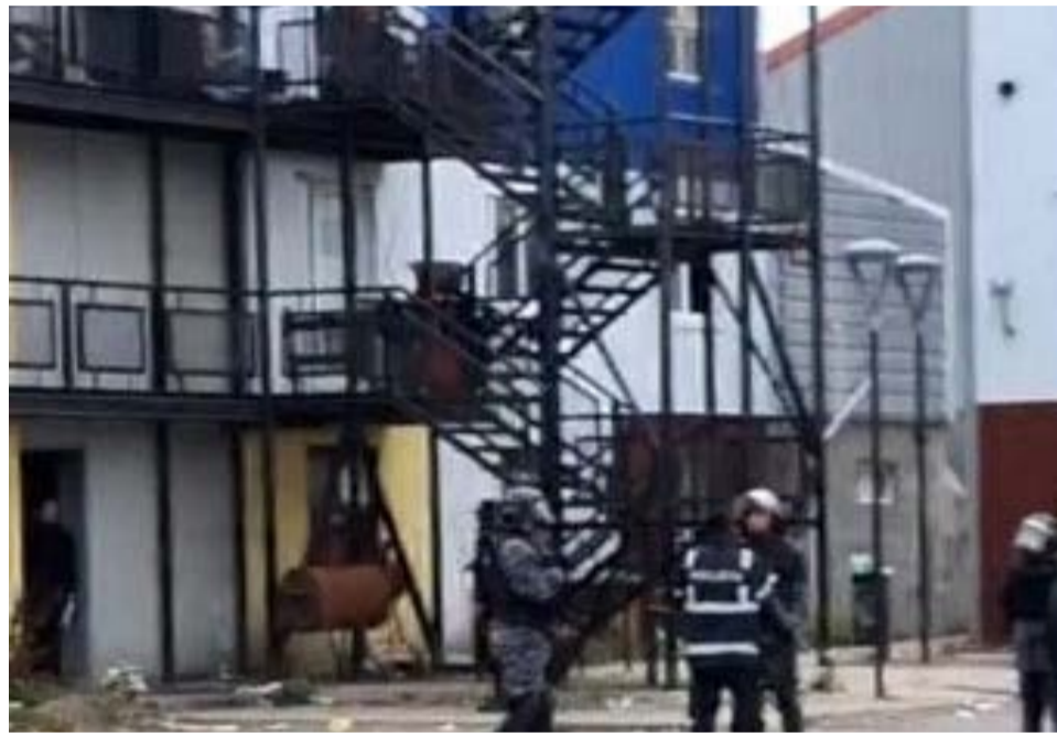
Tres personas fueron aprehendidas en un operativo policial en Chacra IV que demandó de varias horas y la intervención de más de una veintena de efectivos policiales.

versión oficial sobre los hechos acontecidos, una pareja habría tenido un problema de violencia intrafamiliar, y luego, habrían intervenido en la situa-