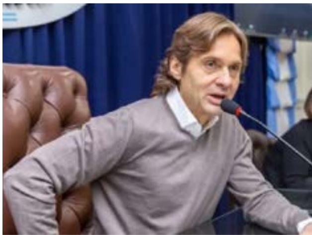
El legislador Sciarano destacó que “es llamativo el análisis del Fondo Monetario Internacional, que toma como ejemplo la industria fueguina cuando tiene mucha más carga fiscal el sistema impositivo de Córdoba para el sector automotriz, teniendo en cuenta que Tierra del Fuego sostiene el mismo régimen con el que se produce tecnología en el mundo y particularmente en nuestra región, en países como Brasil y México”.

Ushuaia.- El legislador Sciarano destacó que “es llamativo el análisis del Fondo Monetario Internacional, que toma como ejemplo la industria fueguina cuando tiene mucha más carga fiscal el sistema impositivo de Córdoba para el sector automotriz, teniendo en cuenta que Tierra del