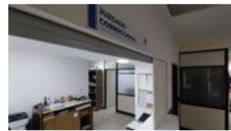
El Juzgado Correccional de Río Grande dictó 4 sentencias mediante el instituto de Omisión de Debate.

Tras una discusión de índole religiosa, el hombre agredió a la mujer y a su hijo, cuando éste último intercedió en defensa de la víctima.