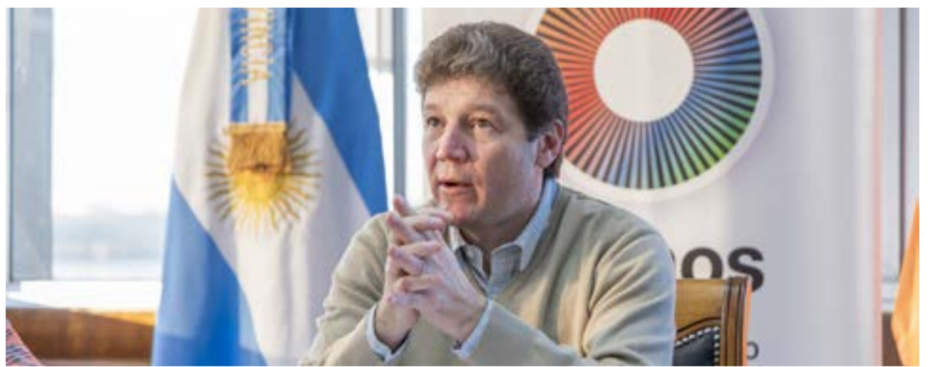
El Gobierno de la Provincia planteó su preocupación por la posible eliminación del subrégimen de promoción industrial a partir del acuerdo entre el Gobierno Nacional y el Fondo Monetario Internacional (FMI).

Al mismo tiempo planteó que "es inadmisibles que vuelvan a considerar un perjuicio un subrégimen que signi-