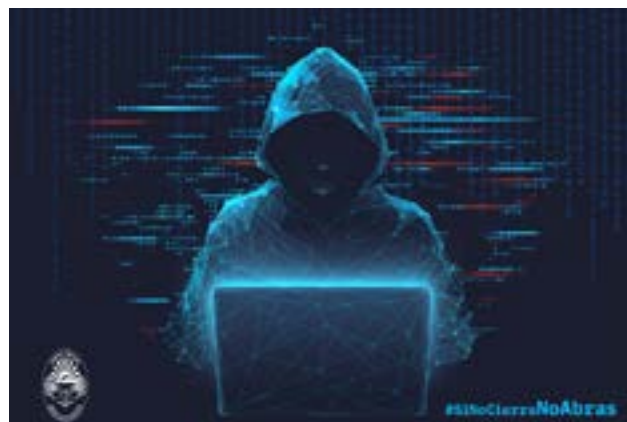
Entre enero y junio se registraron más de 600 estafas virtuales en Tierra del Fuego.

"El crecimiento de este tipo de delitos exige una respuesta preventiva basada en la información. Es clave que las personas estén alertas y sepan cómo actuar ante intentos de engaño", destacaron desde el Ministerio Público Fiscal.