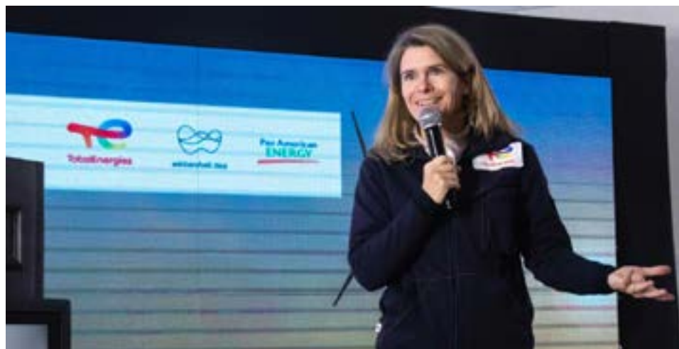
Catherine Remy, Country Chair de TotalEnergies en Argentina, visitó la provincia y compartió detalles sobre la operación de Fénix y la construcción del parque eólico más austral del mundo

Durante su visita, también encabezó la inauguración de una nueva etapa del parque eólico que la empresa desarrolla en cercanías de sus plantas. "Hoy estamos haciendo la inauguración de esta segunda etapa del parque