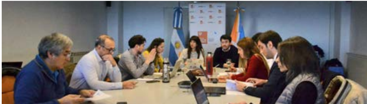
Durante el encuentro se revisaron las gestiones de acreditación de las empresas radicadas en el ámbito del Subrégimen de Promoción Industrial, con el fin de dar continuidad a los trámites de exportación.

Por otra parte, la Unión Industrial Fueguina (UIF) comunicó a los miembros de la CAAE, la presentación de una nota formal ante el Subsecretario de Gestión Productiva,