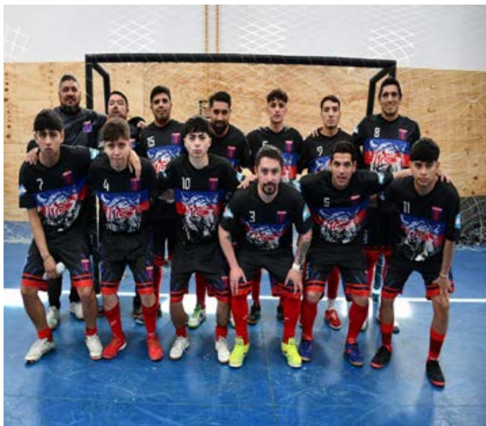
El equipo de Tigre, categoría primera división.