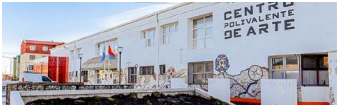
En Río Grande, el Centro Polivalente de Arte volvió a suspender actividades por falta de calefacción.