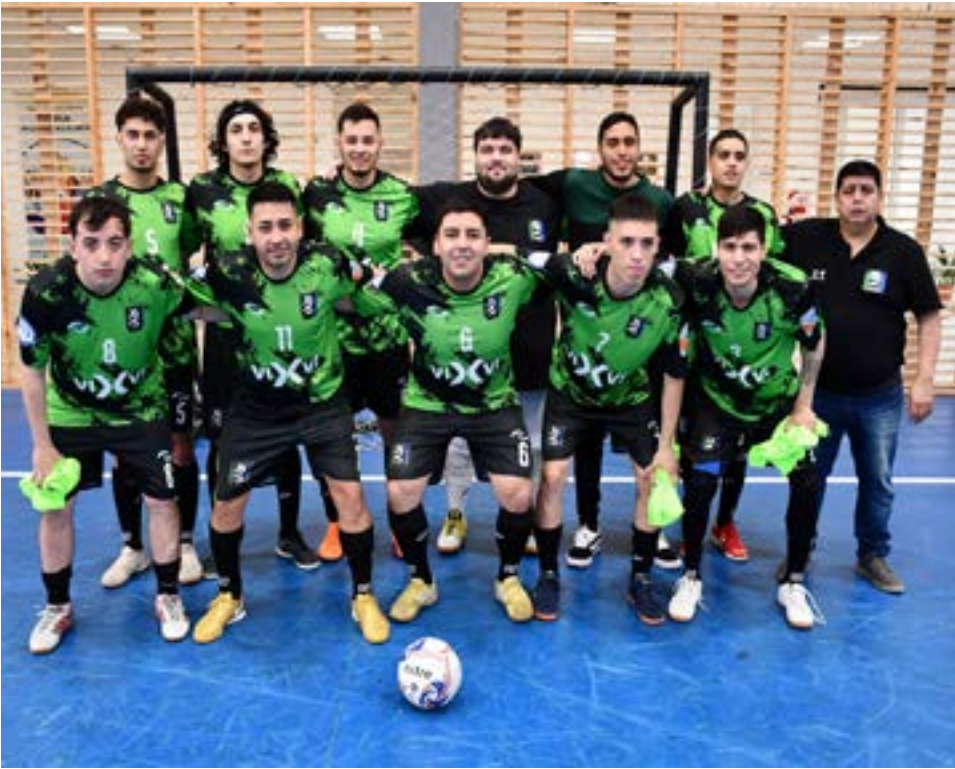
El equipo del club C3ndor FC, categor3a primera divisi3n.

Partido 2 – categor3a C-17 – inicio: 11.40 horas O’Higgins 2 Santos SM 13 Partido 3 – categor3a C-20 – inicio: 13.20 horas Progreso/Petrolero 10 C3ndor FC 3 Partido 4 – categor3a C-20 – inicio: 15.00 horas Centenario 7 Petroleros 3