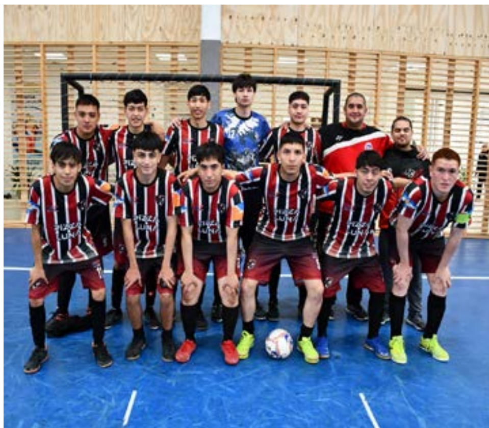
El equipo de Progreso/Petrolero, categoría primera división.