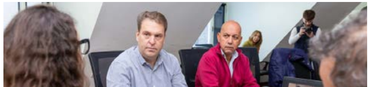
Se realizó una nueva sesión ordinaria del Comité de Evaluación del Seguimiento y Aplicación de la Convención contra la Tortura y otros tratos o Penas Cruels, Inhumanos o Degradantes.

Además, actualizaron la agenda de temas pendientes, entre ellos diferentes situaciones que atraviesan a las