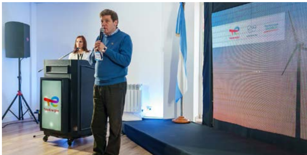
El Gobernador sostuvo que “para nosotros es un día de alegría, porque marca el comienzo hacia la transición energética que es tan importante en nuestra provincia, sobre todo por los recursos que tenemos”.

Asimismo, el mandatario recalcó que “este anuncio de hoy es muy significativo, este es el camino. Y es importante también porque se trata de una inver-