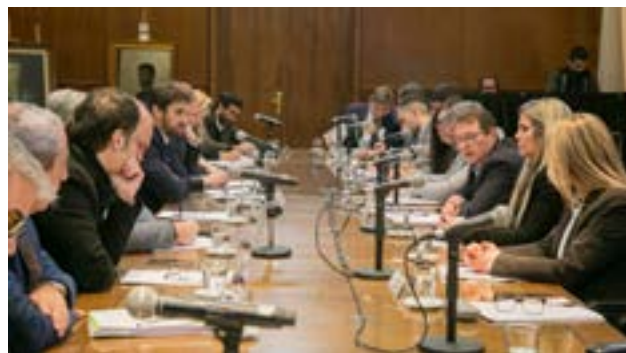
El Gobierno busca desactivar un foco de conflicto con los gobernadores.

Para lograrlo, el segundo artículo del proyecto contempla la eliminación de todos los fondos fiduciarios, de modo que el remanente se transfiera de manera directa a las 24 jurisdicciones del país. Además, la propuesta plantea modificar el criterio de distribución de los Aportes del Tesoro Nacional —conocidos de