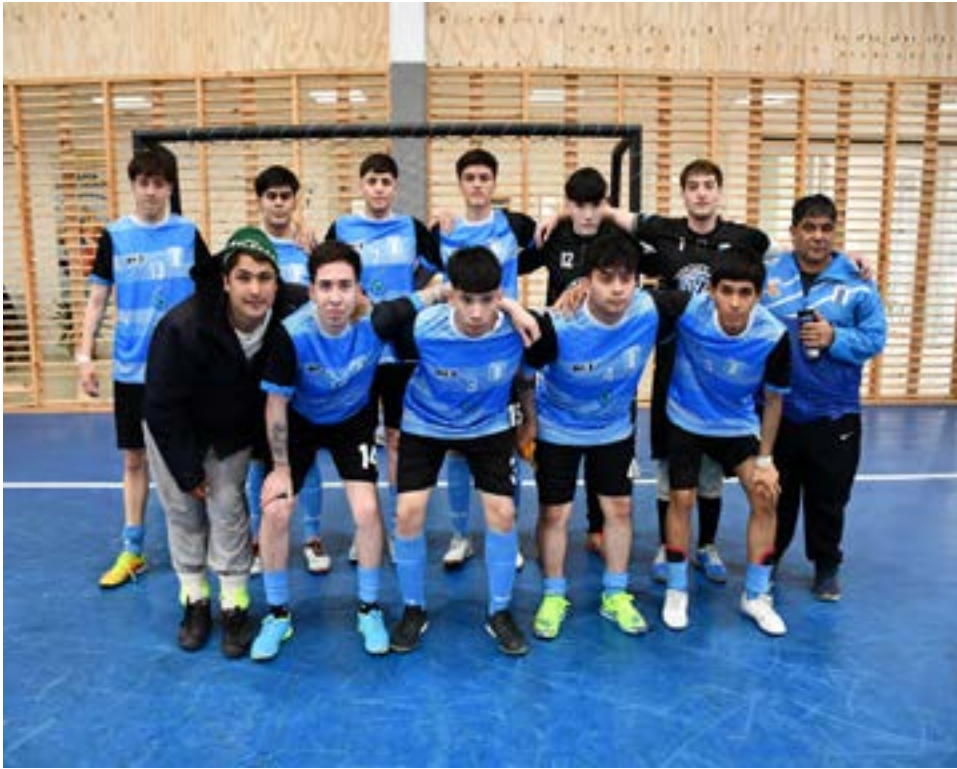
El equipo del club O’Higgins, categor3a primera divisi3n.

Partido 5 – categor3a Copa de Oro – inicio: 16.40 horas Centenario 2 C3ndor FC 10 Partido 6 – categor3a Divisi3n de Honor – inicio: 18.20 horas Hor-Val 2 San Mart3n 5 Partido 7 – categor3a Divisi3n de Honor – inicio: 20.00 horas Real Madrid 5 Santos SM 5 Gimnasio Sportivo Partido 8 – categor3a C-9 – inicio: 10.00 horas Tigre 6 Real Madrid 2 Partido 9 – categor3a C-9 – inicio: 11.00 horas QRU 7 Sportivo Albo 2 Partido 10 – categor3a C-9 – inicio: 12.00 horas Santos SM 1 Club Lion 5 Partido 11 – categor3a C-9 – inicio: 13.00 horas Sportivo 1 San Mart3n 3 Partido 12 – categor3a C-9 – inicio: 14.00 horas Centenario 0 Progreso/Petrolero 6 Partido 13 – categor3a C-11 – inicio: 15.00 horas