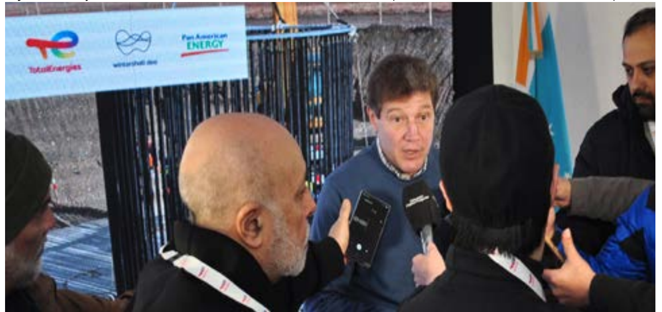
El gobernador Gustavo Melella, en rueda de prensa, defendió la ley de financiamiento presentada por el SUTEF, que prevé aumentar impuestos para pagar aumentos salariales.

Consultado acerca de cuál sería la medida para garantizar que los chicos estén en las aulas, respondió