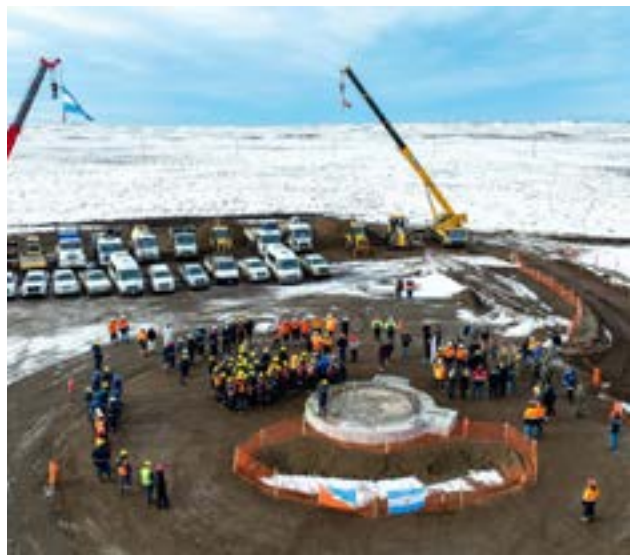
El Gobernador Gustavo Melella participó este martes del anuncio realizado por Total Energies, en conjunto con Wintershall y Pan American Energy, vinculado con la etapa final del desarrollo del parque eólico más austral del mundo.

“Este es el parque eólico más austral del mundo, pero el primero en nuestra provincia, que da ini-