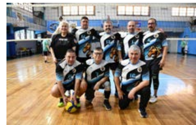
El equipo de Indomables, Río Grande.