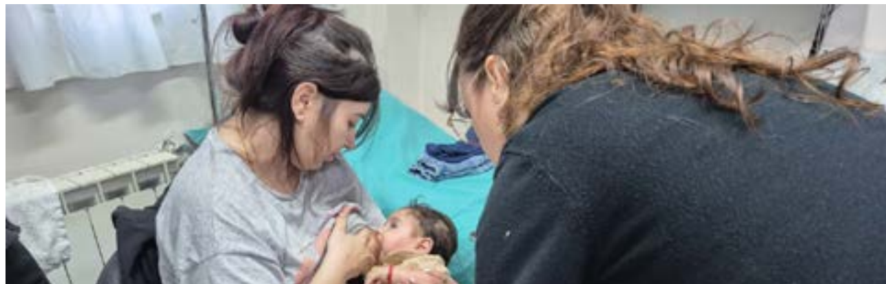
Las vacunas que forman parte del calendario nacional se pueden aplicar de forma gratuita en cualquier vacunatorio de la provincia.

una serología IgG positiva. Se desaconseja el viaje si no cuentan con antecedentes comprobables de vacunación ni anticuerpos contra el virus.