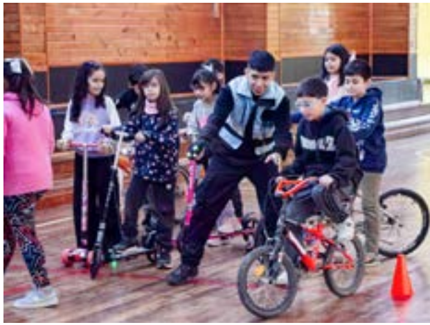
La “Expo Vial RGA Más Segura” en familia tendrá lugar este sábado 5 de julio, de 11 a 19 horas, en el Gimnasio Margen Sur con entrada libre y gratuita.

Ferro explicó que esta actividad se suma a las tareas