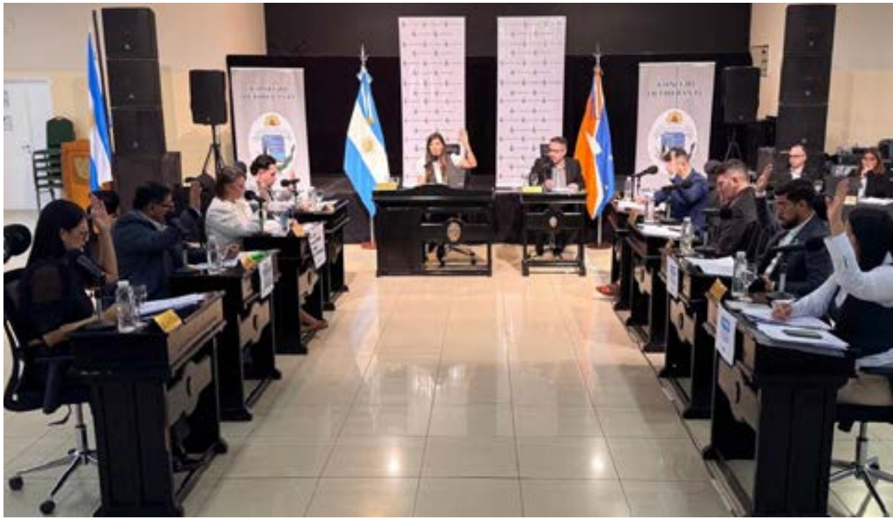
Este jueves los Concejales llevaron adelante la V Sesión Ordinaria en la cual pusieron a consideración una variada cantidad de proyectos impulsados desde los distintos Bloques que integran el Cuerpo de Concejales como así también por el Departamento Ejecutivo Municipal.