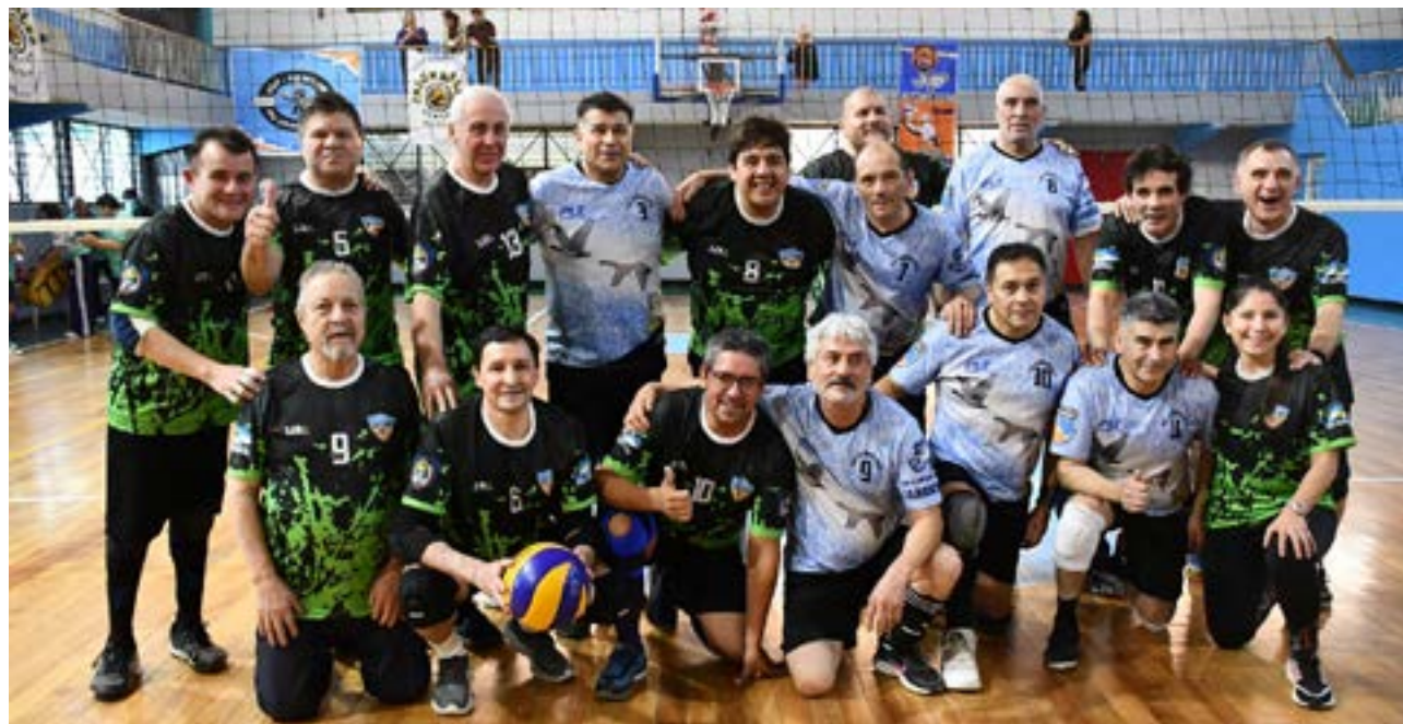
Los equipos de Pioneros (Tolhuin) y Los Cauquenes (Río Grande).