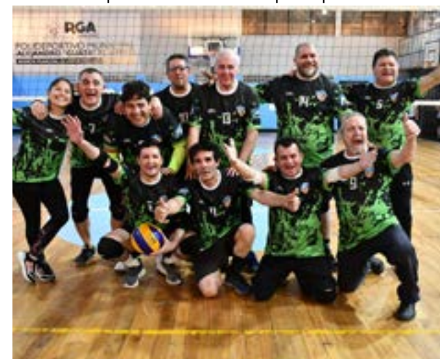
El equipo de Pioneros, Tolhuin.

Reflexiones sobre el deporte y la vida sana, especial-