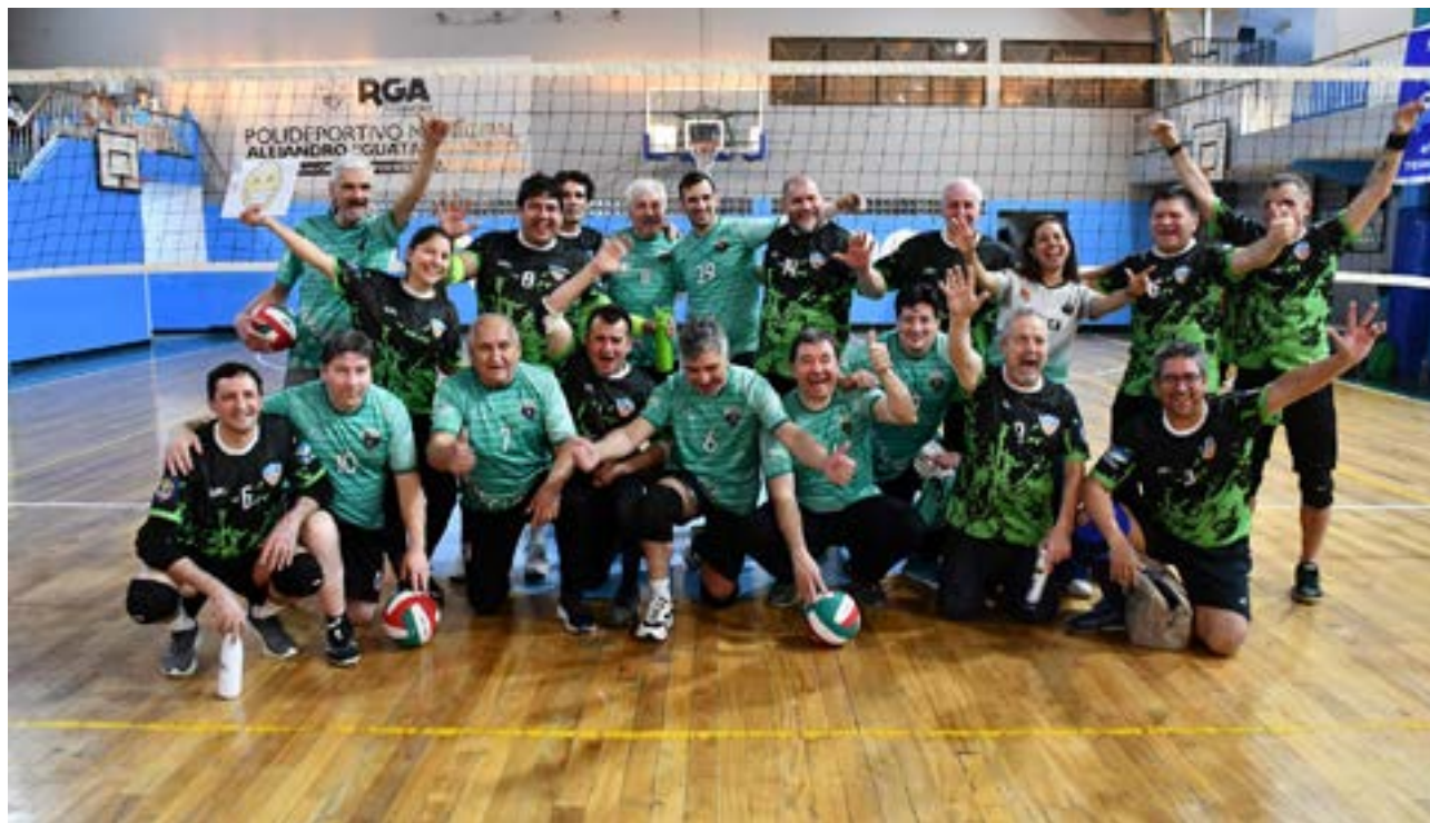
Los equipos de Hain y Pioneros de la ciudad de Tolhuin.

Newcom donde participan activamente y con mucho entusiasmo las y los adultos mayores en las categorías +50 y +60, y convencido de que estas lindas acciones participativas han cobrado gran relevancia en la Patagonia sur/sur.