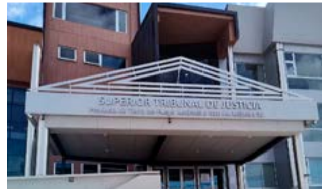
El Superior Tribunal de Justicia implementa de manera paulatina el ingreso de personas con discapacidad.

mismos derechos y estarán sujetas a las mismas obligaciones que la legislación laboral prevé para un trabajador común".