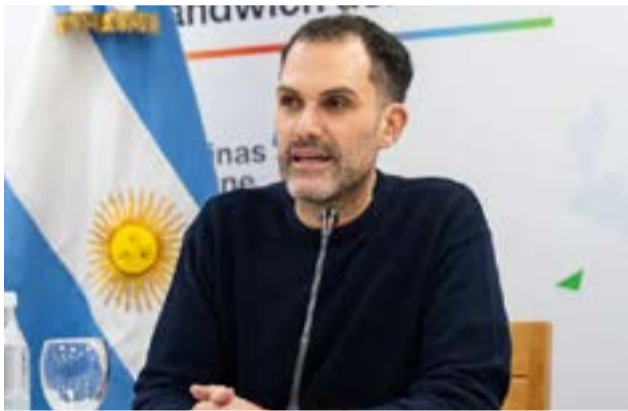
El ministro de Economía, Francisco Devita, informó sobre la aprobación del programa de Letras por parte del Banco Central el pasado jueves, que permite que los bancos privados puedan realizar sus inversiones.

Río Grande. - El ministro de Economía, Francisco Devita, informó sobre la aprobación del programa de Letras por parte del Banco Central el pasado jueves, que permite que los bancos privados puedan realizar sus inversiones. Por FM Master's dio a conocer los términos de la reunión en el marco del Consejo de Responsabilidad Fiscal, "que compartimos en forma trimestral con los Ministros de Economía de las provincias y un representante siempre