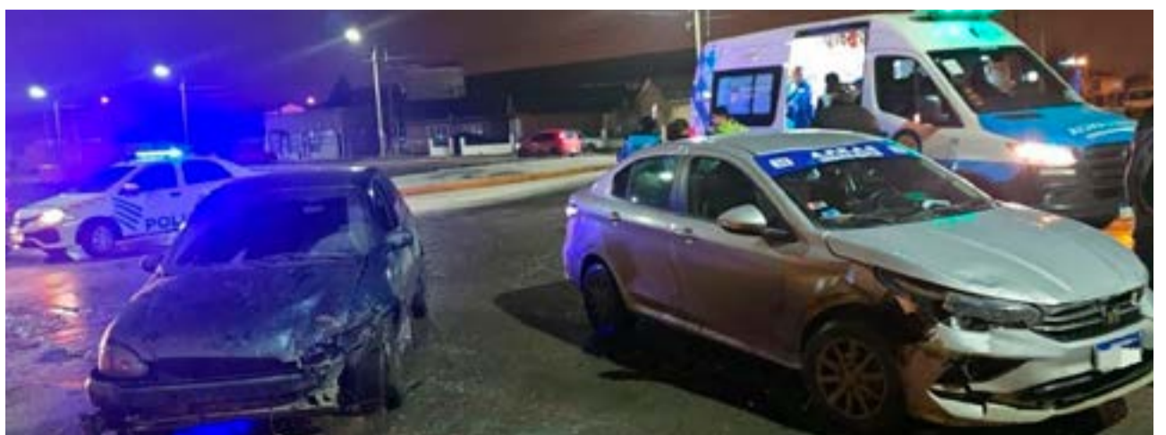
Conductor en estado de ebriedad protagonizó choque en inmediaciones de las arterias Belgrano y Almagro.

Se instruyen las actuaciones correspondientes.