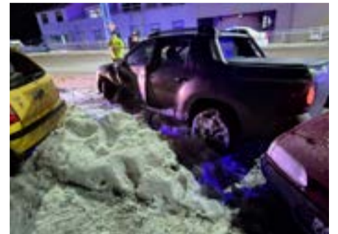
Conductor en estado de ebriedad chocó a dos rodados estacionados sobre avenida Alem al 2300 de Ushuaia.

Se labraron las actuaciones correspondientes.