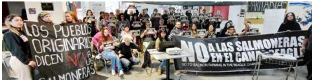
El hall de la sede Río Grande de la UNTDF se vio colmado este sábado por la tarde, con quienes concurrieron a la convocatoria del Centro de Estudiantes de la universidad y el Colectivo "No Salmoneras".

tuvimos junto a la Comunidad Costera de TdF AeIAS, el Colectivo No Salmoneras, e invitades de distintos sectores compartiendo saberes y opiniones respecto a la defensa de Ley 1355, la licencia social y las formas de producir que imponen modelos extractivistas