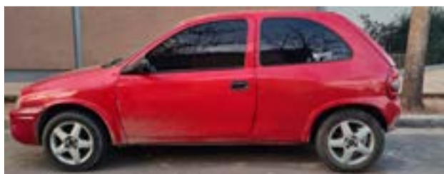
Interceptaron en Santa Rosa, La Pampa, un vehículo sospechoso y los ocupantes son de Río Grande.

Alrededor de las 04:15 horas, la oficina de CeCOM solicitó la presencia policial debido al avistamiento de un Chevrolet Corsa de tres puertas en actitud sospechosa. Inmediatamente, un móvil policial se dirigió al lugar y los agentes observaron el rodado en la intersección de Av. Illia y Circunvalación, mientras se retiraba en dirección de Norte a Sur por Circunvalación. Rápidamente, el vehículo fue interceptado en la esquina de Av. Circunvalación y