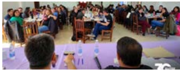
Se desarrolló un congreso provincial de delegadas y delegados de manera virtual, donde se abordó la reunión realizada -en el marco del paro provincial docente- entre representantes de SUTEF y autoridades del gobierno.

El SUTEF entiende que ese proyecto de ley "establece mecanismos precisos y justos de recaudación, aplicables a sectores que hoy se benefician del modelo económico vigente y propone los siguientes pilares fundamentales: la transformación educativa, inversión en infraestructura, salario docente y mochila educativa".