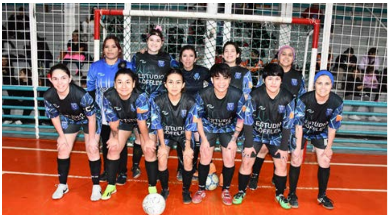
El equipo de A.A.T.E.D.Y.C., primera división "A".

sibilidad a nuestras actividades y logros, y para inspirar a más chicas a unirse a este hermoso deporte. La difusión de nuestras historias y experiencias es clave para seguir creciendo y moti-