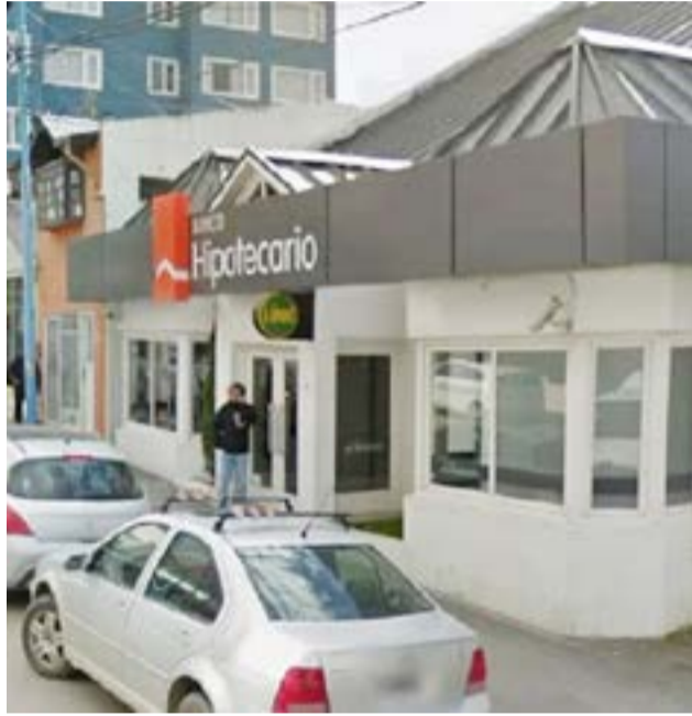
Entidades bancarias incumplieron sus deberes y deberán indemnizar a los clientes en Ushuaia.

Usuarios bancarios fueron víctimas de maniobras fraudulentas: les vaciaron las cuentas y a uno de ellos le efectuaron la aprobación de un préstamo a su nombre. El Juzgado en lo Civil y Comercial 2 de Ushuaia, ordenó a los bancos a restituir el dinero y pagar indemnizaciones, y en uno de los casos anuló el crédito que se tomó en nombre del usuario. El fallo advierte sobre los deberes que las entidades financieras tienen para proteger a sus clientes.