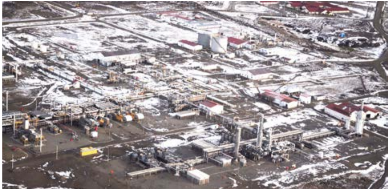
Sosa planteó que la preocupación del gremio pasa por los trabajadores que puedan quedar despedidos y tomó distancia de los arreglos que puedan hacer individualmente.

"Los trabajadores tienen que estar seguros, porque YPF no se va y se va a tener que hacer cargo de todo el daño que hizo en el país y en la provincia en par-