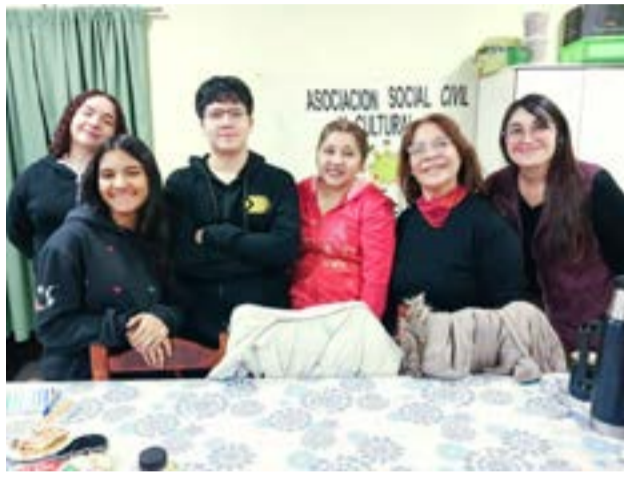
Durante la matiné, se recolectaron diversos insumos con el objetivo de ser donados a la Asociación Civil, Social y Cultural "Niños Felices".