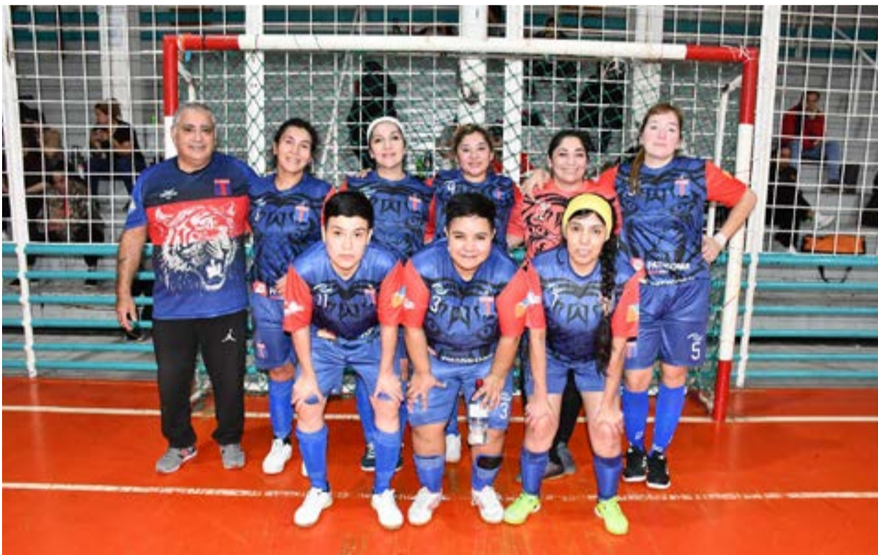
El equipo de Deportivo Tigre, primera división "A".