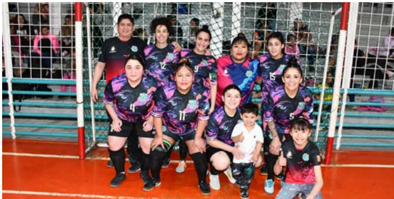
El equipo de Tercer Tiempo, primera división "A".

vando a futuras generaciones. En resumen, el crecimiento del fútbol femenino