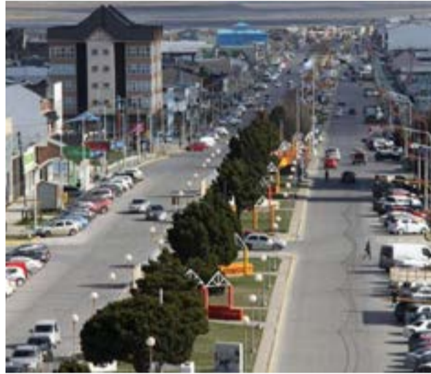
En el marco del 104° aniversario de Río Grande, la Dirección de Turismo presentó una serie de actividades pensadas para vecinos y visitantes.

Además, el sábado 19 se realizará un circuito histórico por la zona sur. "Vamos a contar cómo nació la colo-