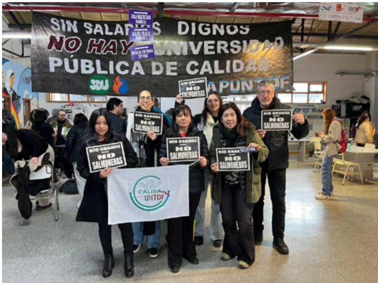
Desde la Cátedra Libre Soberanía Alimentaria, que funciona en el ámbito de la UNTDF, se refirieron a los proyectos para reformar la Ley 1355, que prohíbe la salmonicultura en el Canal de Beagle, ríos y lagos de la provincia.

Para terminar, señalando: “Exigimos el goce del derecho humano a la alimentación saludable y adecuada, a elegir como comunidad fueguina qué alimentos queremos producir, quién lo va a producir, dónde lo vamos a producir y cómo lo queremos comercializar. No a la salmonicultura, ni en mar, ni en tierra”, concluye el texto de la Cátedra Libre Soberanía Alimentaria.