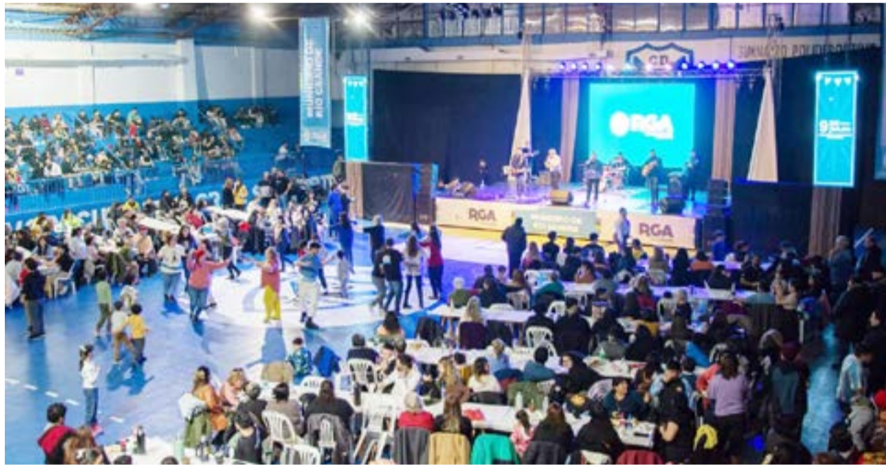
La jornada de festejos comenzará a las 12 horas, en el Club San Martín, con una celebración artística para seguir construyendo identidad riograndense. Se presentarán talleres municipales, instituciones educativas y artistas de la ciudad, con diversos números de danza y música.

De esta manera, Río Grande se prepara para recibir su 104° Aniversario junto a cada vecino y vecina que elige esta tierra como su hogar para toda la vida.