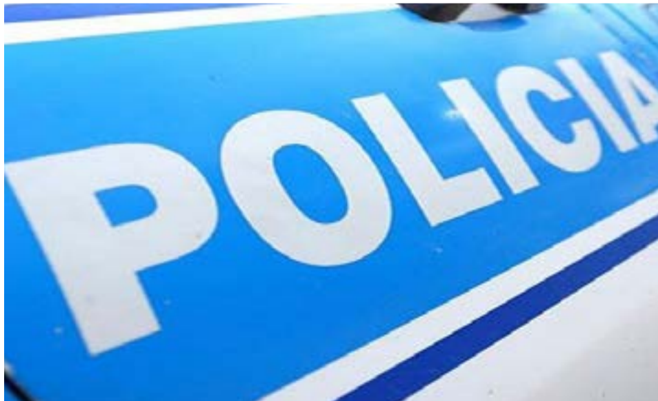
Un hombre fue aprehendido por tentativa de robo.

nes. A partir de la información proporcionada por un testigo, se logró ubicar