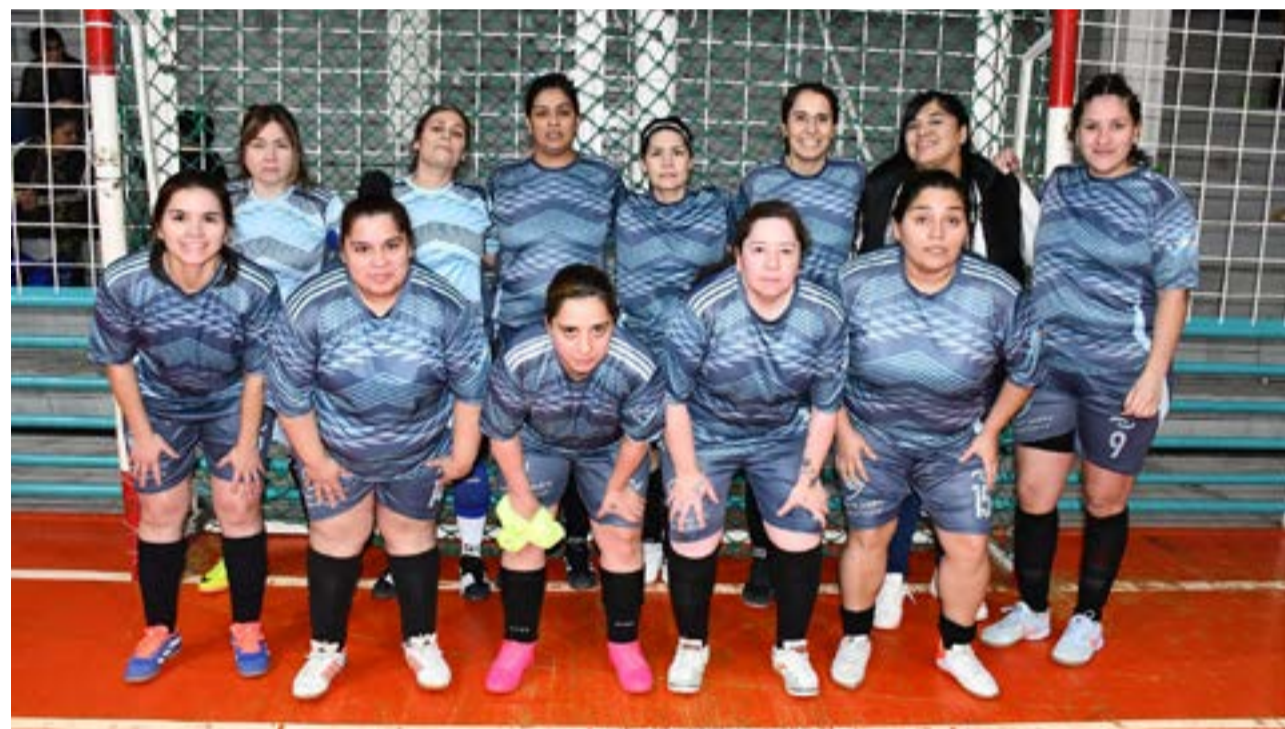
El equipo de Fusión "A", primera división "A".