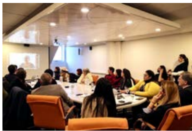
La capacitación estuvo destinada a funcionarios del Gobierno de la Provincia en un primer encuentro y a profesionales del ámbito jurídico en una segunda instancia con la colaboración del Poder Judicial y el Colegio Público de Abogados de Ushuaia (CPAU).

Río Grande. -La misma estuvo destinada a funcionarios del Gobierno de la Provincia en un primer encuentro y a profesionales del ámbito jurídico en una segunda instancia con la colaboración del Poder Judicial y el Colegio Público de Abogados de Ushuaia (CPAU).