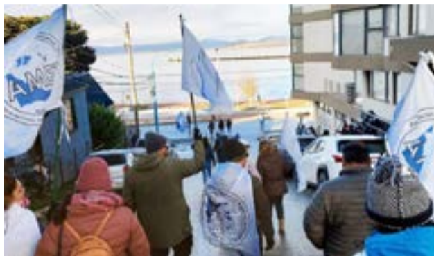
La Regional Tierra del Fuego de la Asociación del Magisterio de Enseñanza Técnica (AMET) presentó un proyecto de Ley Provincial de Financiamiento Educativo.

"Queremos una herramienta que fortalezca la educación pública con equidad y control social", resaltó el gremio de docentes técnicos fueguinos.