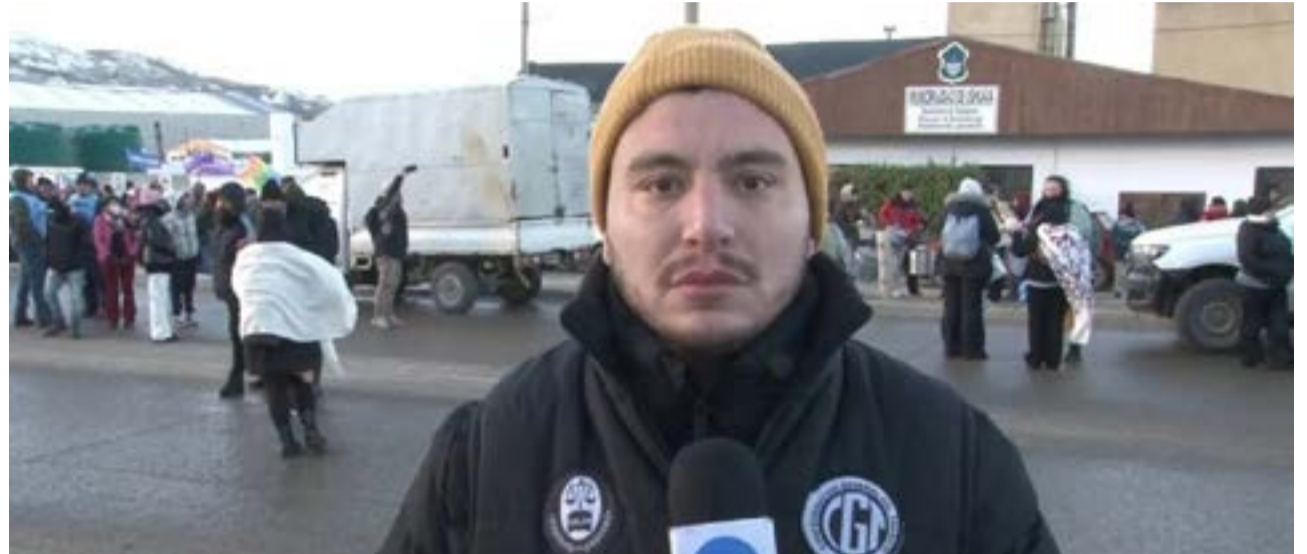
El representante de la conducción nacional de la Unión Empleados de Justicia de la Nación en la provincia, se refirió al plan de lucha que vienen desarrollando y también a la situación dentro del Poder Judicial.

culadas al reglamento interno de la justicia”. “En el caso de que tengan que cursar un sumario