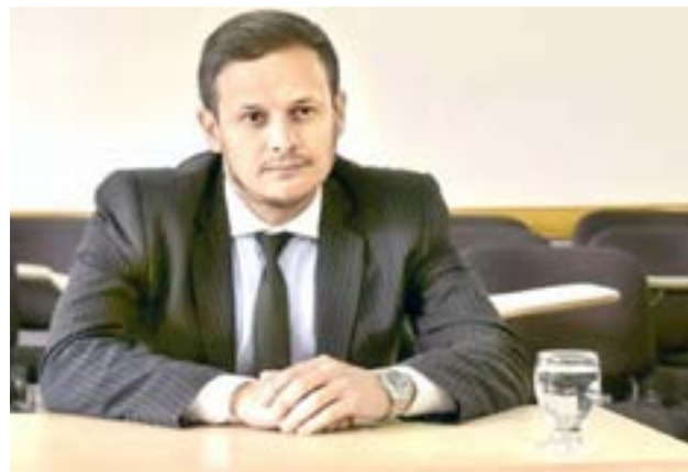
Robaron material probatorio en la causa que investiga al juez Andrés Leonelli por tenencia de material de abuso sexual infanto-adolescente.

Vale mencionar que, además, Ramonet señaló durante su informe que la jueza Barrionuevo habría expresado que el hecho se investigará "después de la feria".