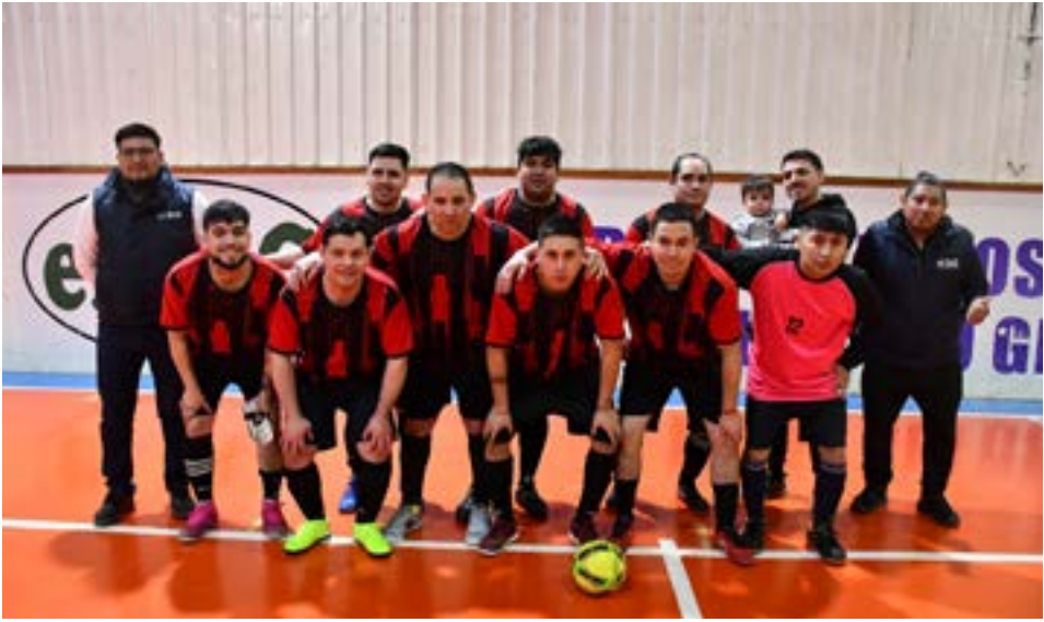
El equipo de El Príncipe, categoría libre.

Por el día del amigo en el Microestadio Cochocho Vargas