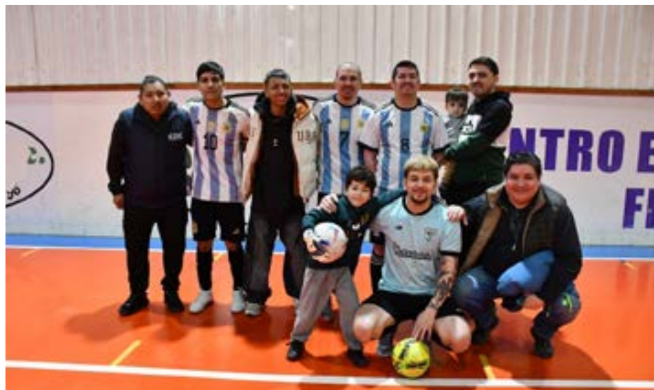
El equipo de Hiper FC, categoría libre.

que todo funcione correctamente", comentó. La dedicación de este equipo ha sido fundamental para el éxito del torneo.