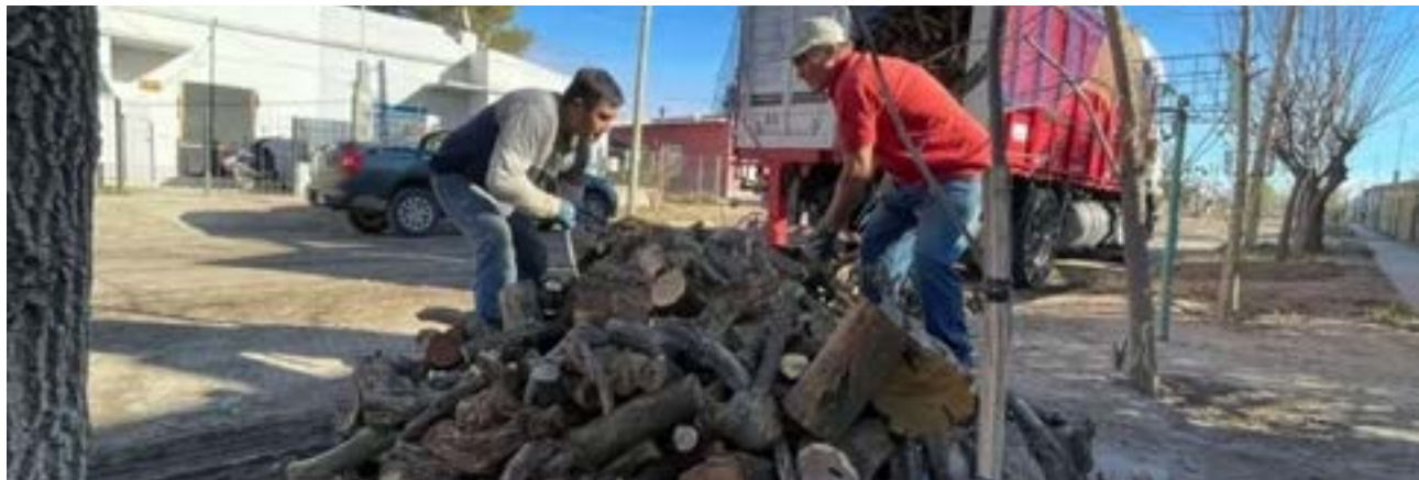
El programa Calor Mayor distribuye insumos para calefacción en diez provincias.

acercarse a la agencia de PAMI más cercana o comunicarse al 138, la línea de atención “PAMI Escucha y Responde”.