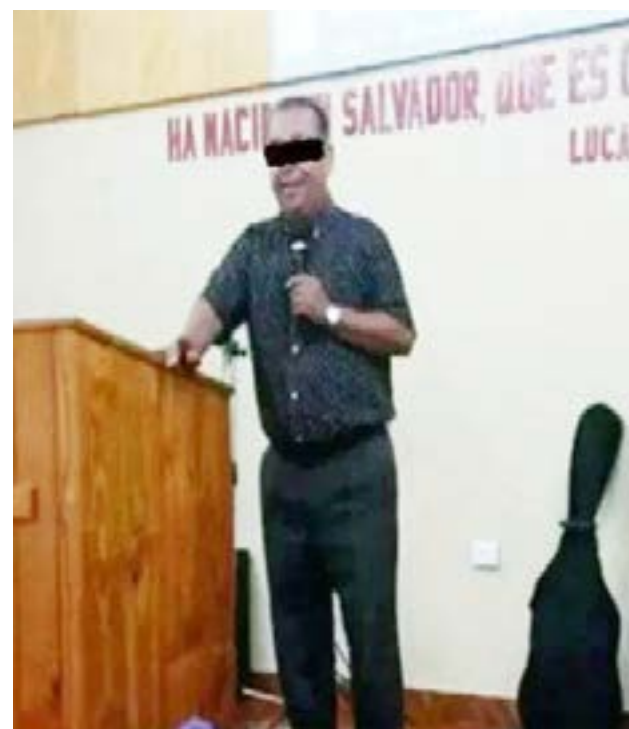
Pastor evangélico de Ushuaia llegará a juicio en Santa Cruz acusado de abuso sexual que data de hace 11 años atrás.