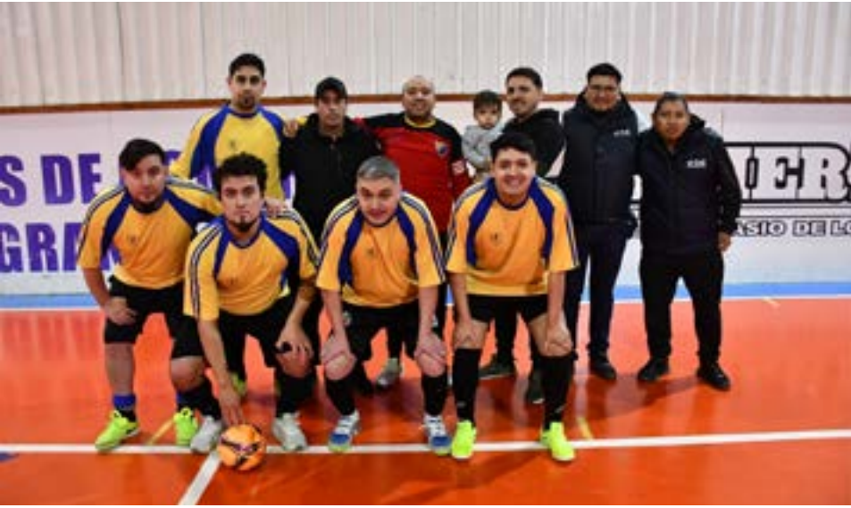
El equipo de El Rejunte FC, categoría libre.