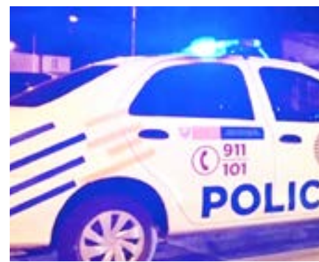
Tres hombres fueron detenidos por amenazar a una empleada de panadería e intentar sustraer bebidas alcohólicas.

recuperados fueron devueltos al comercio, y se están llevando a cabo las actuaciones correspondientes.