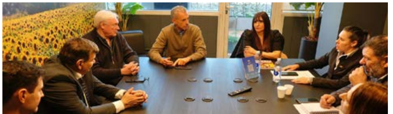
El encuentro reunió a ministros y autoridades de Producción, Agricultura y Ganadería de Santa Cruz, Chubut, Río Negro y Neuquén, y reviste especial importancia para el tratamiento conjunto de temas vinculados al fortalecimiento sanitario, productivo y comercial de la región.

En ese marco, la ministra Fernández fue categórica y expresó que "esta medida representa un grave perjuicio