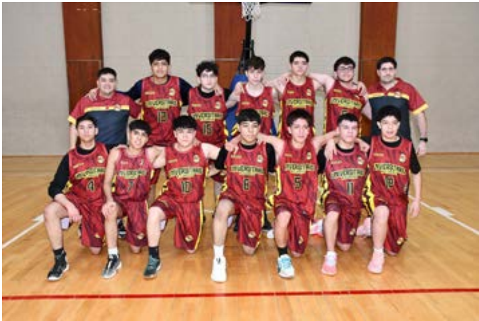
El equipo del Club Universitario, categoría U15.