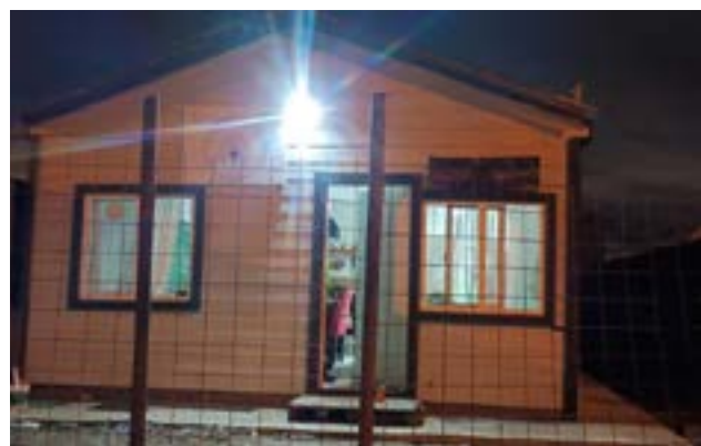
Un hombre fue aprehendido por intentar robar en un centro de jubilados ubicado en pasaje Rivarola al 1000.

simas del predio estaba en el suelo y una bolsa con varios elementos en el interior del establecimiento. Tras notificar al fiscal de