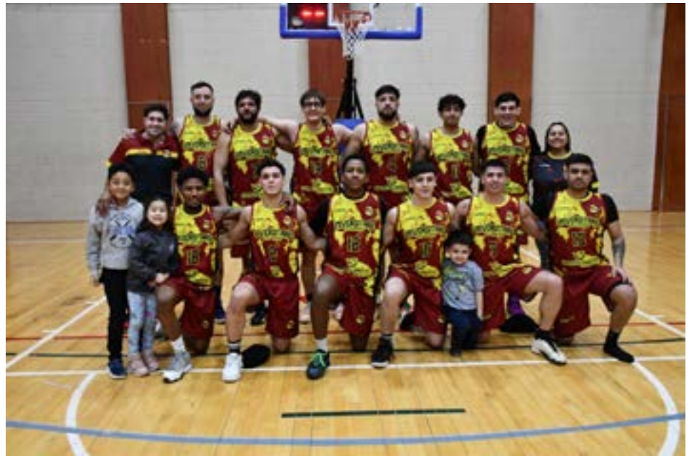
El equipo del Club Universitario, categoría Mayores.