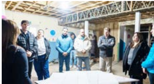
El espacio tendrá sede en el antiguo Jardín Maternal "Bichito de Luz", ubicado en la calle Piedrabuena de la ciudad de Río Grande y se centra en el abordaje interdisciplinario en materia de salud mental.

más severas, cuadros psiquiátricos más graves, entrelazado con lo social y con lo cultural".