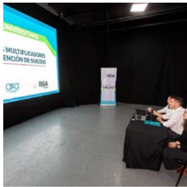
La capacitación contó con la presencia de reconocidos profesionales que compartieron herramientas para el abordaje comunitario y preventivo de esta problemática compleja.

Río Grande. -Con una participación que superó las 2500 personas en toda la provincia, se llevó adelante