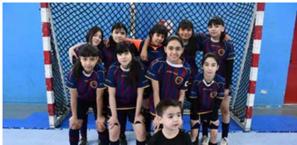
El equipo del Club Municipal, 5ta división femenina.