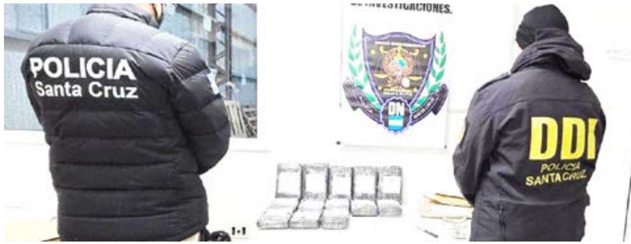
Camionero que fue detenido con 15 kilos de cocaína en Santa Cruz y tenía como destino Tierra del Fuego, viajaba consumiendo y armado.

terado producto del consumo de drogas. El destino final del viaje era la provincia de Tierra del Fuego, lo que refuerza la hipótesis de que ese era el punto de