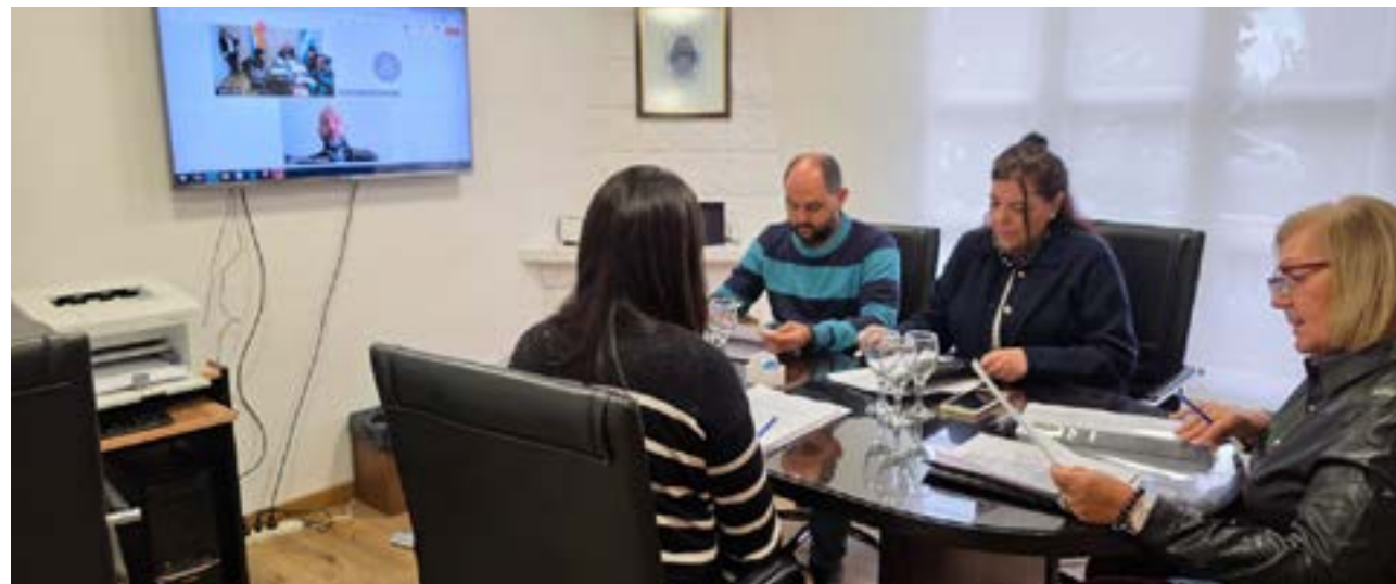
Más de un mes después el Consejo de la Magistratura pide información a la Fiscalía y al Juzgado sobre la existencia de un proceso penal.

El texto de la Ley 525, de Enjuiciamiento de Magistrados y Funcionarios del Ministerio Público del Poder Judicial, en su articulado 4º, expresa: "La autoridad que hubiese intervenido en la recepción de una denuncia o investigación de un hecho presumiblemente delictivo, cometido por un magistrado o funcionario del Ministerio Público, deberá poner ese hecho en conocimiento inmediato del Consejo de la Magistratura, sin perjuicio de la intervención que debe otorgarse al