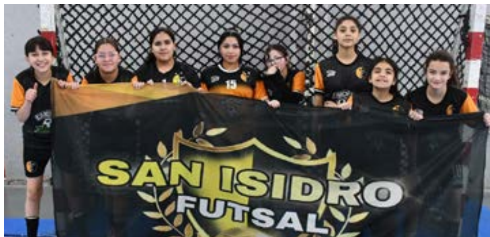
El equipo del Club San Isidro, 5ta división femenina.