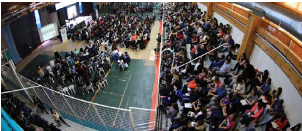
El Congreso abordará los principales desafíos actuales del ámbito educativo y propondrá herramientas innovadoras para fortalecer las prácticas de enseñanza, promoviendo cambios significativos en las experiencias de aprendizaje dentro del aula.

A través de esta iniciativa, el Municipio de Río Grande reafirma su compromiso con la mejora continua del sistema educativo local, generando espacios de capacitación y acompañamiento para quienes tienen en sus manos la valiosa tarea de enseñar.