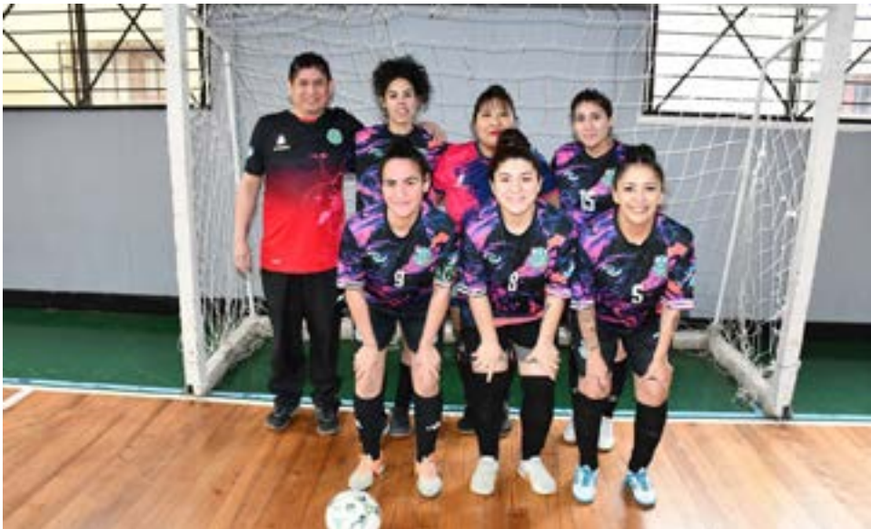
El equipo de Tercer Tiempo, primera división “A”.