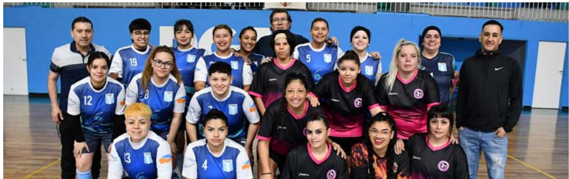
Los equipos de O'Higgins vs. Ollympic FC, (amistoso).

Las expectativas son altas para las semifinales, ya que