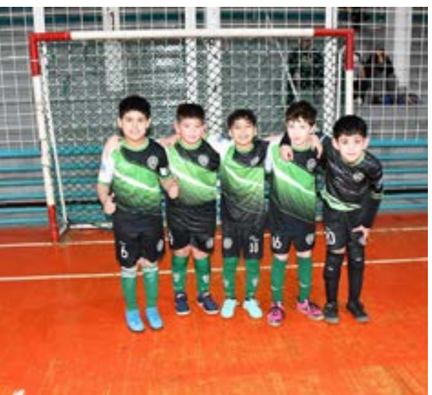
El equipo de QRU, categoría C9.

Con el crecimiento y desarrollo que ha experimentado el fútbol de salón en Río Grande, la ciudad se posiciona nuevamente como la cuna del Futsal.