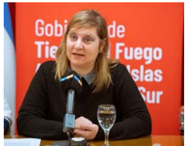
La ministra de Salud Judit Di Giglio expuso el panorama de la salud pública en un contexto de crisis y aseguró que "cada vez son más las personas que no tienen obra social".

ce el sistema de salud, crece para toda la población si toda la población tiene acceso, y eso sucede en nuestra provincia: todos tienen acceso tanto al público como al privado. Siempre el Estado va a estar presente en aquellas prácticas que son menos rentables y esa es una realidad que no va a cambiar. Hay que aprender a complementar y optimizar, y el camino es la integración. Hay una revolución en el conocimiento, hay un cambio en las profesiones, en la formación, cada vez se