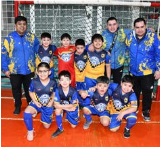
El equipo de Real Madrid, categoría C9.

rentes eventos a nivel patagónico y nacional. Este éxito no solo refleja el talento de los jugadores, sino también el arduo trabajo de entrenadores y