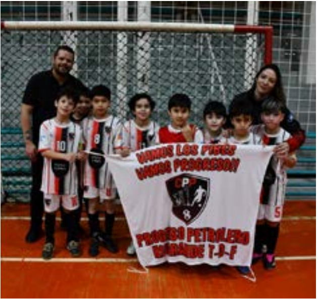
El equipo de Progreso, categoría C9.

gadores El apoyo de las familias no solo se traduce en asistencia a los partidos, sino también en la creación de una cultura de aliento y camaradería. Este ambiente ha sido fundamental para el desarrollo de los jóvenes, quienes se sienten respaldados en su esfuerzo por mejorar y competir a un alto nivel. Río Grande ya es la cuna del futsal (CAFS)