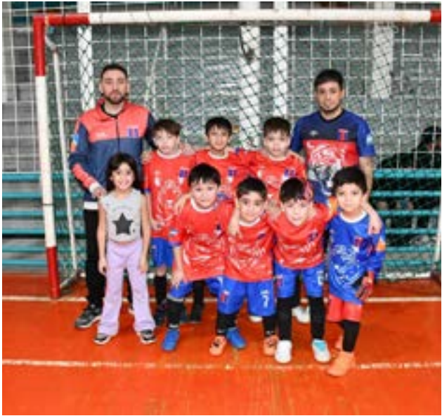
El equipo de Deportivo Tigre, categoría C9.

de la programación de los partidos hasta la disponibilidad de los espacios deportivos. Este esfuerzo conjunto es un testimonio del compromiso de la federación y de los clubes para ofrecer un torneo de calidad. Éxito de las selecciones de Río Grande Pablo Pabliski también destacó la impecable participación de las selecciones de Río Grande en dife-