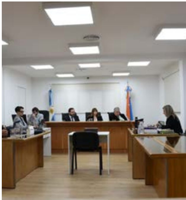
Fiscalía y Defensa pidieron 3 años de prisión en suspenso para sujeto que le desfiguró el rostro a su pareja.