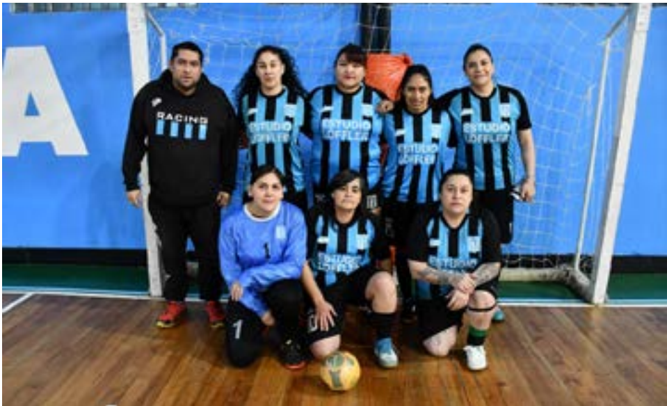
El equipo de Racing RG, primera división “A”.