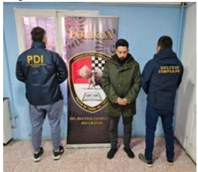
Prófugo en una causa por abuso en Mendoza fue detenido en Río Grande.

Actualmente, el detenido está siendo trasladado a la provincia de Mendoza, donde quedará a disposición de la justicia de esa jurisdicción.