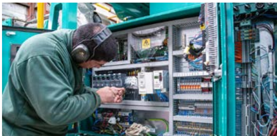
El Gobernador de provincia, Gustavo Melella, instruyó a la Dirección Provincial de Energía (DPE) a aplicar una bonificación en las próximas facturas del servicio eléctrico.

Desde el organismo provincial señalaron que se continúa trabajando con gran esfuerzo técnico y humano para restablecer completamente el servicio eléctrico en la ciudad. Además, destacaron que la incorporación del nuevo equipo permitirá mejorar la calidad del suministro y reducir el riesgo de futuras interrupciones. El Gobierno provincial remarcó su compromiso con los vecinos y vecinas de Tolhuin, asegurando que la bonificación será reflejada de forma clara en las facturas correspondientes, y que se mantendrán informados sobre los avances en la normalización del sistema energético local.