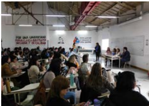
La Fiscalía de Género brindó una charla en la UNTDF sobre intervenciones en casos de violencia y abuso.