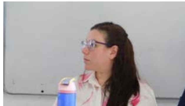
En el encuentro se remarcó la importancia de articular esfuerzos entre la Justicia, las instituciones educativas y los equipos interdisciplinarios para garantizar un abordaje integral y sensible de estas problemáticas.

cedirectores en la tarea de inclusión en el marco de la Resolución 2409/15 y promover espacios de trabajo colaborativo con los equipos que acompañan trayec-