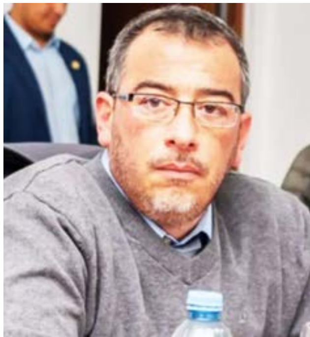
El secretario de Justicia y Derechos Ciudadanos Gonzalo Carrillo aseguró que "hay una migración histórica, continuada y estable, no hay un incremento tan generalizado como otros años".

Por último, explicó que "no se puede votar con el DNI Digital, para votar, siempre es con el último ejemplar emitido, no puede ser el anterior como tampoco se puede salir del país con el DNI Digital, aunque sí podés viajar desde el aeropuerto, siempre y cuando el destino sea local".