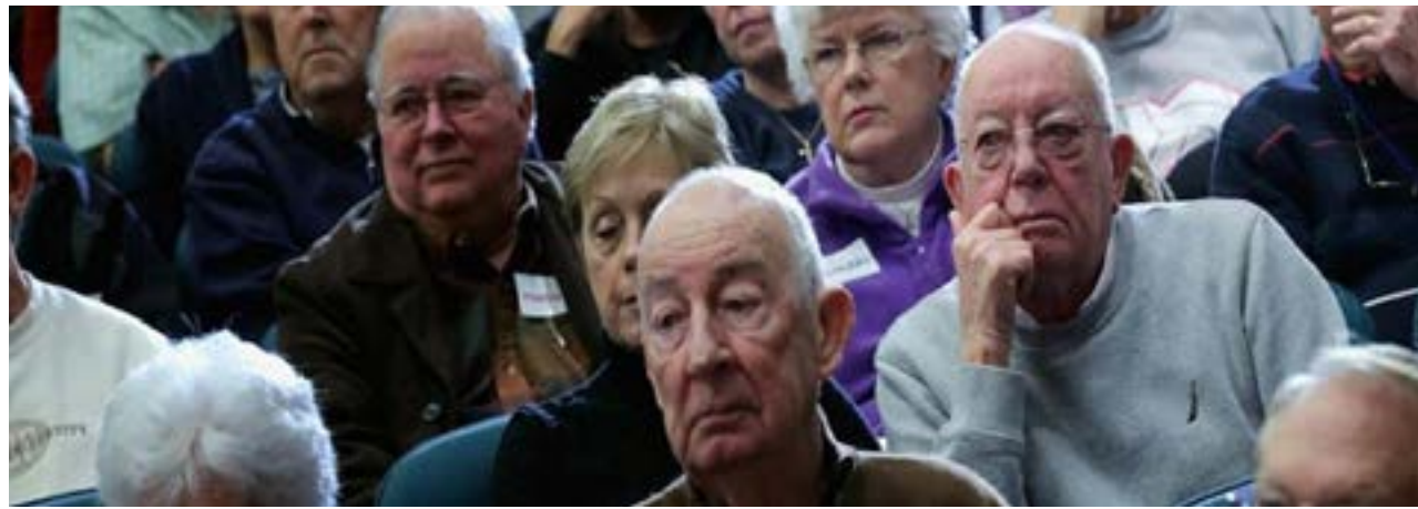
El impacto del veto de Milei en nuestra provincia, implica una caída mensual de $1.131 millones para más de 14 mil beneficiarios fueguinos.

A nivel país, el recorte proyectado asciende a más de $5,6 billones en un año, con un promedio mensual de $468.652 millones. Las provincias más perjudicadas en términos absolutos son Buenos Aires, Córdoba y Santa Fe, aunque en proporción, Tierra del Fuego se encuentra entre las más golpeadas.