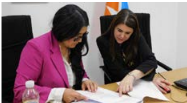
Profesionales del Poder Judicial publicarán en revista científica de Psicología Forense.

Las autoras remarcaron que su propuesta busca visibilizar la importancia de la psicología en el fortalecimiento del sistema de justicia, en tanto disciplina que contribuye a garantizar el acceso a derechos y a la Justicia.