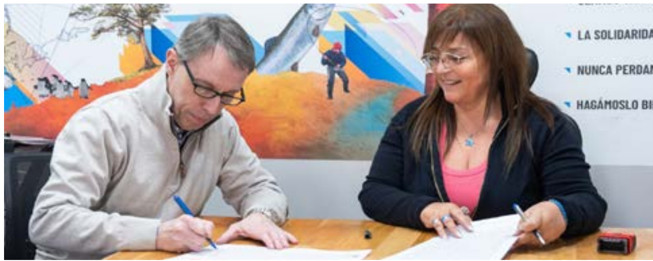
El objetivo de la obra es llevar electricidad a esa zona para trasladar allí el puesto de control policial una vez que el edificio esté acondicionado.

nacionales que forman parte del esquema de seguridad de la provincia y del país.