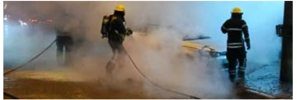
Investigan el incendio sobre un rodado en inmediaciones de avenida San Martín y Finocchio.

Se están investigando las causas del siniestro y se llevan a cabo las actuaciones correspondientes, bajo la intervención del Juzgado de Instrucción N.º 1 del Distrito Judicial Norte.