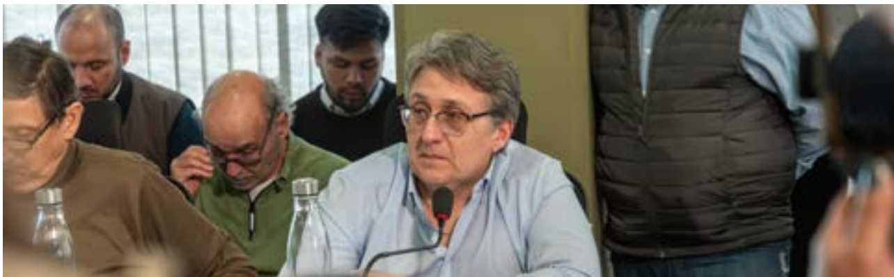
Espeche destacó que “la actividad turística es un pilar fundamental para el desarrollo económico local y no podemos restringir indebidamente a quienes prestan servicios de transporte cumpliendo con todos los requisitos de seguridad”.

a los trabajadores y prestadores del sector, quienes cumplen un rol esencial en la economía de Ushuaia.