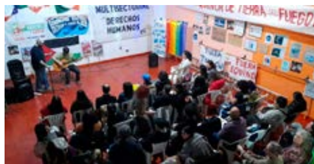
Este sábado, en el espacio donde supo funcionar el ex Dionisio Teatro, se concretó la "Velada Artivista" convocada por la Multisectorial de Derechos Humanos de Río Grande, la Asamblea Comunidad Costera de Tierra del Fuego AeIAS y la agrupación "Ambiente en Lucha".

Las instalaciones del ex "Dionisio Teatro" se vieron desbordadas en todo momento, con personas que iban circulando durante las cinco horas que duró la "Primera Velada Artivista", que se realizó en la