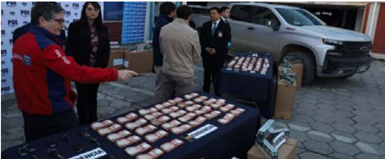
Punta Arenas: Desbaratan banda de 15 integrantes dedicada al contrabando de cigarrillos desde Argentina.

llegar al fondo y desentrañar a quienes estaban detrás de esta organización.