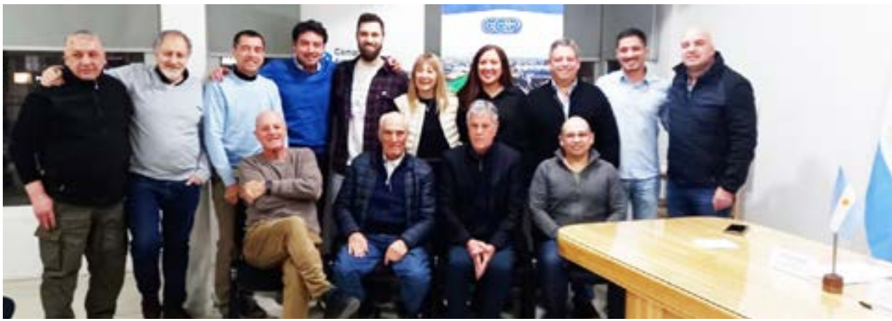
El pasado viernes se llevó a cabo la Asamblea General Ordinaria de la Cámara de Comercio de Río Grande con elecciones de autoridades periodo 2025-2027.