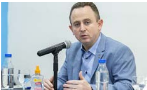
Díaz destacó que su primera iniciativa legislativa será la derogación del decreto 333, que eliminó los aranceles a los productos importados.

Díaz también planteó la urgencia de que el Gobierno envíe un presupuesto nacional realista, denunciando que