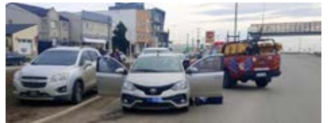
Conductora resultó lesionada en un choque ocurrido en inmediaciones de ruta nacional 3 y 20 de junio de Río Grande.

Finalmente, el personal de Tránsito Municipal realizó tests de alcoholemia a ambos conductores, arrojando resultados negativos en ambos casos.