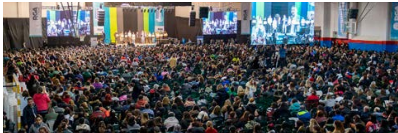
El Municipio de Río Grande, la Asociación de Psiquiatras de América Latina (APAL) y la Asociación de Psiquiatras de Argentina (APSA) llevarán adelante el 3º Congreso Internacional de Prevención de Suicidio.