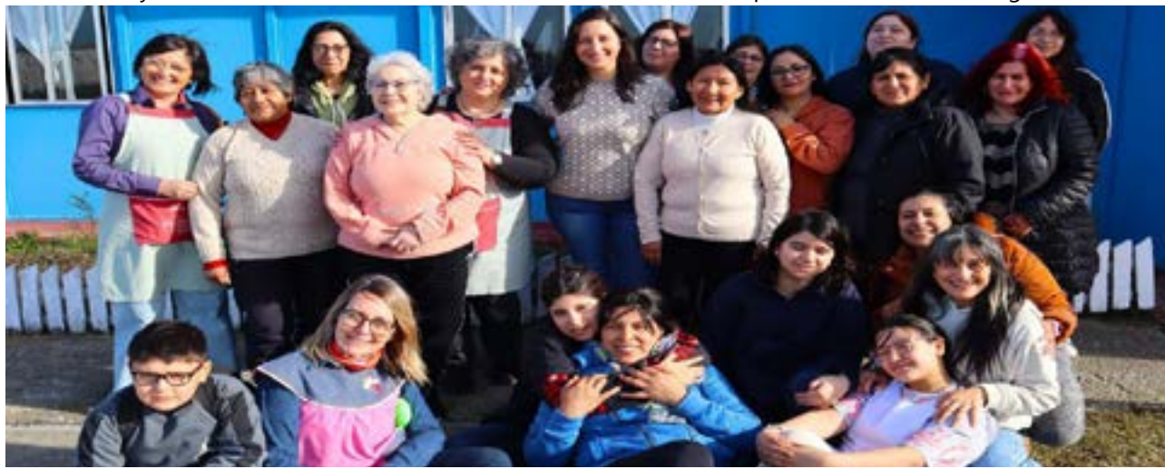
La propuesta fue organizada por el Municipio de Río Grande, a través de la Secretaría de Género y Desarrollo Comunitario, junto con la Subsecretaría de Cultura.

la educación y el trabajo conjunto, fortaleciendo los lazos que nos unen como riograndenses.