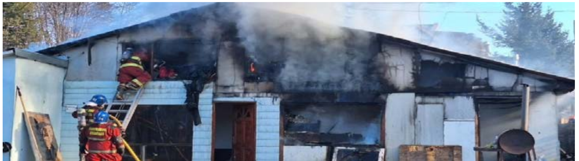
El siniestro afectó a una propiedad que estaba subdividida en tres módulos habitacionales tipo departamento.

En el operativo trabajaron dotaciones del Cuartel Central y del Destacamento Soto, junto a un equipo de 30 bomberos que lograron controlar las llamas con rapidez y eficacia, evitando que el fuego se propagara a viviendas linderas