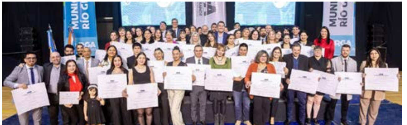
Estas propuestas formativas fueron posibles gracias al convenio entre el Municipio de Río Grande y la UNA, reafirmando la articulación institucional y el compromiso compartido con la educación pública, gratuita y de calidad.

Antes debíamos desplazarnos a Buenos Aires, con el enorme costo que esto implicaba. Gracias a este convenio pudimos estudiar desde nuestra provincia y profesionalizarnos en nuestras disciplinas. Fue un esfuerzo compartido, tanto de los profesores que viajaron a Río Grande como de nosotros, los estudiantes de Ushuaia que debíamos trasladarnos en condicio-