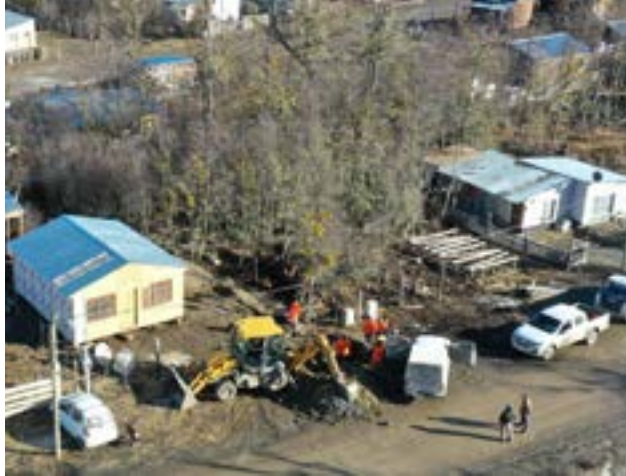
El Municipio de Tolhuin puso en marcha los trabajos de colaboración en las conexiones intralotes a la red de cloacas y agua potable de los vecinos del barrio Altos de la Montaña.

Tolhuin. -El Municipio de Tolhuin puso en marcha los trabajos de colaboración en las conexiones intralotes a la red de cloacas y agua potable de los vecinos del barrio Altos de la Montaña, con el objetivo de garantizar el acceso a servicios esenciales y mejorar las condi-