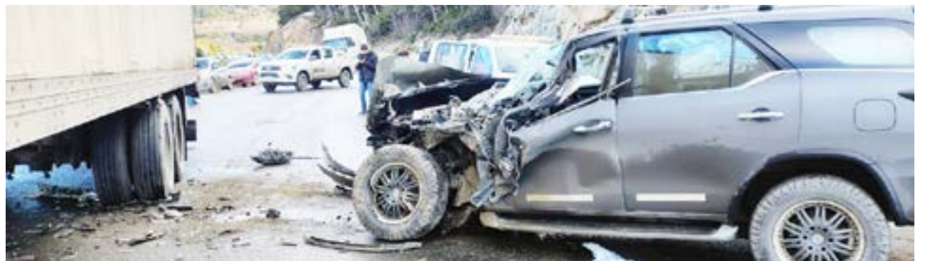
Tanto los ocupantes de la camioneta como del camión resultaron con lesiones de distinta magnitud.

La ruta 3 está cortada al tránsito para las pericias accidentológicas.