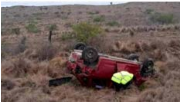
Murió una mujer de Tierra del Fuego en un vuelco en la ruta 10 de la localidad de Santa Isabel, La Pampa.

En su tarea, los agentes constataron que había una mujer mayor, de 55 años, fallecida en cercanías del vehículo porque, aparentemente, habría sido des-