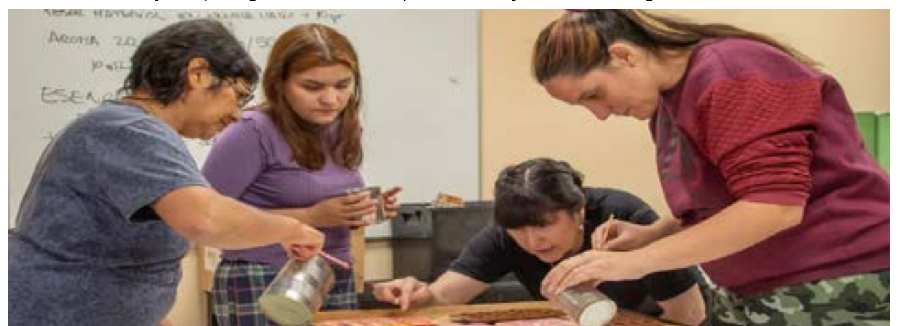
La Secretaría invita a todas las juventudes de la provincia a sumarse y ser protagonistas de estas propuestas, que son totalmente gratuitas y que buscan fortalecer el presente y futuro de la juventud fueguina.

Para más información, las y los interesados pueden comunicarse al WhatsApp 2964 413686 o escribir a somosjuventudestdf@gmail.com .