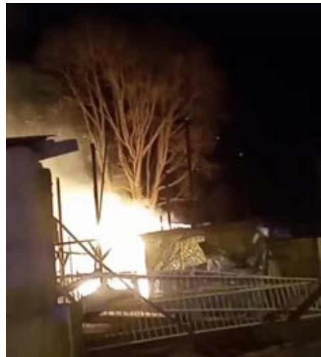
Tres hermanos fallecieron durante un incendio en el barrio Peniel de la ciudad de Ushuaia.

En cuanto al padre y la madre, los mismos permanecen hospitalizados y con serias quemaduras.