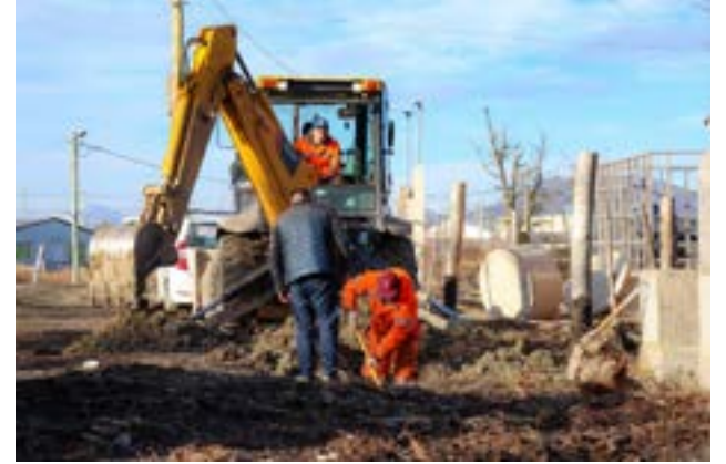
Previo al inicio de los trabajos, durante 15 días se realizaron relevamientos a cargo de la Dirección de Administración, orientados a la recopilación de datos, documentación y coordinación con las casi 100 viviendas del sector.