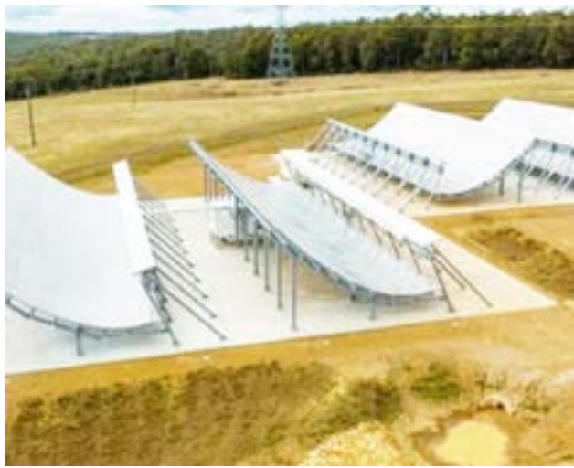
Esa demanda se ubica entre los pedidos que la gestión que encabeza Donald Trump ha realizado con insistencia en el último tiempo. A Estados Unidos también le interesa atracar algunos de sus submarinos nucleares en Ushuaia.

En Tierra del Fuego afirman que la posibilidad de que los submarinos estadounidenses operen desde ese distrito se corresponde con la idea norteamericana de consolidar su presencia militar en el Atlántico Sur y la Antártida. Y que ese precepto se ajusta a la estrategia de Donald Trump de reducir al mínimo la influencia de China en esta parte del mundo.