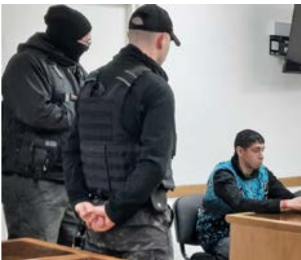
Sujeto que atacó a su expareja, la amenazó y le vació la cuenta bancaria declaró ante el Tribunal.