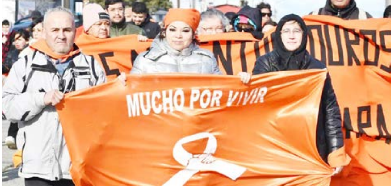
La Asociación "Mucho por Vivir", convoca el próximo domingo 14 a la cuarta edición de la "Marcha por la Vida" en la ciudad de Río Grande.

nivel provincia, falta mucho más. Sé que están abriendo de a poquito distintos dispositivos, pero hace falta mucha contención y sobre todo decir los lugares y los puntos de encuentro, los dispositivos que se están abriendo creo que es super importante. Acá en Río Grande se han abierto varios dispositivos. Y podemos ver que en toda la Argentina se menciona esto de que Río Grande es