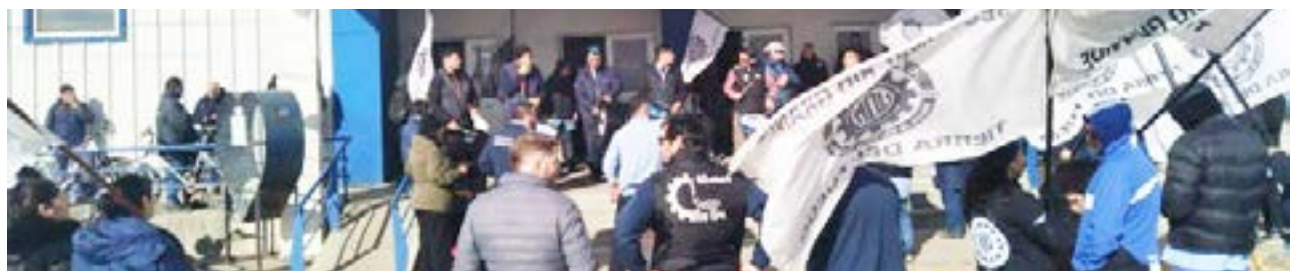
Por reclamos internos en la empresa BGH, ayer se manifestó el Congreso de Delegados y Delegadas en la puerta de la planta fabril.

ñamiento a la postura que vienen sosteniendo los trabajadores y sus representantes sindicales.