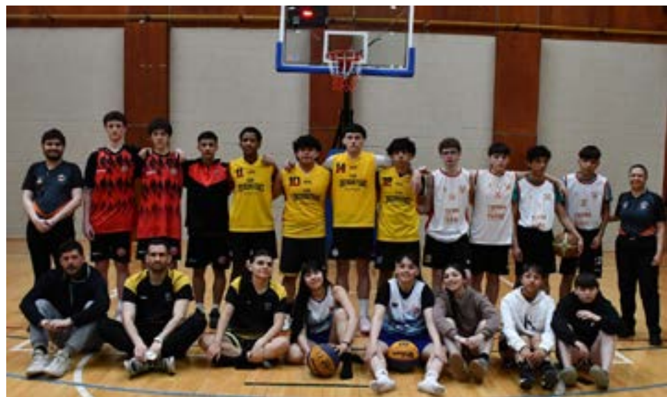
Los equipos de las ciudades de Río Grande, Ushuaia y Tolhuin en la rama femenina y masculina que disputaron la final provincial en básquet 3X3 correspondiente a los Juegos Deportivos Fueguinos 2025.

Una herramienta para la detección de talentos Uno de los puntos que más destacó Larocca en su