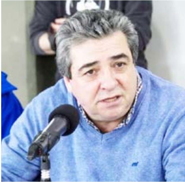
Becerra destacó que el resultado no fue casual, sino fruto del “gran trabajo de las autoridades, los intendentes y, sobre todo, de la militancia”.

“Este gobierno celebraba sistemáticamente el dolor del pueblo argentino, una locura absoluta”, afirmó, al tiempo que señaló que el voto bonaerense expresó un hartazgo frente a esa situación. “El pueblo es so-