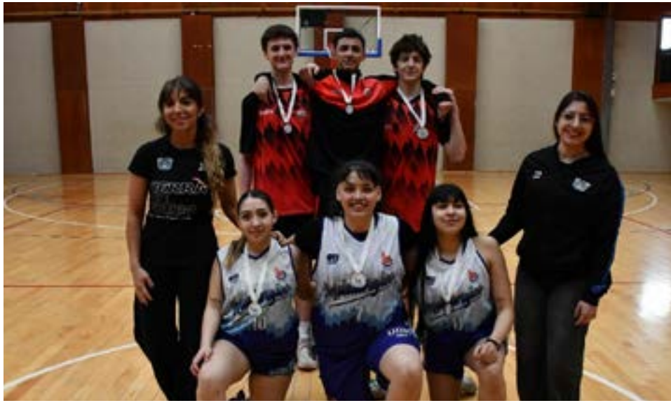
Los equipos de Escuela N° 3 (Ushuaia) masculino y Metalúrgico (Río Grande) en femenino, respectivos campeones provinciales de los Juegos Deportivos Fueguinos 2025.