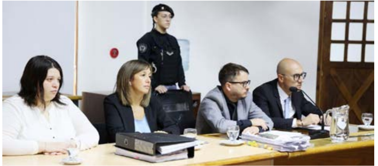
Mujer acusada de matar a su beba de 1 año y ocho meses, se negó a declarar ante el Tribunal de Juicio de Ushuaia.