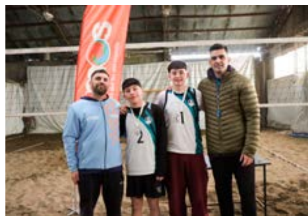
El equipo masculino de Casa del Deporte logró el primer puesto local en Beach Vóley.