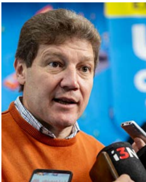
El gobernador de Tierra del Fuego, Gustavo Melella, celebró el triunfo electoral de Fuerza Patria en la provincia de Buenos Aires, que según datos oficiales superó por 14 puntos al candidato de La Libertad Avanza.

Para Melella, el mensaje de las urnas fue contundente, al sostener que "con 14 puntos de diferencia nadie se lo imaginaba, es un 'basta' a este modelo de hambre, de represión y de importaciones indiscriminadas que destruyen la producción y el empleo". Asimismo, cuestionó que el presidente Milei afirmara que "nada va a cambiar" tras la elección, lo cual "eso demuestra que no escuchó a una población muy importante". El mandatario fueguino remarcó la necesidad de "aliar a todas las provincias" de Fuerza Patria para repetir la victoria en las elecciones de octubre. "En octubre nos jugamos dos modelos de país, Milei o