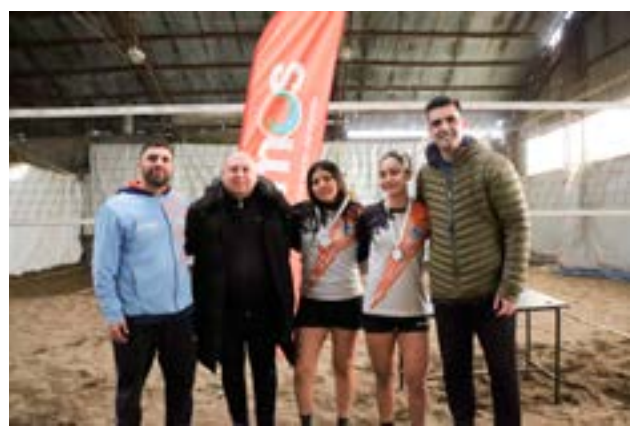
El equipo femenino de Haspen, primer puesto local en Beach Vóley.