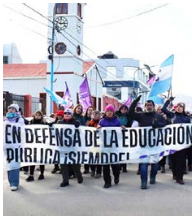
Desde ayer, nuevas medidas de fuerza del SUTEF afectan el normal dictado de clases.

Miércoles 10 a las 19 hs.: Congreso provincial de delegadas y delegados, con informe de la mesa paritaria y lectura de mandatos. El gremio volvió a remarcar consignas que reflejan el deterioro del sistema educativo provincial: Con hambre no se aprende, tampoco se enseña. Defendamos la educación pública y nuestro salario y urgente sanción de la Ley de Financiamiento Integral del Sistema Educativo”.