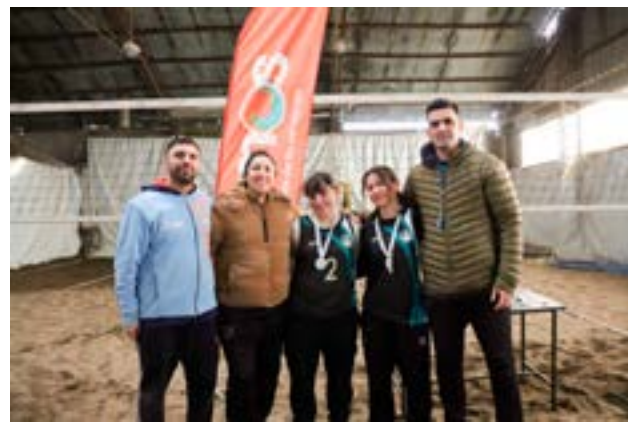
El equipo de Casa del Deporte femenino obtuvo el segundo lugar local en Beach Vóley.