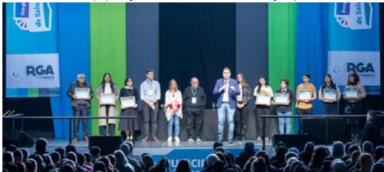
El Congreso se desarrollará los días 17 y 18 de septiembre en Río Grande, en el gimnasio del Colegio Don Bosco "Padre Miguel Bonuccelli", y el 19 en Ushuaia, en el Salón Milenium del Hotel Las Hayas. Además, de manera simultánea, el 18 de septiembre en la Casa de la Cultura de Río Grande se llevará a cabo una jornada específica para fuerzas de seguridad y profesionales de la salud y salud mental.

La realización del Congreso por tercer año consecutivo