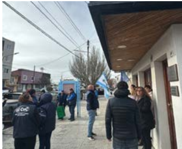
Siete trabajadores del Registro del Automotor N° 1 de Río Grande fueron despedidos sin previo aviso y con sueldos adeudados.

habían solicitado una solución preventiva, anticipando este desenlace. Sin embargo, la empresa no actuó, y hoy la in-