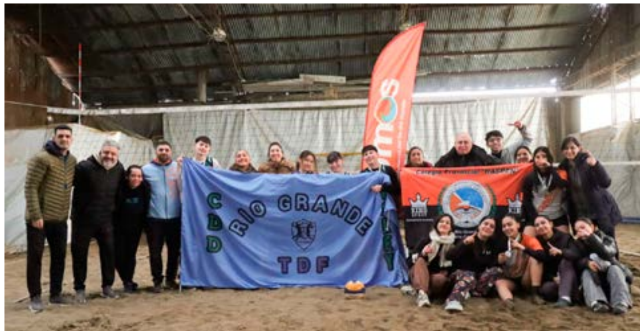
Los equipos de Haspen, Casa del Deporte y Academia de Vóley TDF en la rama femenina y masculina concretaron la final local de los Juegos Deportivos Fueguinos.

Los Juegos Fueguinos y la proyección hacia los Evita La instancia de Beach Vóley formó parte del amplio