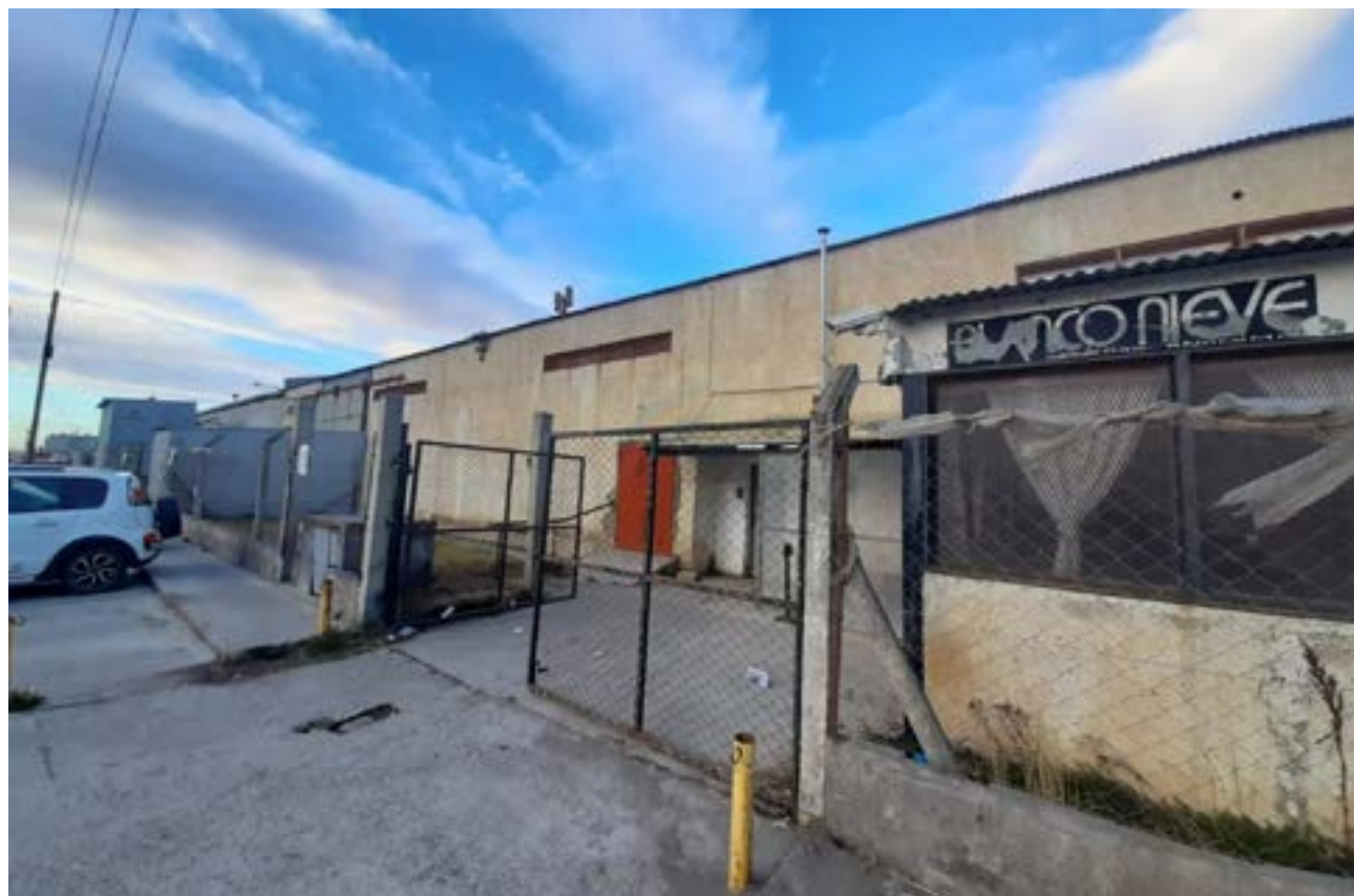
La empresa Blanco Nieve, que enfrenta una situación crítica, ofreció pagar sueldos en cuotas o reducir a la mitad su plantilla de 32 trabajadores como alternativa.

La situación de Blanco Nieve se suma a la lista de empresas textiles que atraviesan serias dificultades en la