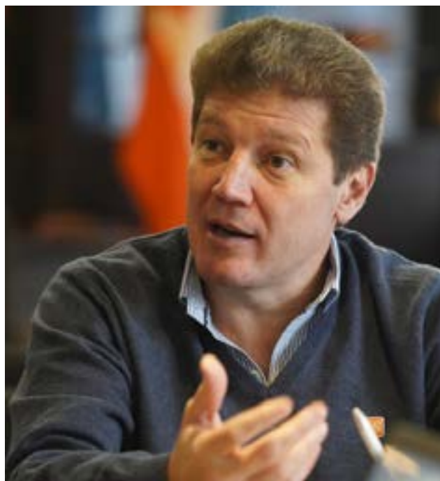
El gobernador Gustavo Melella cargó contra el frente Defendamos Tierra del Fuego por poner sobre la mesa de discusión las gestiones de unos y otros, cuando en octubre se dirimen dos modelos de país a nivel nacional.

“Algunos rancios dirigentes empresariales hablan de la presión fiscal, pero la provincia tiene muchos beneficios fiscales, como no pagar IVA ni Ganancias. Yo no escuché a muchos sectores comerciales salir a defender al sector tecnológico, porque se miran el ombligo”, concluyó.