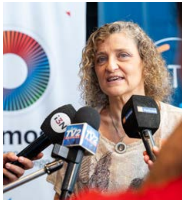
La ministra de Trabajo, Sonia Castiglione, cuestionó con dureza las políticas del gobierno nacional que “están haciendo pelota la industria nacional” y provocando una caída constante de los puestos de trabajo.

palabra del gobierno nacional de hacia dónde vamos. Todo tiene que ver con el equilibrio fiscal, pero se necesita generar economía, empleo, y en nombre de la libre competencia del mercado se está haciendo