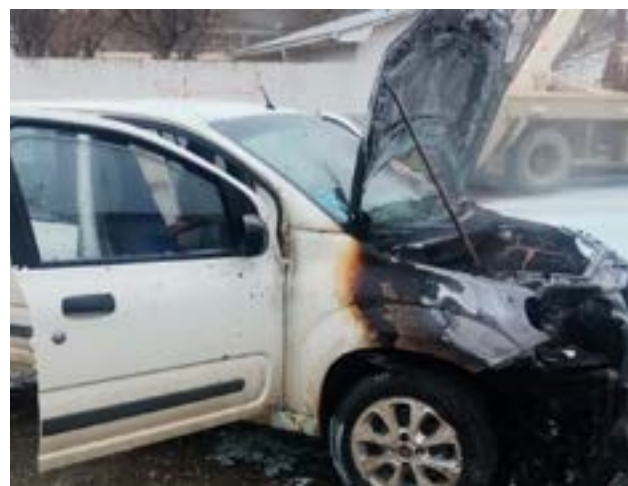
Rodado estacionado en Obligado al 1200 se incendió por desperfectos eléctricos.

Río Grande. - El propietario del rodado Fiat modelo Uno, color blanco, manifestó que al arribar a su domicilio observó salir humo del habitáculo del sector motor.