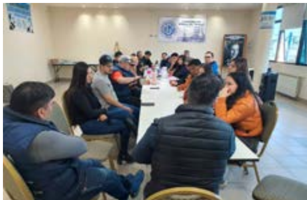
Dijeron desde UTHGRA que se trata de una "operación de precarización laboral".

Ahora, desde la UTHGRA informaron que "desde Newsan, por pedido de Tapia, se notificó a todos los trabajadores de los comedores de