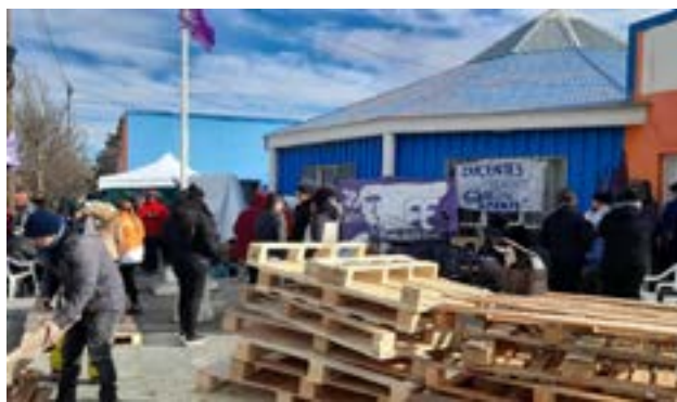
La mesa salarial docente, a pedido del Ejecutivo, pasó a un cuarto intermedio hasta hoy, 12 de septiembre, a las 15 horas en el Centro Cultural Yaganes de la ciudad de Río Grande.

Por otra parte, SUTEF notificó que se avanzará con una denuncia contra el Gobierno de la Provincia por la recolección de datos sensibles de docentes vinculados a su participación en huelgas, asambleas y desobligaciones. El gremio anunció que presentará el caso ante la Comisión Interamericana de Derechos Humanos (CIDH) y la Organización Internacional del Trabajo (OIT), al considerar esta práctica "un mecanismo de persecución sindical y un ataque a derechos fundamentales garantizados en la Constitución