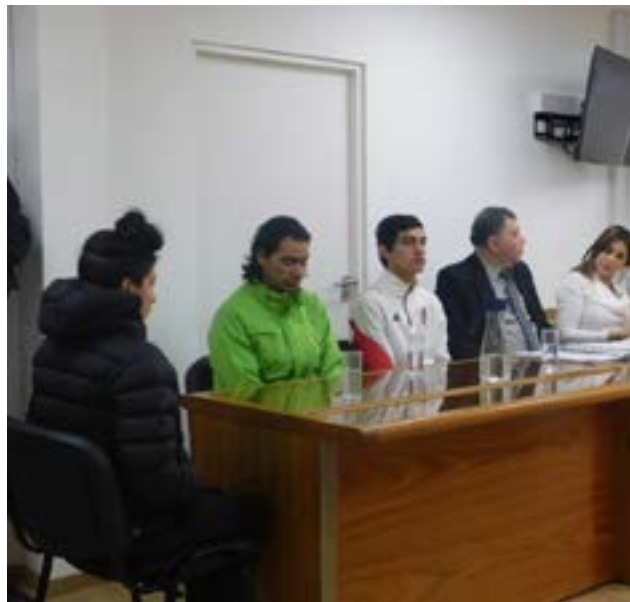
Efectivos de la División Delitos Complejos expusieron pruebas vinculadas a las víctimas y a los imputados.

como el contacto de la víctima con la mujer que falleció ese mismo día, hasta la llegada del móvil policial que encontró los dos cuerpos sin vida. Este viernes desde las 9.30 seguirán prestando declaración otros testigos requeridos por las partes.