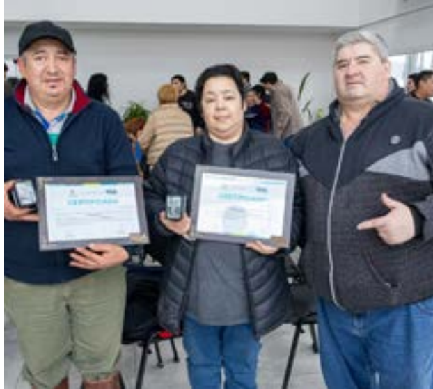
El Municipio de Río Grande llevó adelante la presentación oficial del Sello Avícola Municipal, una política pública que busca fortalecer la producción avícola local, acompañando a productores y productoras en el cumplimiento de altos estándares de bioseguridad y calidad.

seguros y de identidad local, sino que también reafirma nuestra decisión política de acompañar y fortalecer a quienes producen en nuestra tierra", expresó el secretario de Desarrollo Producti-