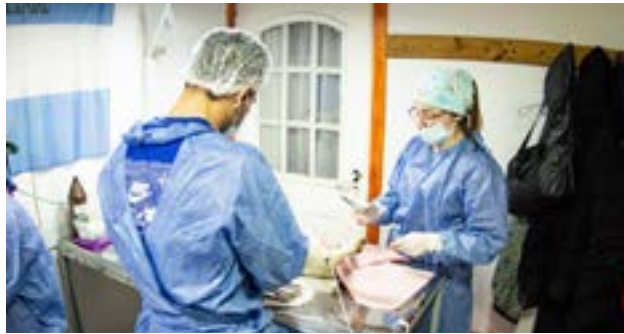
El Municipio reafirma su compromiso con el bienestar animal y la tenencia responsable, acercando servicios veterinarios gratuitos y de calidad a los vecinos y vecinas de la zona sur.

Para acceder al servicio, las mascotas deben concurrir en ayuno de 12 horas (sólidos y líquidos), acompañadas por su responsable mayor de 18 años con DNI. Asimismo, se recomienda asistir con correa y manta de abrigo o canil para un traslado seguro. Con esta propuesta, el Municipio reafirma su compromiso con el bienestar animal y la tenencia responsable, acercando servicios veterinarios gratuitos y de calidad a los vecinos y vecinas de la zona sur.