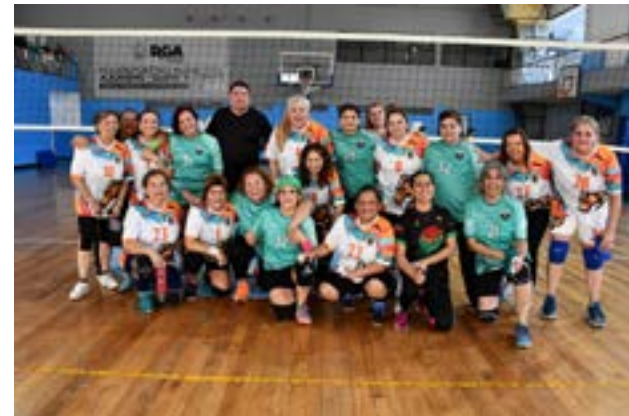
Los equipos de Indomables y Hain Rojo (Tolhuin), categoría +50.

Según adelantó Crosetti, la categoría +68 es la que tiene mayor proyección para lograr esta represen-