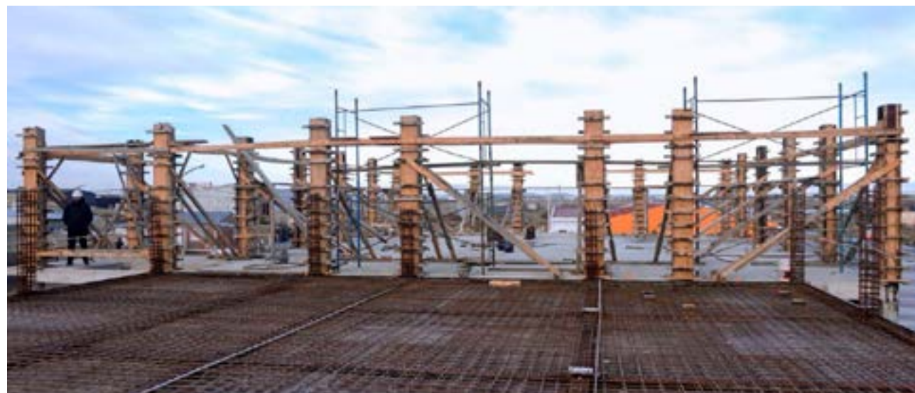
Destacó que el gobierno ha acompañado el pedido de la institución de que se tomen empresas locales para la obra pública, tras las malas experiencias con empresas que vinieron de afuera "en cierto tipo de obras donde hay mucho volumen y las empresas locales no tienen la tecnología, se ha dado la asociación de empresas de fuera de la provincia", señaló.

Respecto de la caída de obras en los últimos años, recordó que "luego de la pandemia, en 2021 vino mucha inversión del gobierno nacional para empezar a mover todo, hoy es un país y en ese momento era otro. En un contexto inflacionario como teníamos an-