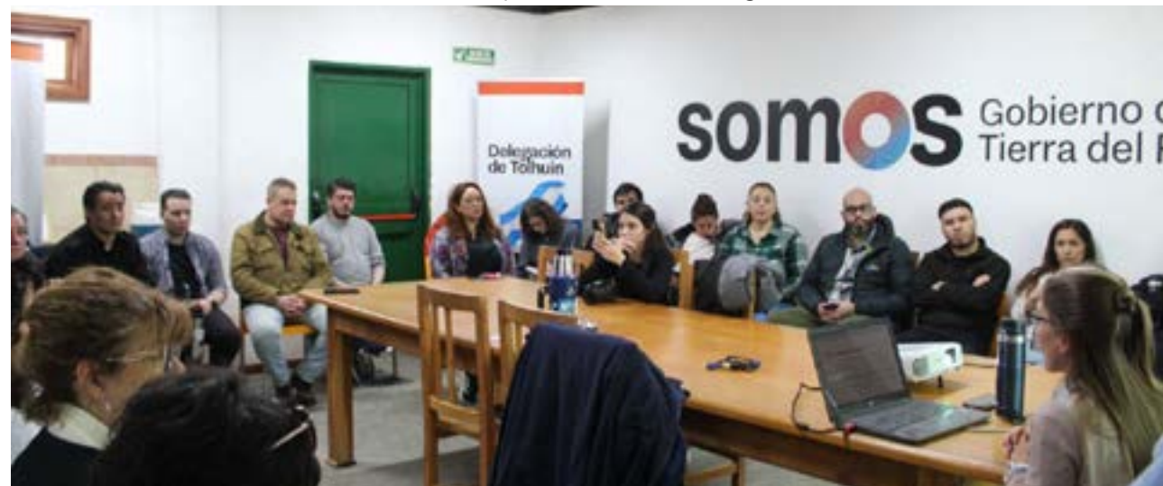
La propuesta fue llevada adelante por el Gobierno Provincial a través de la Secretaría de Salud Mental y Problemáticas de Consumo.

• Martes 23 de septiembre, a las 11 horas, en el Salón del IPRA de la ciudad de Río Grande (Perito Moreno 168), con la propuesta “Hablemos de suicidio. Abordaje territorial a una problemática social”.