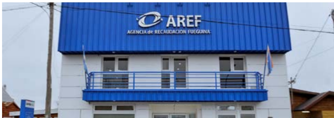
La iniciativa ofrecerá un plazo de 60 días para adherirse al régimen, una vez sancionada la ley, y contempla importantes beneficios para los contribuyentes, especialmente en lo que refiere a la reducción de intereses resarcitorios y punitivos.

do recibirán una quita del 50% de los intereses adeudados. En caso de elegir un plan de cuotas, se aplicará un descuento menor, en función del plazo de financiación elegido.