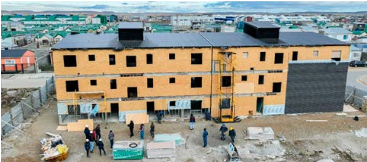
Actualmente están trabajando con el IPV con las 414 viviendas, 204 en Río Grande y 210 en Ushuaia.

tros no estamos enterados de este tema. Esta obra va a venir muy bien para el sector", aseguró. Dado que se prevé una gran cantidad de metros cúbicos a cubrir con piedra, indicó que "la única