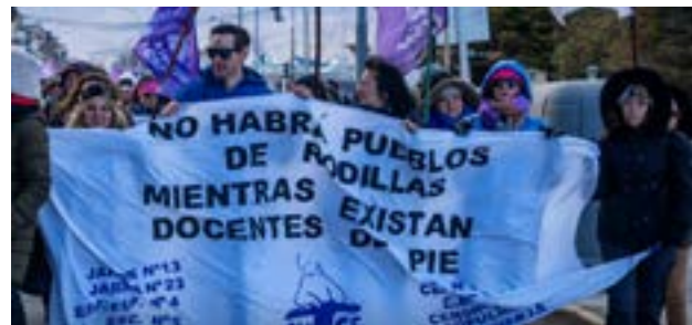
Luego de la mesa salarial del viernes, donde dijeron que el Gobierno “insistió con una propuesta rechazada sumando solo $ 1.400”; los docentes resolvieron una serie de medidas para la semana que está comenzando

Asimismo, dijeron que el Ejecutivo “planteó que podría avanzar en una primera etapa del Programa de Desendeudamiento para el Personal Docente, que «permita refinanciar las deudas asumidas con el Banco de Tierra del Fuego en productos de la mencionada entidad (tarjetas de crédito y préstamos) con mora mayor a 30 días. Para tal fin se propone refinanciar dichas deudas con una tasa preferencial subsidiada