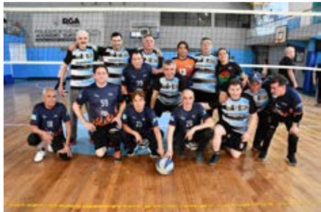
Los equipos de Wikam y Hain (Tolhuin), categoría +50.

en damas como en caballeros se logró un nivel de competencia parejo y motivador. Además, subrayó la importancia del trabajo voluntario y comunitario que hace posible la liga: árbitros, planilleros, banderilleros y colaboradores que se suman de manera constante y