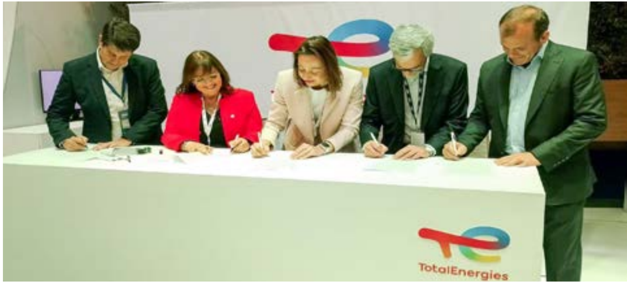
La rúbrica tuvo lugar en el stand de Total Energies, durante la Expo 2025 Argentina Oil & Gas en el predio de la Rural, en la ciudad de Buenos Aires.

“Sabemos que los hidrocarburos son una fuente im-