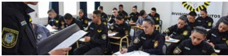
La Dirección de Institutos Policiales invita a participar de la 3ª Jornada de Puertas Abiertas y Articulación.

Desde la Policía Provincial indican: "Nos encontraremos en el gimnasio de la Escuela de Policía, en la Ruta 3, kilómetro 7½ de la ciudad de Río Grande.