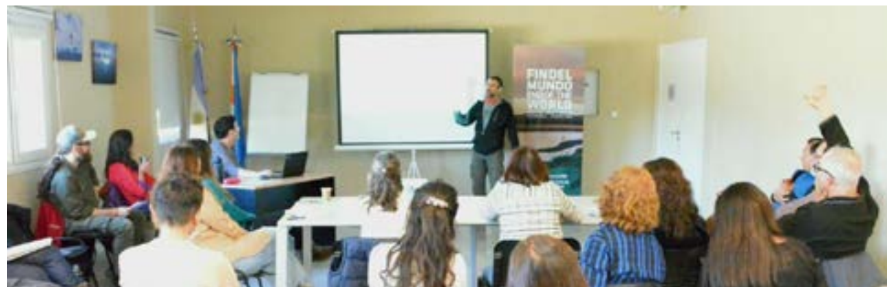
El Ministerio de Producción y Ambiente, a través de la Secretaría de Ambiente, llevó adelante la cuarta reunión de la Comisión Consultiva del Área Natural Protegida Península Mitre (ANPPM).

Finalmente, Bianchi resaltó "la importancia del trabajo en el comité de seguimiento, conformado por