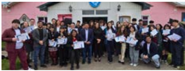
En el Museo Virginia Choquintel se realizó el lanzamiento del programa "Concejales Estudiantiles", impulsado por el Concejo Deliberante de Río Grande.

Por último, sostuvo que "nos espera un gran desafío, porque cada uno de los jóvenes podrá vivir de cerca la dinámica de la institución y aportar su mirada sobre la ciudad que quieren construir", concluyó Zamora.