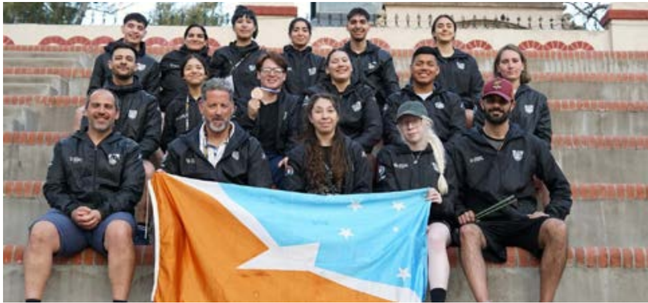
La delegación fueguina que representó a Tierra del Fuego en los Juegos Argentinos de Alto Rendimiento

Los representantes fueguinos se midieron ante los mejores valores a nivel nacional, demostrando un rendimiento acorde al innovador certamen en el que,