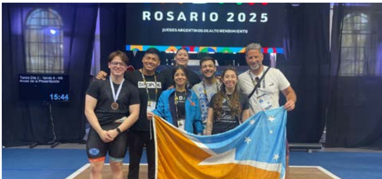
El equipo de Levantadores Olímpicos con gran participación de los JADAR.

cada una de las federaciones deportivas nacionales se encargó de coordinar con el Comité Organizador las designaciones de los deportistas en cada una de sus