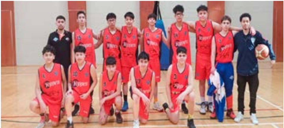
El equipo de masculino de Yoppen, categoría U15.