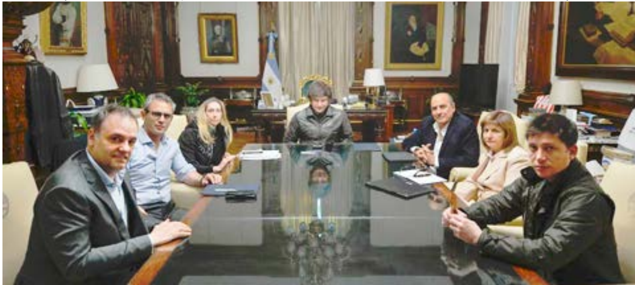
La derrota del Gobierno, por amplísima mayoría, en su intento de sostener los dos vetos del Presidente al aumento de fondos para la Emergencia Pediátrica y las universidades públicas estaba cantada, incluso para el oficialismo, pero la magnitud dejó en ascuas a la Casa Rosada.