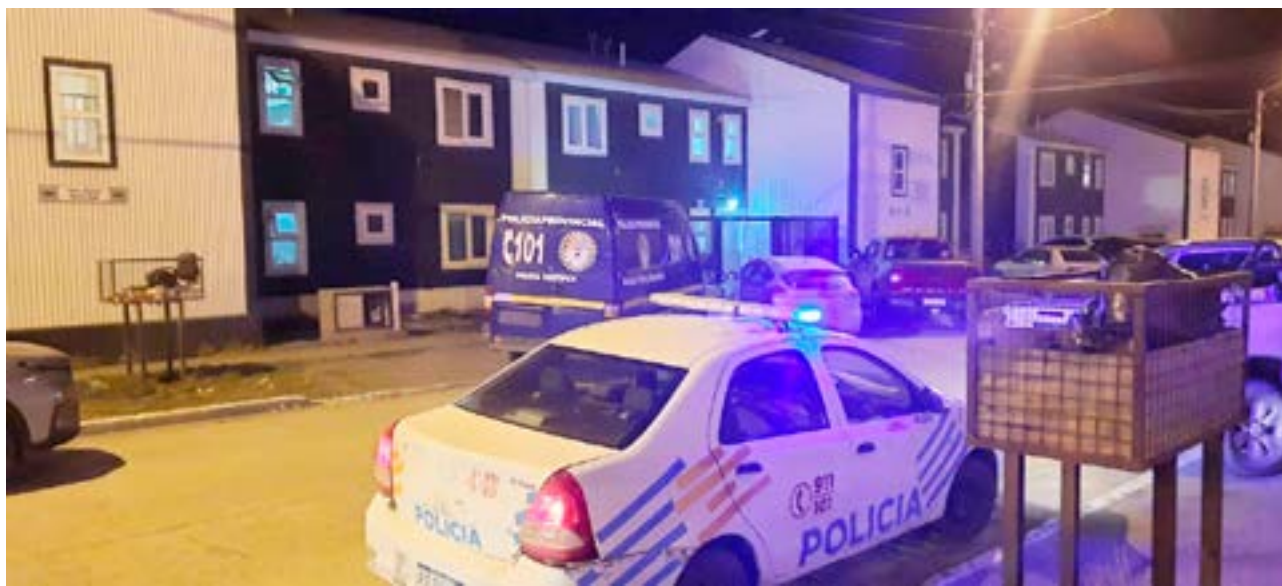
El cuerpo de la víctima podría haber sido encontrado sobre la cama con una bolsa negra en la cabeza sujeta con cinta adhesiva.

No se descartaría ninguna hipótesis y se evalúan to-