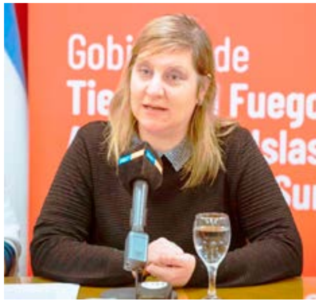
La ministra de Salud de Tierra del Fuego AIAS, Judit Di Giglio, se refirió a la situación epidemiológica actual en la provincia y advirtió sobre la importancia de sostener las coberturas de vacunación.

Respecto al cumplimiento del calendario de vacunación por parte del Gobierno Nacional, la ministra aclaró: “Por ahora tengo que decir que se está cumpliendo con el calendario de vacunación obligatorio. Las vacunas las compra el gobierno nacional y las distribuye”.