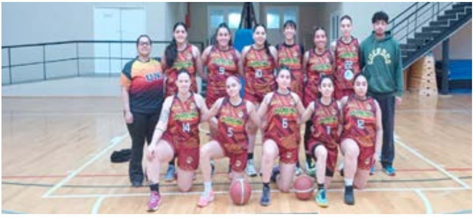
El equipo de femenino de Universitario, categoría mayores.

de competencia y de valores”, aseguró Argüello. Una provincia que respira básquet Lo que sucede en el gimnasio del Colegio Haspen es apenas una muestra del crecimiento que vive el básquet en toda la provincia. Los torneos, los cruces interciudades, la incorporación de nuevos clubes y categorías, y el acompañamiento de las familias son señales claras de un proceso que recién comienza y que promete dar grandes frutos. La Federación, con el apoyo de los clubes, dirigentes, entrenadores, árbitros y familias, está construyendo una red sólida y sostenible que busca que cada niño o niña que quiera jugar al básquet tenga un espacio donde hacerlo. Argüello lo resume con entusiasmo: “La idea es darle continuidad al básquet en Río Grande, en Ushuaia y en Tolhuin. Queremos que participen todos, que nadie quede afuera. Y cada paso que damos nos confirma que vamos en la dirección correcta”. Agradecimiento y proyección Antes de volver a la cancha para acompañar una nueva tanda de partidos, la presidenta de la Federación se tomó un momento para agradecer: “Siempre es importante que los medios estén presentes, porque ayudan a difundir lo que pasa en el básquet y a motivar a más familias y chicos a sumarse. Agradecemos también a las familias, porque sin su esfuerzo nada de esto sería