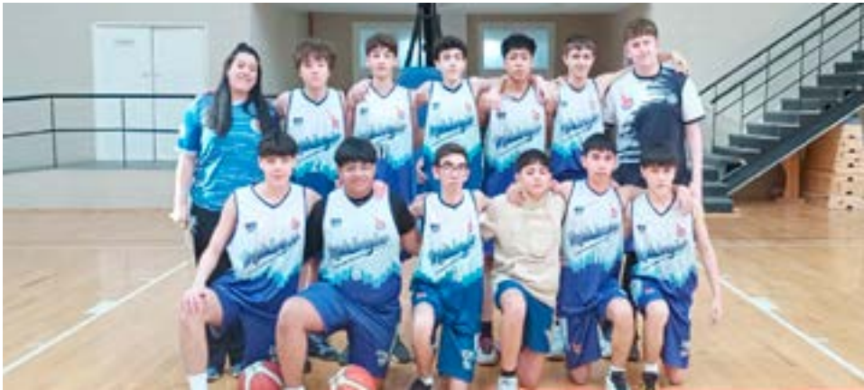
El equipo masculino de Metalúrgico, categoría U15.

Partido 2 – categoría U13 masculino – inicio: 14.00 horas Metalúrgico vs. Universitario Partido 3 – categoría mayores femenino – inicio: 16.00 horas Universitario vs. Metalúrgico Partido 4 – categoría mayores masculino – inicio: 18.00 horas Yoppen Azul vs. Yoppen Naranja Ushuaia Domingo 21 Gimnasio Ana Giró Partido 1 – categoría U17 masculino – inicio: 10.00 horas Universitario vs. Escuela 3 Negro Partido 2 – categoría U13 masculino – inicio: 12.00 horas CDA vs. Universitario Partido 3 – categoría U17 masculino – inicio: 14.00 horas Escuela 3 Rojo vs. Universitario Partido 4 – categoría U13 masculino – inicio: 16.00 horas Escuela 3 vs. Universitario Partido 5 – categoría mayores masculino – inicio: 18.00 horas CDA vs. Defensores