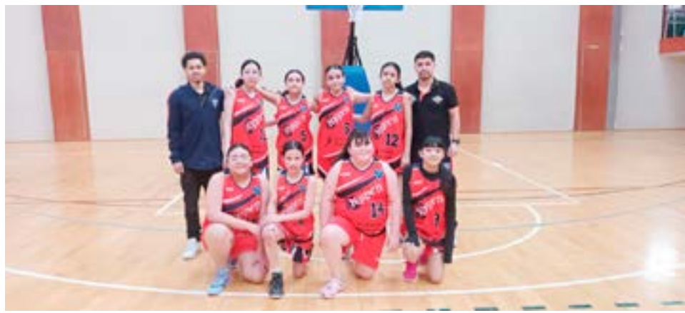
El equipo femenino de Yoppen, categoría U13.

En ese sentido, a partir del próximo fin de semana comenzarán los primeros cruces. El club Universitario de Río Grande será el encargado de viajar a Ushuaia para enfrentar al Club de Amigos y a la Escuela 3, en un fin