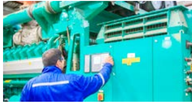
El Sindicato de Luz y Fuerza de la Patagonia advirtió sobre presuntas irregularidades en la adquisición de combustible por parte de la Dirección Provincial de Energía.

El escrito manifiesta que la operación mencionada podría implicar un “desvío de fondos públicos y una