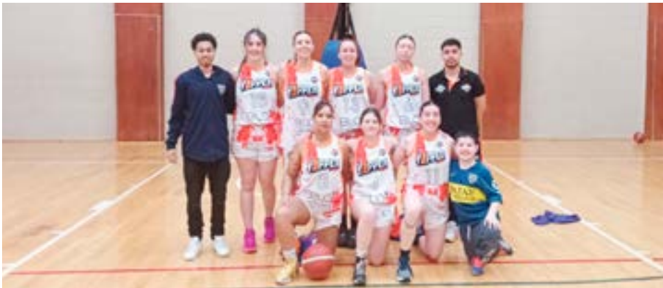
El equipo femenino de Yoppen, categoría mayores.

vida que deja huella. “El básquet es una inversión a largo plazo en los chicos, y las familias lo entienden así. Gracias a ellos todo esto es posible”, subrayó la presidenta. Inclusión, formación y futuro El torneo oficial que impulsa la Federación de Básquet de Tierra del Fuego no es solamente una competencia deportiva. Es una herramienta de formación integral, donde los chicos aprenden valores como el esfuerzo, la disciplina, la solidaridad y la superación personal. Cada equipo que se suma, cada árbitro que debuta, cada familia que acompaña, fortalece a la comunidad del básquet fueguino y marca un camino claro hacia el futuro. “Estamos convencidos de que este es el semillero de nuestras categorías mayores. Los chicos y chicas que hoy juegan en U11 o U13 serán los protagonistas de la primera división dentro de unos años. Y lo más importante es que ya se están formando con una base sólida