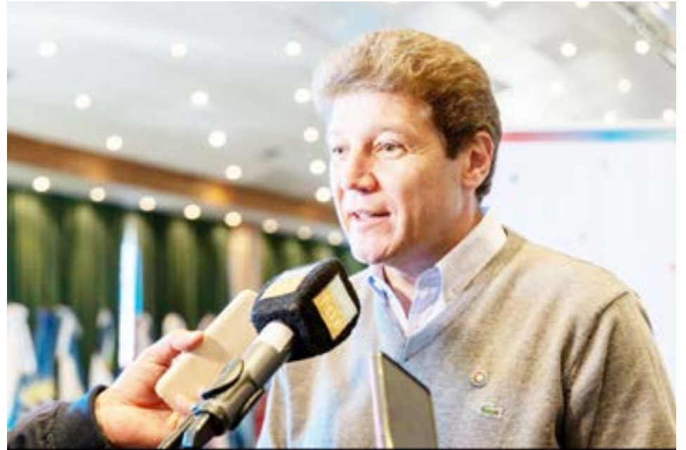
El gobernador Gustavo Melella analizó el discurso de presentación del presupuesto nacional 2026 y consideró que “fue un manotazo de ahogado de un modelo económico que ya colapsó y está acabado”.

“Nosotros queremos los recursos, no queremos que queden como los ATN, que es una vergüenza cómo los reparten y hacen lo mismo que hacía el kirchnerismo. Los gobernadores propios y