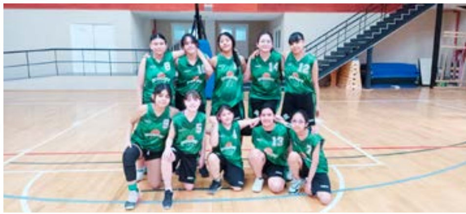
El equipo femenino de Defensores, categoría U13.

de semana que promete ser histórico para los más jóvenes.