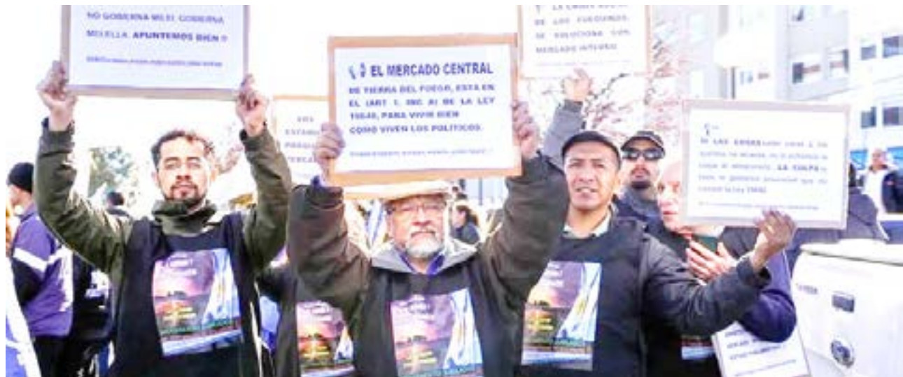
El Movimiento de Trabajadores, Estudiantes Universitarios y Jubilados Fueguinos (MTEUyJF) emitió un documento, donde reclaman que “se recomponga naturalmente el poder adquisitivo del salario para vivir con bienestar y confort, como viven los políticos en Tierra del Fuego”.

como viven los políticos en Tierra del Fuego”. Lo firman: Movimiento de Trabajadores, Estudiantes Universitarios y Jubilados Fueguinos (MTEUyJF).