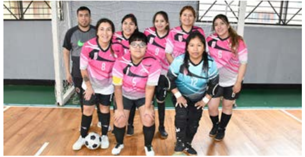
El equipo de Juventud, primera división "B".