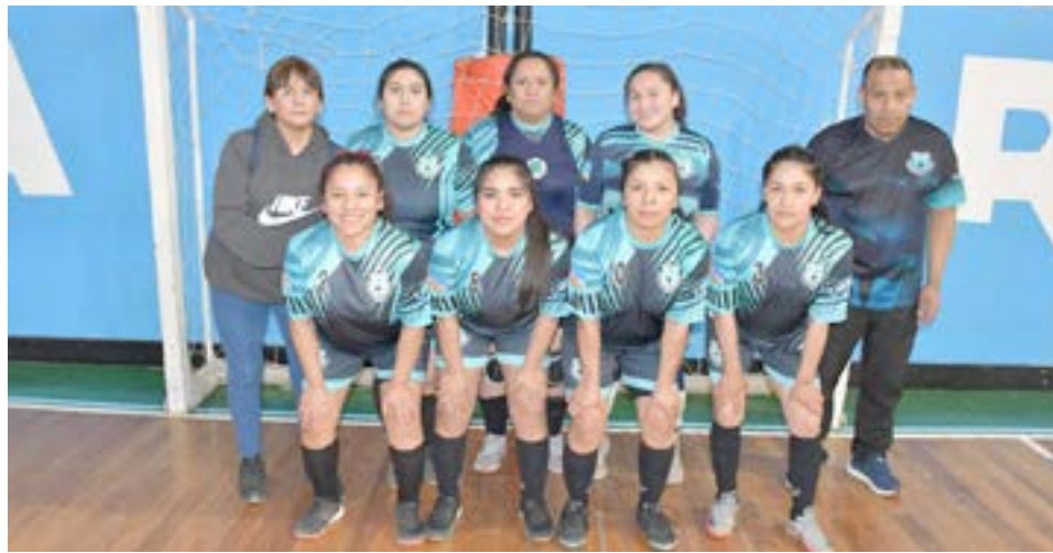
El equipo de Liga del Norte, primera división "B".

El dirigente reconoció que este tema representa un