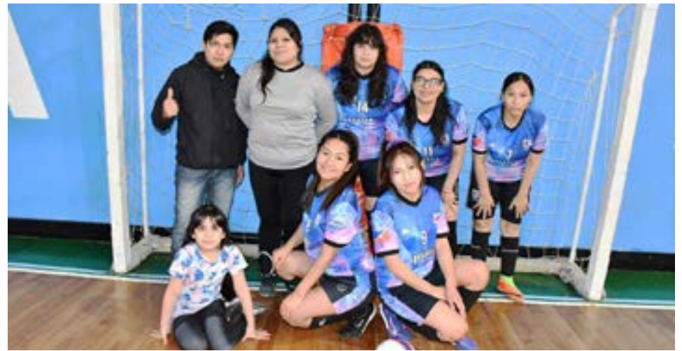
El equipo de Unión Austral, primera división "B".

desafío constante: "Muchos equipos se bajaron porque les cuesta presentar la documentación. También influye la situación económica, porque recaudar fondos para pagar el seguro, el derecho federativo y la inscripción no siempre es sencillo. Empezamos con veinticuatro equipos anotados en las reuniones previas y terminamos con dieciocho. A los seis restantes les pedimos que se preparen para el próximo Apertura".