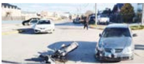
Motociclista fue hospitalizado tras choque en la intersección de calles Mariano Moreno y Echelaine.

Tras el incidente, la ambulancia trasladó a un hombre de 43 años al Hospital Regional para recibir atención médica. Se realizaron las actuaciones correspondientes con la asistencia de personal de Policía Científica de esta ciudad.