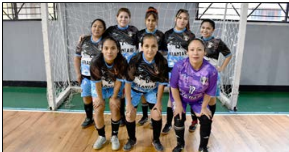
El equipo de Atlanta, primera división "B".