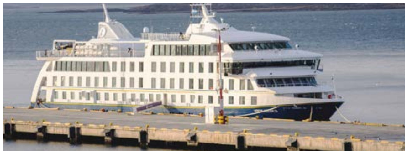
El Puerto de Ushuaia volvió a vestirse de bienvenida con la llegada del buque Ventus Australis, dando inicio oficial a la temporada de cruceros 2025-2026.

Con estas cifras, Tierra del Fuego AeIAS reafirma su lugar como principal puerta de entrada mundial a la Antártida, gracias a su ubicación estratégica. Cada temporada, miles de turistas eligen este puerto como base para vivir una experiencia única en uno de los últimos territorios vírgenes del planeta.