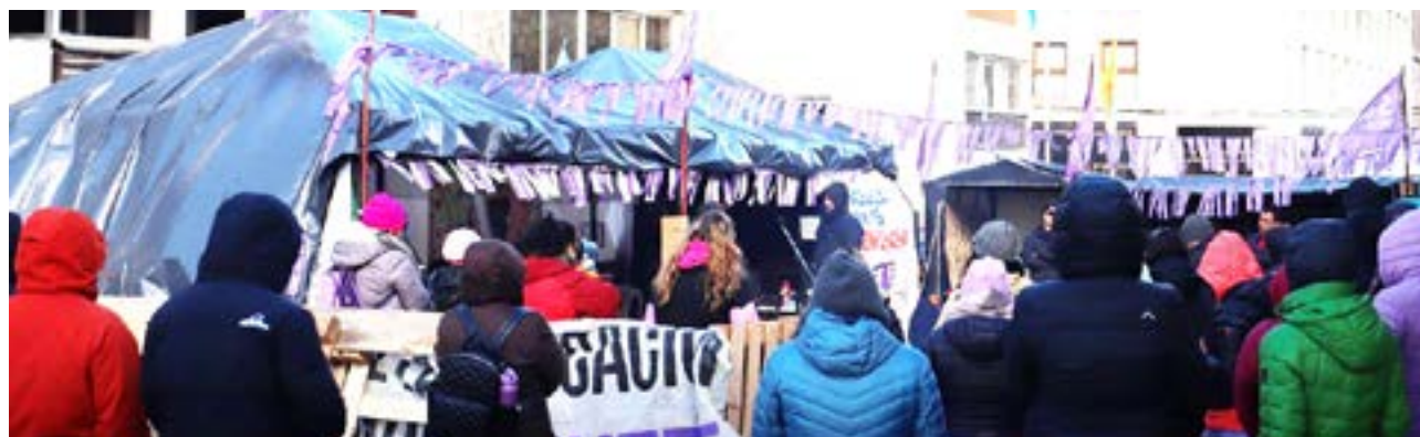
Hoy habr  una marcha provincial en Ushuaia, para acompa ar la reuni n que tienen prevista con el gobernador, Gustavo Melella.

do como plantea  l, cosa que es l gica porque  l acompa   en el gobierno de Bertone cuando hizo todo lo que hizo, despu s a lo  ltimo salt  cuando ya era insalvable. Ahora hay muchos que vuelven y piden mano dura o que le dicen al Gobernador que no sea timorato con nosotros, como lo he escuchado a Gast n D az".