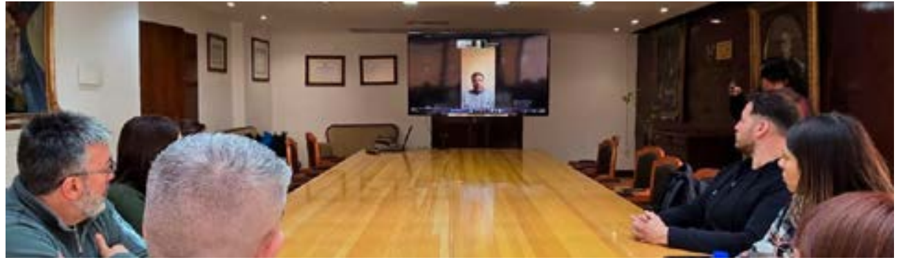
Este viernes, 19 de septiembre, en el marco del acampe educativo y del paro provincial de 48 horas, se llevó a cabo la reunión entre el Sindicato Unificado de las Trabajadoras y Trabajadores de la Educación Fueguina (SUTEF), el gobernador de la provincia, Gustavo Melella, de manera virtual, y el ministro de Educación, Pablo López Silva

Finalmente, desde el sindicato docente se estableció la agenda del día lunes 22, fecha en la cual se llevarán adelante la mesa paritaria salarial a las 14 horas y la reunión por la ley de financiamiento educativo a las