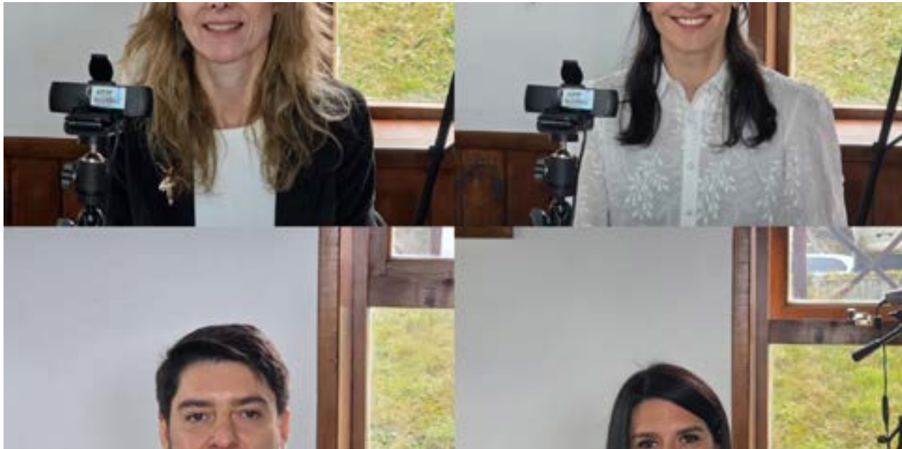
El Consejo de la Magistratura continuó las entrevistas a postulantes para el cargo de juez de Familia 1 de Ushuaia.