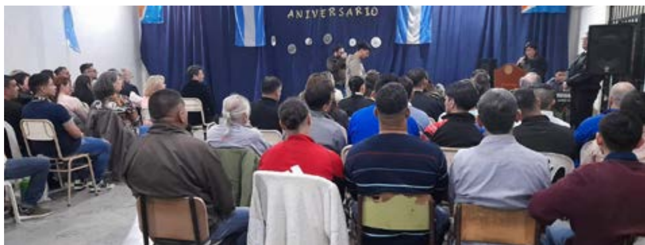
El Centro Educativo "Aldo Aroldo Abregú" de la Unidad de Detención N°1 de la ciudad de Río Grande celebró su 10° Aniversario.

"Aldo venía fuera de su horario y compartía los talleres con las personas privadas de su libertad, daba clases de apoyo y hacía una contención que iba mucho más de lo educativo. Fue muy valorado por toda la institución" señaló y puntualizó en que "con la educación podemos cambiar para ser una sociedad mejor y eso es otra forma de estar en libertad".