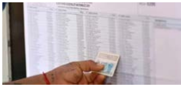
La CNE ha establecido el 26 de septiembre como fecha límite para que los ciudadanos corrijan cualquier error u omisión en sus datos.

será la implementación de la Boleta Única de Papel (BUP), un sistema que debuta en la provincia. Este