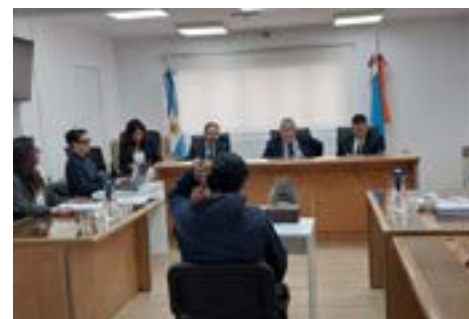
El próximo miércoles comenzarán los alegatos en juicio por abuso sexual contra un sujeto de 41 años.