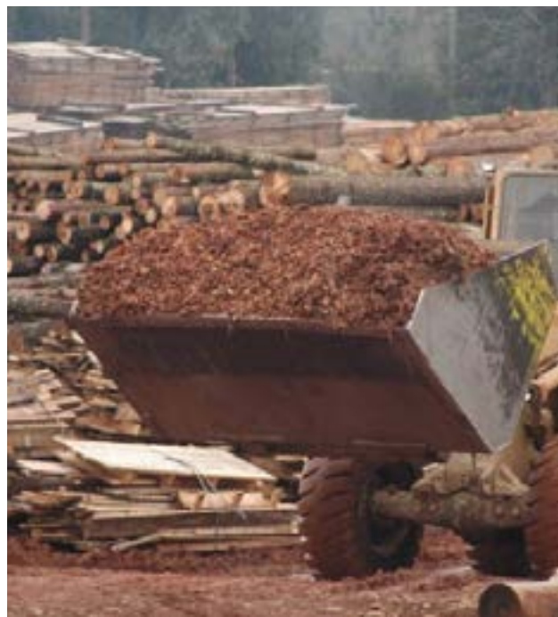
“La planta de pallets necesita 380 kilowatts, que es menos de un cuarto de mega, y el aserradero necesita 250, en total son 550 kw. Hoy la generación en Tolhuin está en 2,4 megas y con muchas limitaciones”, expresó Rivero.

tores hay que acompañarlos con una buena gestión y con visión de lo que queremos para la provincia”, reclamó.