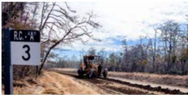
Pese al convenio firmado, la administración central no ha transferido ni un solo peso a Vialidad Provincial, forzando a la provincia a sostener con recursos propios tareas esenciales para garantizar la transitabilidad y seguridad vial.

Ante la desidia del gobierno nacional, Vialidad Provin-