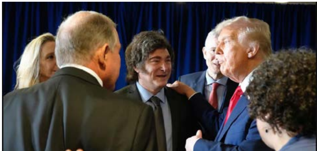
El secretario del Tesoro de los Estados Unidos, Scott Bessent, confirmó ayer a la mañana el acuerdo para asistir financieramente a la Casa Rosada.

En otros despachos relativizan este alcance: "Si fue-