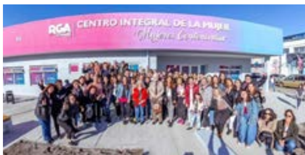
El Municipio de Río Grande conmemora un nuevo aniversario de este espacio físico de referencia en la región que asiste y acompaña a las mujeres de la ciudad, afianzando las políticas de género en Río Grande.

Río Grande. -El Centro Integral de la Mujer "Mujeres Centenarias" fortalece y enriquece la atención hacia las mujeres y diversidades que atraviesan situaciones de violencia por motivos de género, así como también ofrece acompañamiento a sus familias, mediante actividades de esparcimiento y propuestas que promueven el bienestar integral. En este marco, el Municipio celebrará un nuevo aniversario de este espacio con actividades abiertas a toda la comunidad. El viernes 26 de septiembre a las 19 horas, se realizará la inauguración de una Biblioteca de autoras fueguinas para mujeres e infancias; y luego en conjunto con la Subsecretaría de Cultura, se llevará adelante una Velada Ar-