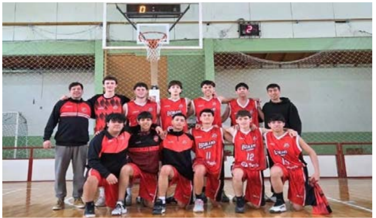
El equipo de Escuela 3 de la ciudad de Ushuaia recibió el pasado fin de semana al club Universitario de Río Grande para el ya clásico cruce deportivo entre las dos localidades fueguinas.

clubes hay más de 12 chicos y chicas por categoría, entonces se dividen en dos equipos para que todos