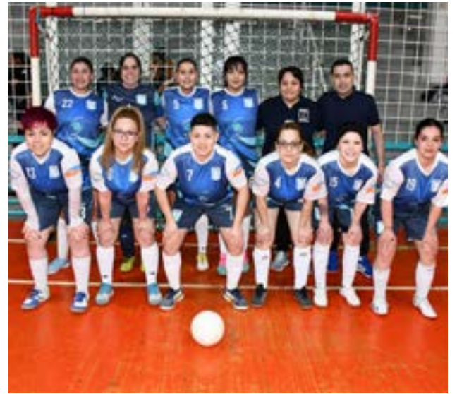
El equipo del club O'Higgins, primera división "B".

El retorno del Real Madrid no solo significa la reaparición de un club histórico, sino también una oportunidad concreta de potenciar el futsal femenino en Río Grande. En un contexto de creciente participación de mujeres en diversas disciplinas, esta iniciativa se suma al trabajo que