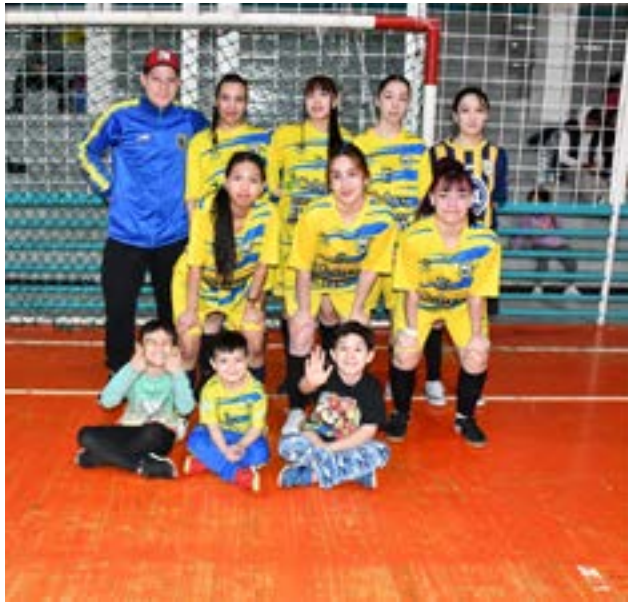
El equipo del club Real Madrid, primera división "B"

Río Grande.- El Torneo Clausura 2025, organizado por la Asociación Civil, Deportiva, Social y Cultural de Río Grande, marca el regreso del plantel femenino. Con entusiasmo renovado y el liderazgo de un técnico debutante, la apuesta del Real Madrid busca no solo revivir viejas glorias, sino también proyectar un futuro con nuevas generaciones de jugadoras.