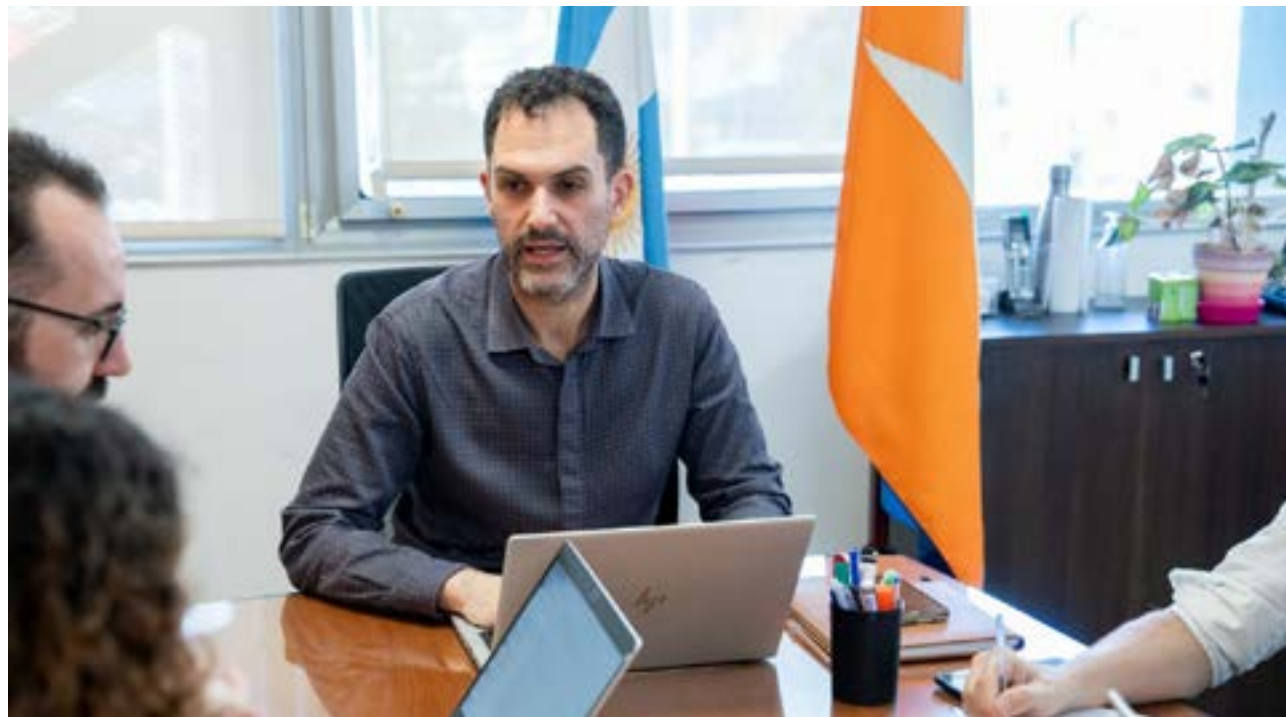
El ministro de Economía Francisco Devita advirtió que deberá haber una adecuación presupuestaria porque se prevén menos ingresos, de acuerdo al proyecto de presupuesto nacional y las variables que contempla.

Tuve dos reuniones muy buenas en dos años, que es un número irrisorio para resolver problemas. El Ministro de Economía de la nación no me ha recibido nunca y no sucede sólo conmigo, porque no recibe a