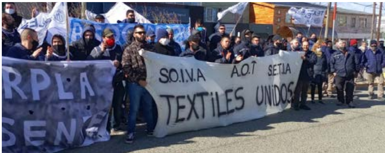
La textil planea imponer vacaciones a todo su personal a partir del 29 de septiembre, sin acuerdo previo, luego de que la Justicia Federal de Comodoro Rivadavia limitara la salida de su producción de Tierra del Fuego.

trabajadores tienen derecho a vacaciones anuales pagas con un mínimo de días que varía según la antigüedad. Además, los empleadores deben comunicar