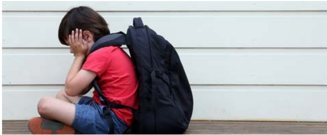
En su resolución, el organismo advirtió que las “desobligaciones docentes” y paros reiterados comprometen seriamente el cumplimiento del ciclo lectivo, poniendo en riesgo el derecho de los estudiantes a recibir educación continua y de calidad.

“Asimismo, el Sr. Ministro deberá ordenar lo condu-