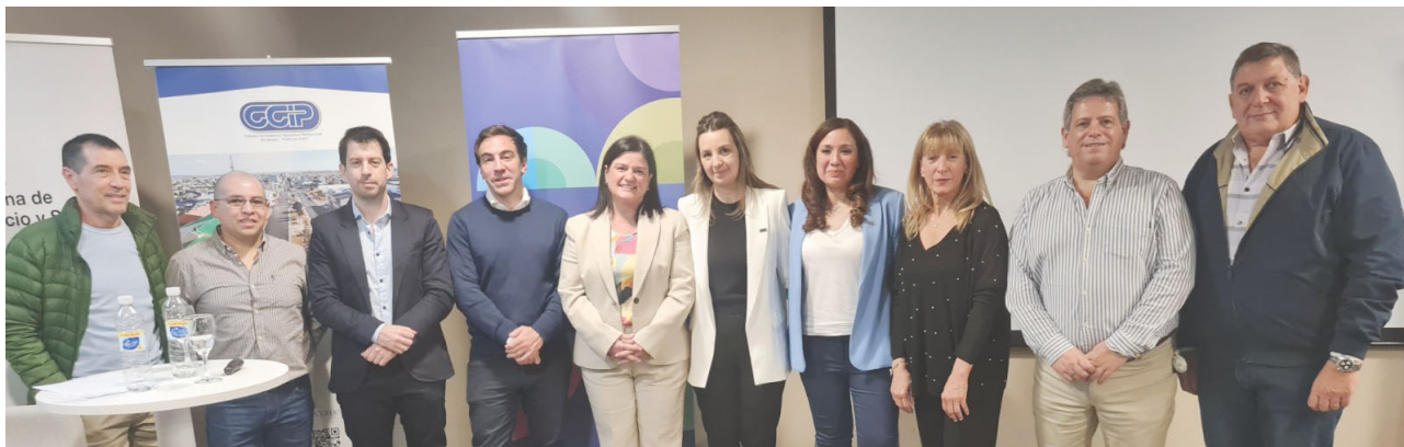
El encuentro convocó a empresarios, contadores, profesionales y estudiantes interesados en conocer una mirada actualizada sobre la economía nacional, en una semana marcada por la expectativa política y la incertidumbre previa a las elecciones.