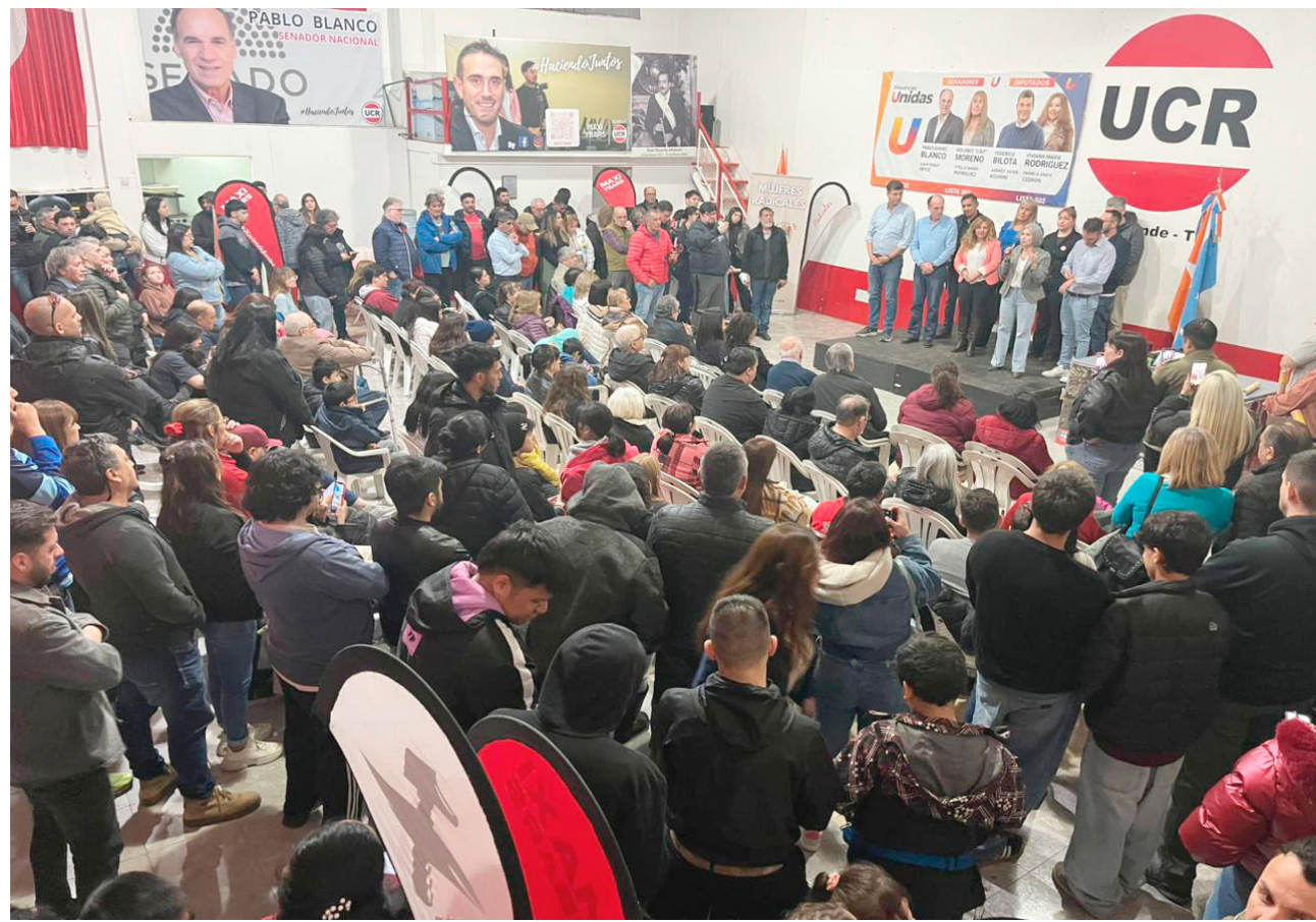
Anoche en el comité de la UCR en la ciudad de Río Grande, Provincias Unidas realizó el cierre de campaña.

"El objetivo principal es continuar con lo que uno está haciendo en el Senado y agradecer a todos los