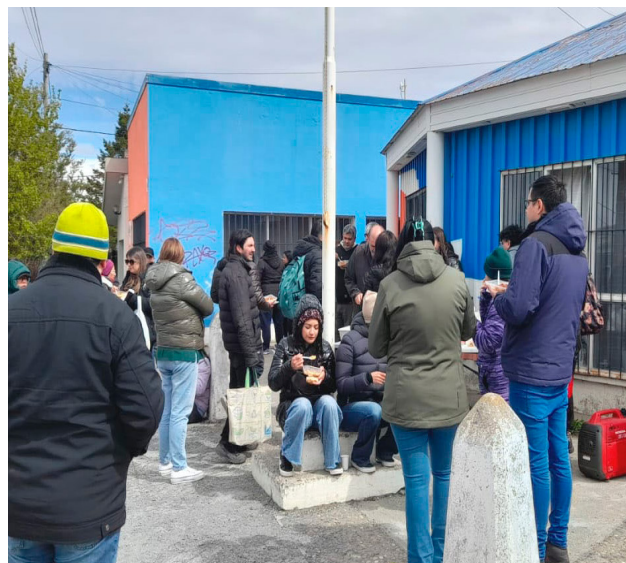
El secretario General del SUTEF, dijo que el Gobierno provincial sabía que era inminente el ajuste de Nación y tenían que anticiparse con medidas “para que el pueblo pague menos el costo”.

más. Entonces, va a haber cambio, para mí, brusco. Y esos cambios bruscos, en general, cuando se toman en palacio siempre lo pagamos los de abajo. Entonces, obviamente, que toma importancia que