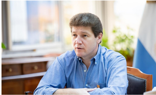
El Gobernador manifestó su respaldo total a las empresas Sueño Fueguino S.A. y BARPLA S.A., como a todas las firmas del rubro, que enfrentan una situación crítica tras los decretos del Gobierno nacional que las excluyeron del régimen promocional de la Ley 19.640.

El Gobernador manifestó su respaldo total a las empresas Sueño Fueguino S.A. y BARPLA S.A., como a todas las firmas del rubro, que enfrentan una situación crítica tras los decretos del Gobierno nacional que las excluyeron del régimen promocional de la Ley 19.640. “Ellos se van a presentar con un amparo ante la Justicia y el Gobierno va a acompañar ese amparo”, anunció Melella, y sentenció: “No vamos a permitir que se debilite una de las pocas políticas federales activas