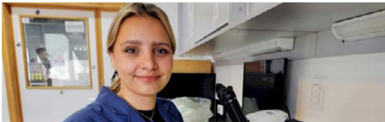
La joven riograndense presentó su proyecto en abril de este año, centrado en el estudio de la alimentación y la adaptación al frío de los pueblos originarios fueguinos, una línea de trabajo que integra saberes biológicos, antropológicos y ambientales.

Fue seleccionada entre cientos de postulaciones internacionales, y la notificación de su beca —recibida en agosto— fue celebrada con entusiasmo tanto por su familia como por la comunidad académica de la UNTDF.