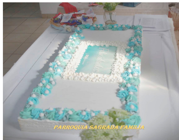
Desde la organización parroquial destacaron el acompañamiento del Municipio de Río Grande, que colaboró con tortas especialmente preparadas para la ocasión.

Desde la organización parroquial destacaron el acompañamiento del Municipio de Río Grande, que colaboró con tortas especialmente preparadas para la ocasión. "Queremos agradecer al Municipio por sumarse