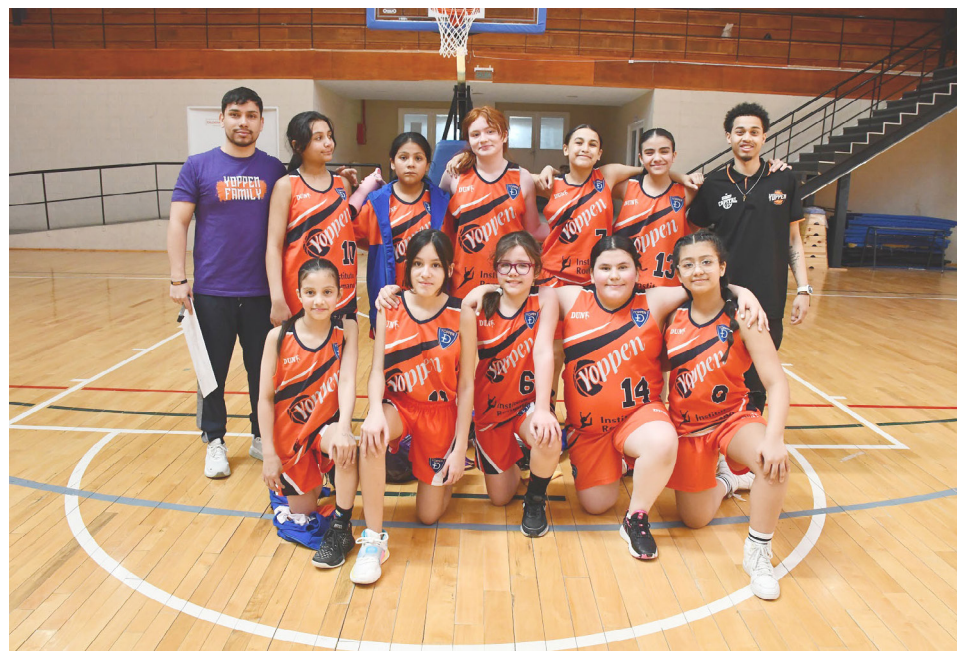
El equipo del club Yoppen, categoría femenina U13.