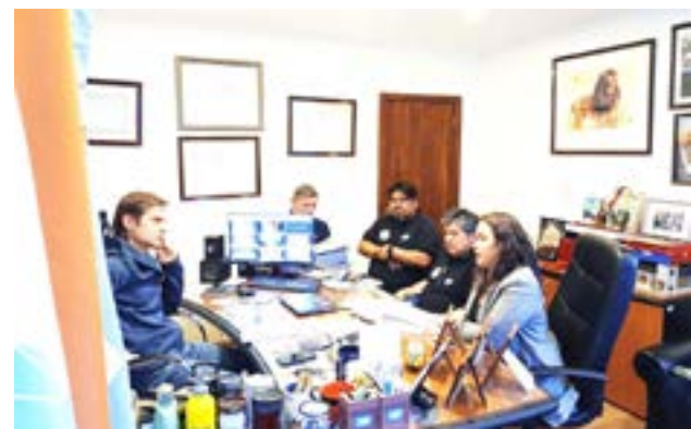
Integrantes de la Comisión Directiva provincial de ATE y el cuerpo de abogadas del sindicato, mantuvieron una reunión con el presidente de la Comisión de Presupuesto, el legislador Federico Sciurano.

ATE convocó a una asamblea para definir acciones, sin descartar medidas de fuerza ante la falta de una propuesta superadora al 2% de aumento ofrecido por el Gobierno. "No queremos viajar para que nos digan que no hay nada. Los trabajadores merecen respeto y soluciones urgentes", concluyó Córdoba.