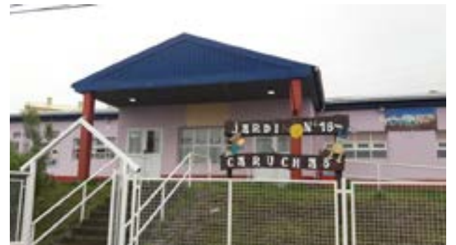
Desde el Sindicato Unificado de Trabajadoras y Trabajadores de la Educación Fueguina (SUTEF) repudiaron “enérgicamente un nuevo acto de violencia en el Jardín de Infantes nro. 18 “Caruchas” de Ushuaia”.

“Convocamos a toda la comunidad a acompañar este