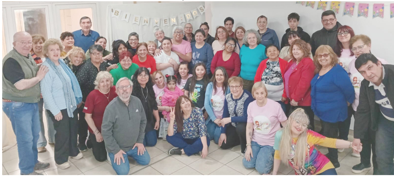
La Parroquia Sagrada Familia celebró el Día de la Madre y el Mes de la Familia con una merienda para toda la comunidad

La jornada tuvo como propósito celebrar y agradecer el valor de las madres y de la familia como pilar fundamental de la comunidad. Los presentes disfrutaron