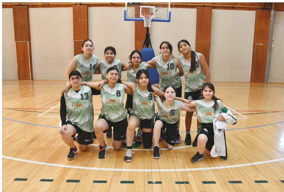
El equipo del club Defensores, categoría femenina U13.