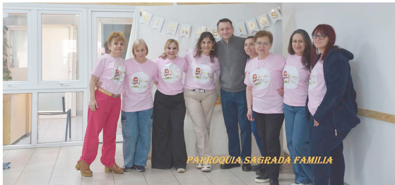
Con una amplia participación vecinal, la Parroquia Sagrada Familia reafirmó una vez más su rol como espacio de encuentro, contención y acompañamiento espiritual en la ciudad de Río Grande.